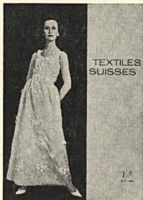
JACQUES HEIM Organza brodé avec motifs de guipure de Forster Willi & Co., Saint-Gall. Grossiste à Paris: Robert Burg & Cie