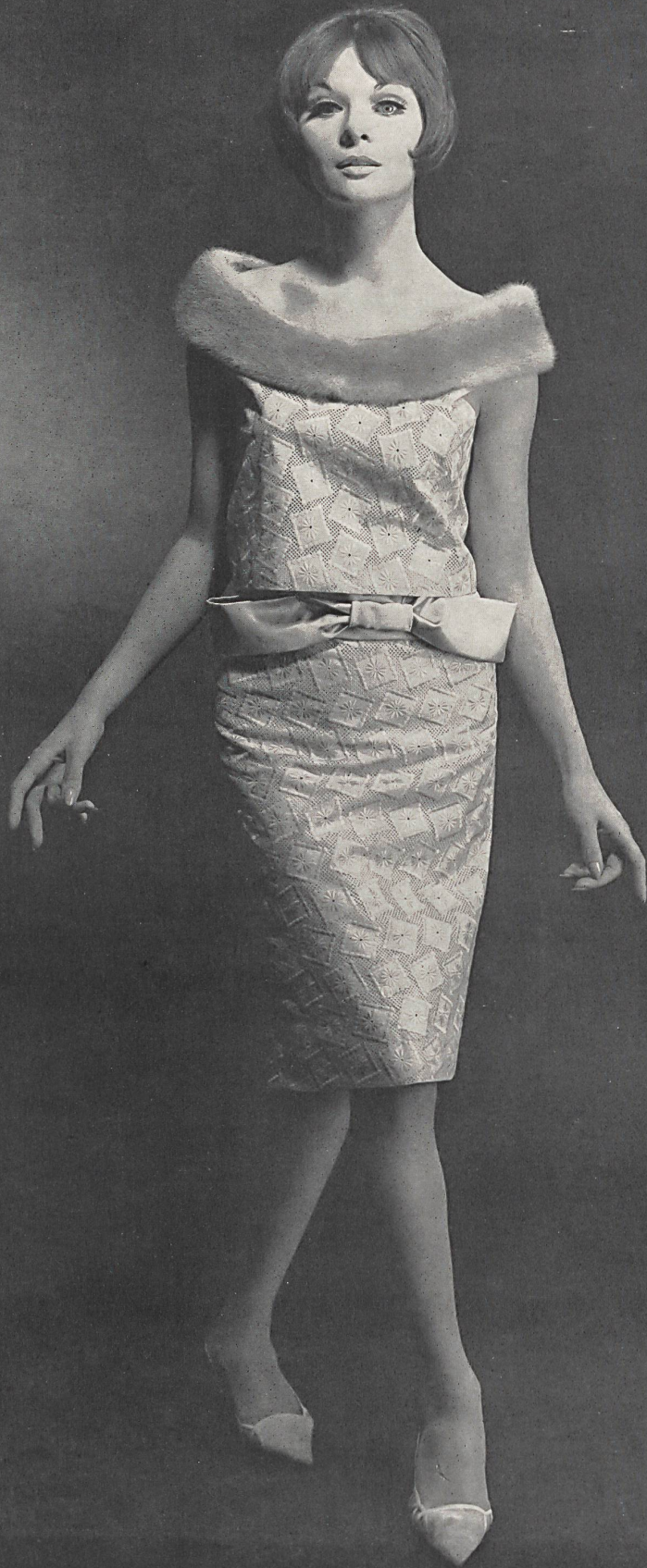
« ABC », ALEX BAUER & CO., SAINT-GALL Batiste brodée / embroidered / bordada / bestickt Modèle épinglé pin dress model Modelo sujeto con alfileres por / aufgestecktes Kleid von: Werner Hoehn, Zurich