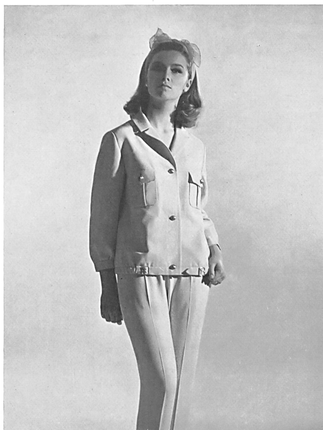
Deux-pièces de sport en «Hélanca», 100 % «Térylène» Modèle: Jacob Weil & Co., Zurich

Recientemente tuvo lugar en Zurich la exposición de tejidos a base de «Terylene» producidos en todos los países de la AELC, a la que participaron, entre otros, 40 fabricantes suizos. Llamaron la atención principalmente los productos de «Sedusa», un tejido fino estilo batista de puro «Terylene» con el que se puede producir bordados fáciles de cuidar. También de puro «Terylene», mencionaremos los tejidos elásticos y los artículos de malla hechos con el nuevo hilo texturizado, llamado «Crimplene». Entre los tejidos mezclados mencionaremos dos que, gracias a un nuevo procedimiento de acabado, son suaves y lanosos al tacto, los numerosos dibujos de mezclas con lana, y los tejidos para vestidos impermeables de mezclas con lana, algodón o rayón, impregnados y a menudo también contrapegados con espuma de plástico, así como un nuevo satén «Terylene»-algodón.