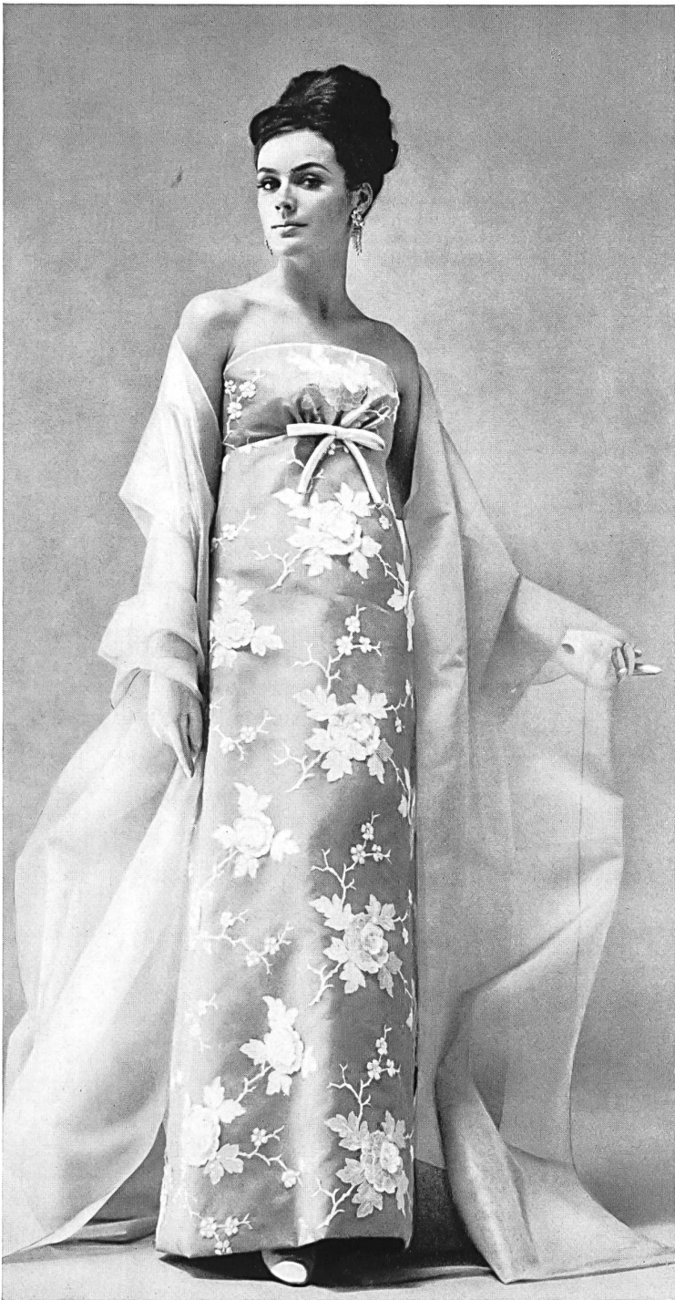
UNION S.A., SAINT-GALL Broderie avec applications sur organdi White appliqué embroidered organdy Modèle: Sarmi

Swiss Fabric and Embroidery Center, New York