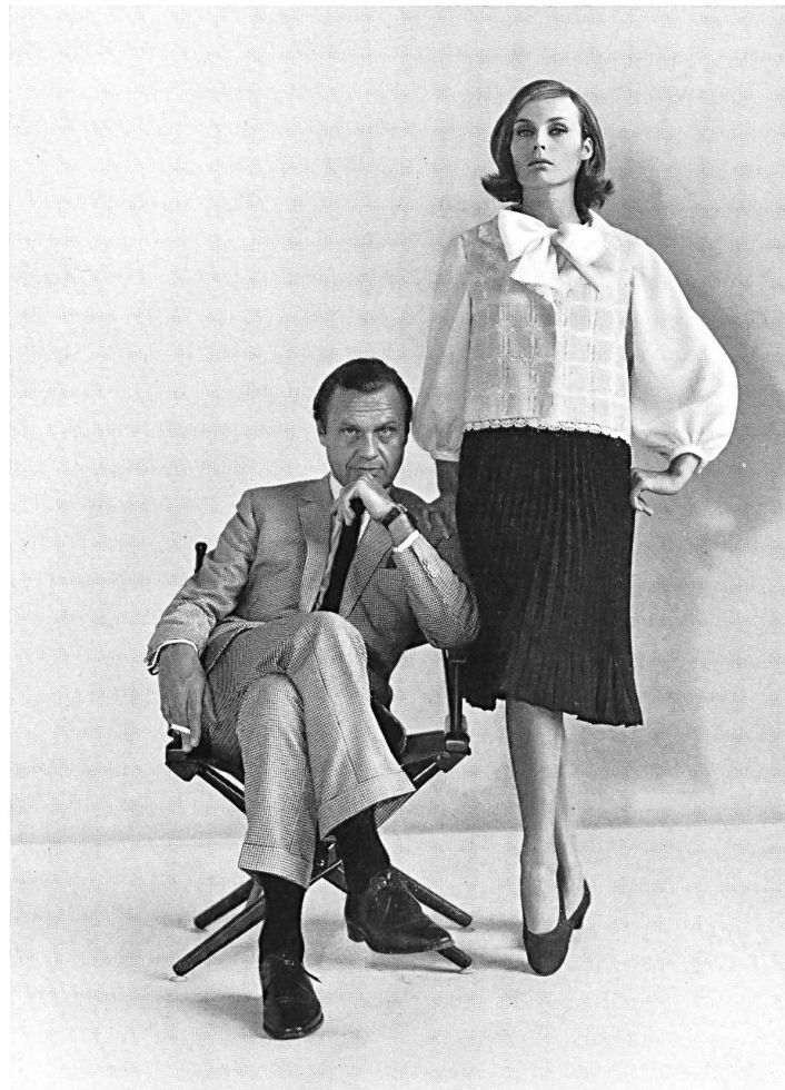
Swiss Fabric and Embroidery Center, New York