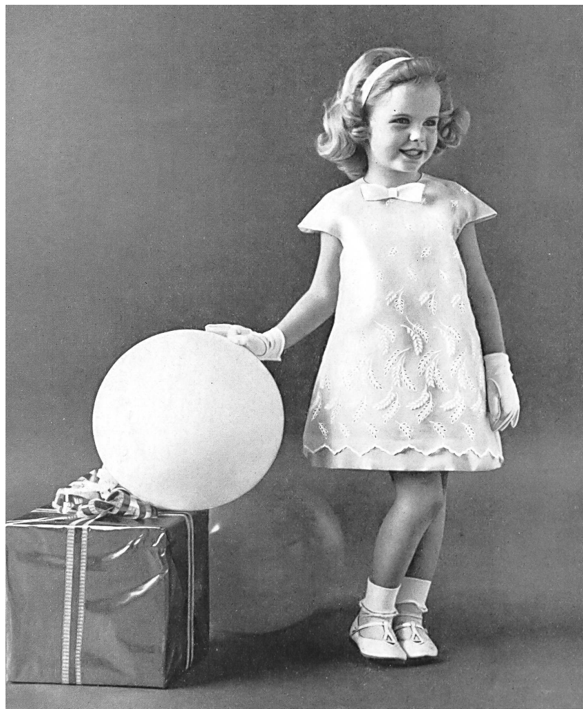
« NELO », J. G. NEF & CO. S.A., HÉRISAU Organdi blanc brodé White embroidered organdie Modèle de Youngland