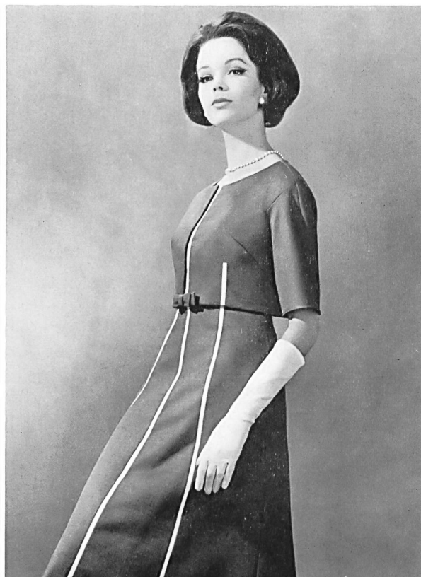
1 Abrigo para la noche, de tejido fino de algodón estructurado suizo