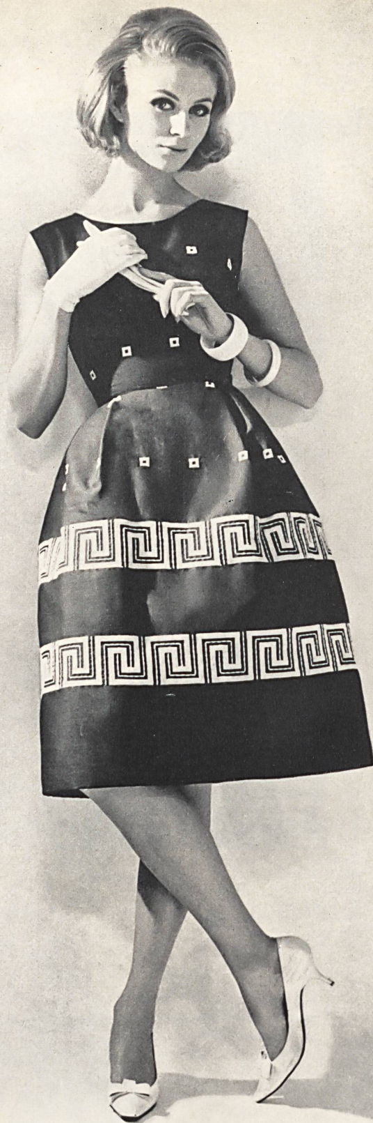
« RECO », REICHENBACH & CIE S. A., SAINT-GALL Batiste « Minicare » brodée / em- broidered / bordado / bestickt Modèle Baker Sportswear, London

túnica fue muy aplaudido desde su entrada; era de un tejido transparente bordado, de Forster Willi, de color negro profundo sembrado con margaritas dobles de color verde y con un bolero a la moda y una corbata de raso negro que le confería una elegancia a pesar de su extrema sencillez. Había otro modelo hecho con un bordado, de Forster Willi también, de superior categoría: tratábase de un vestido corto con cinturón de cuero charolado negro. Como bien lo sabe Cavanagh, estos soberbios bordados suizos requieren poco adorno y, lo que necesitan, es tan sólo un corte sabio.