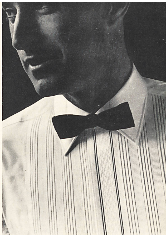
STOFFEL S. A., SAINT-GALL Tissu « Aquaperl » / fabric Modèle Driway