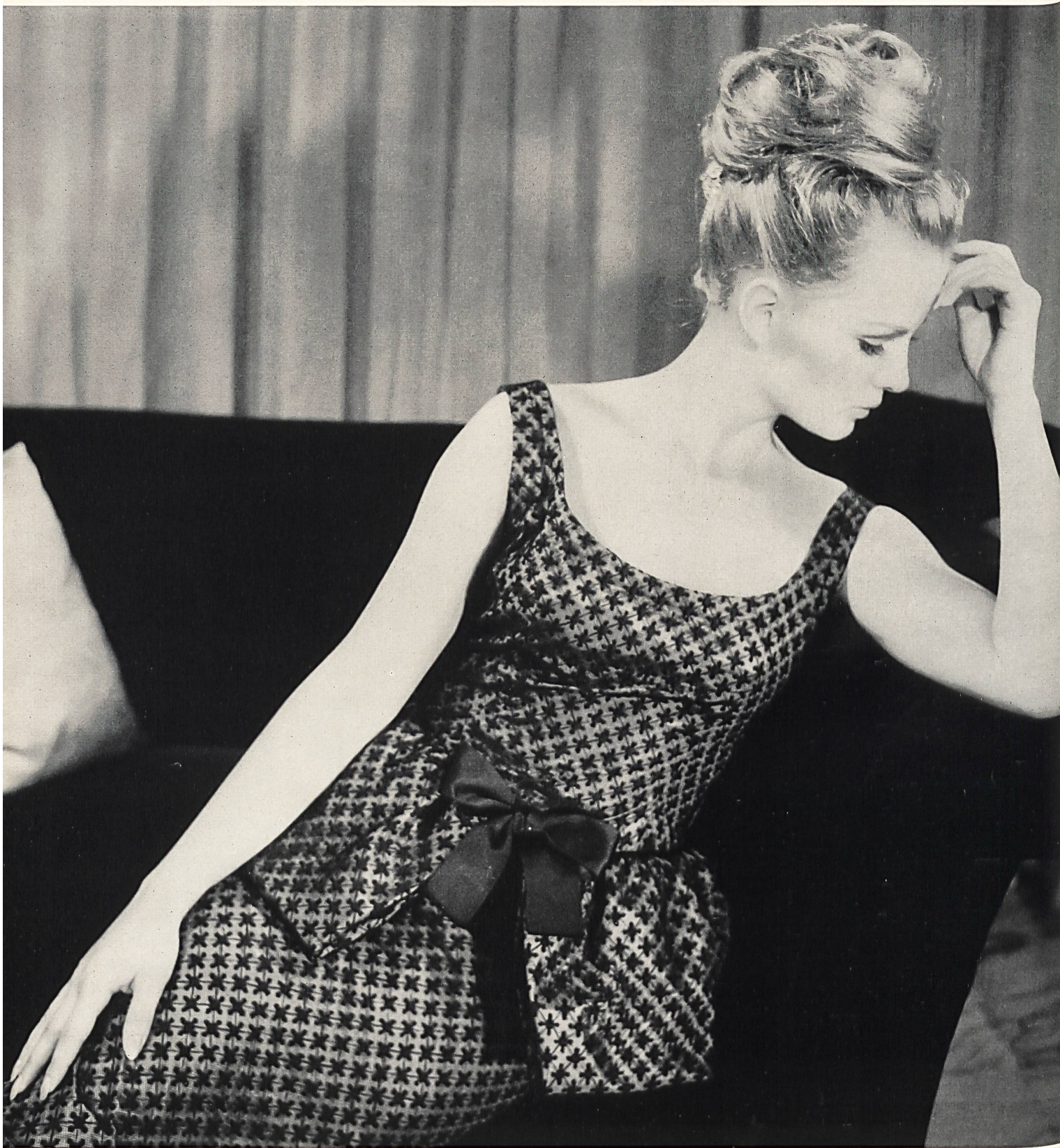
PHILIPPE VENET Tulle de nylon brodé coton de Forster Willi & Co., Saint-Gall Grossiste à Paris : Robert Burg & Cie