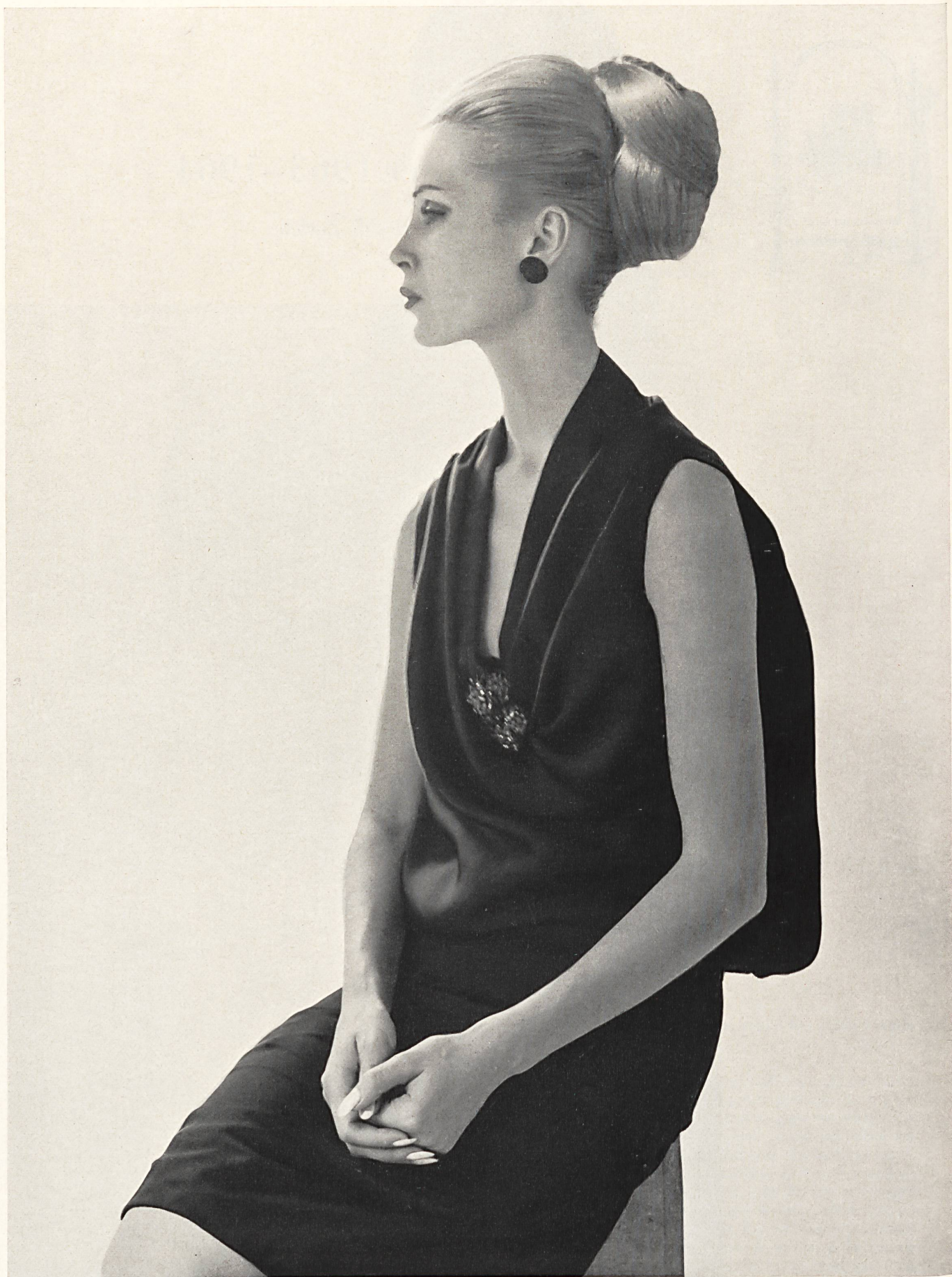
CHRISTIAN DIOR «Satin grenadine» de L. Abraham & Cie, Soieries S.A., Zurich