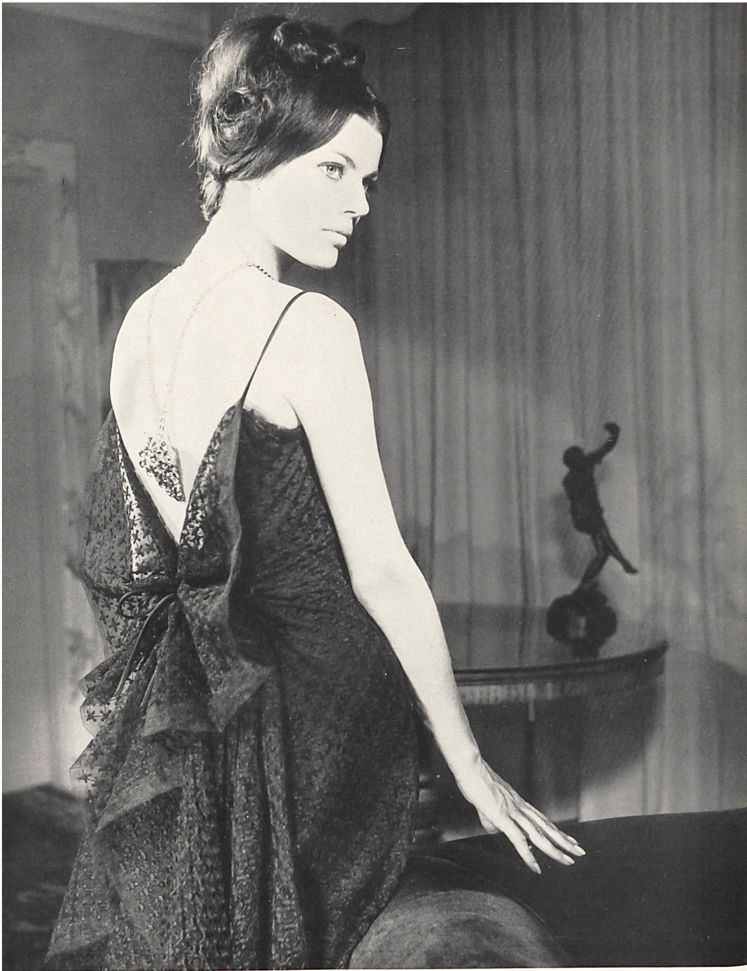
CARVEN Tulle de Nylon, coton brodé de Forster Willi & Co., Saint-Gall Grossiste à Paris: Robert Burg & Cie