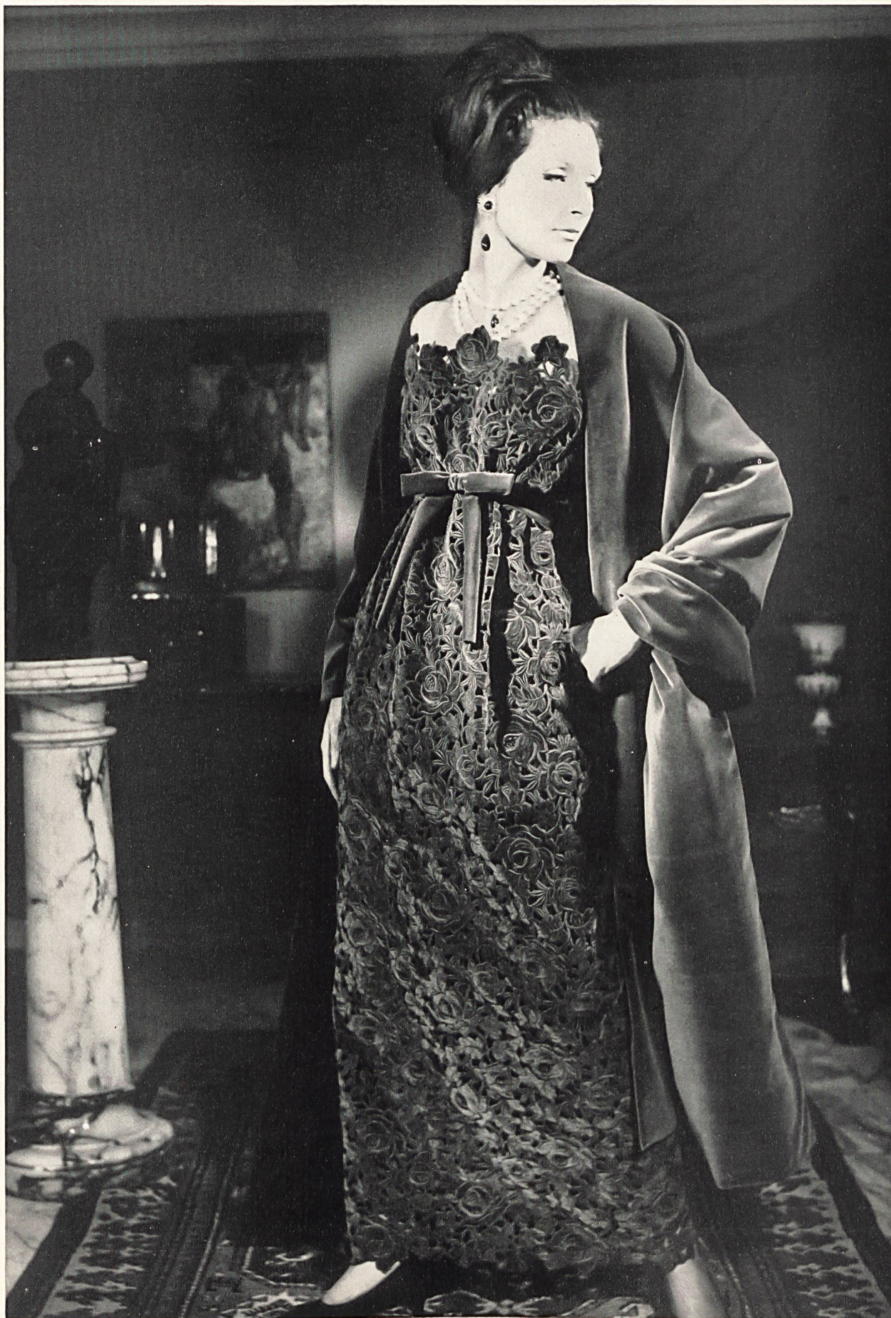
GUY LAROCHE Dentelle de velours découpé en couleur avec effets de super- position de Union S.A., Saint-Gall Grossiste à Paris: Robert Burg & Cie

MODÈLES EXCLUSIFS - REPRODUCTION INTERDITE