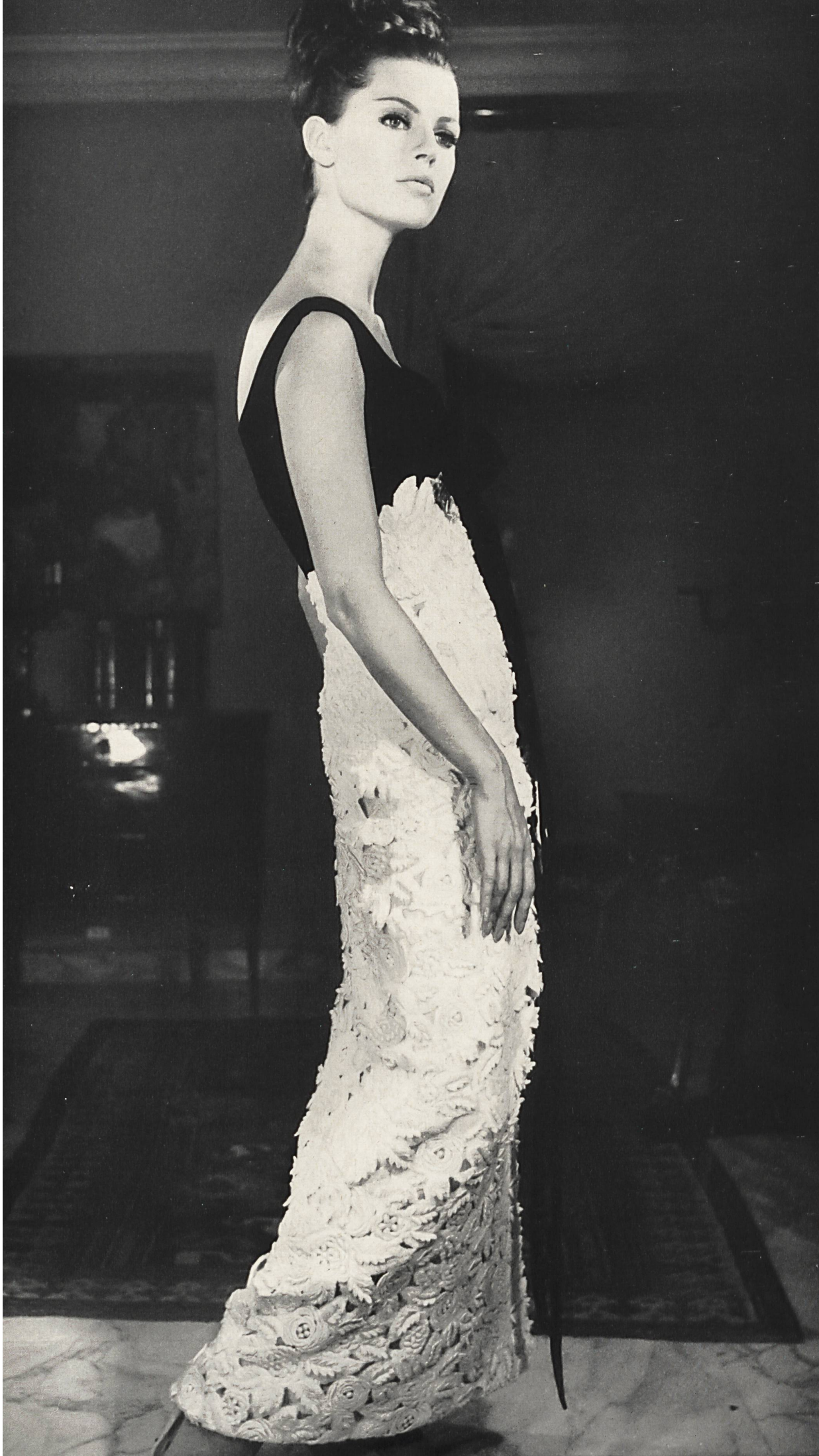
GUY LAROCHE Guipure de laine sur fond de laine, broderie superposée de Jacob Rohner S. A. Rebstein (Saint-Gall) Grossiste à Paris : Robert Burg & Cie