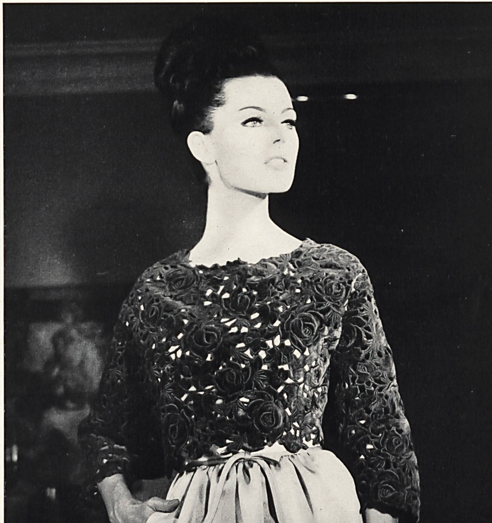
PIERRE CARDIN Dentelle de velours découpée en couleur avec effets de superposition de Union S. A., Saint-Gall Grossiste à Paris : Robert Burg & Cie