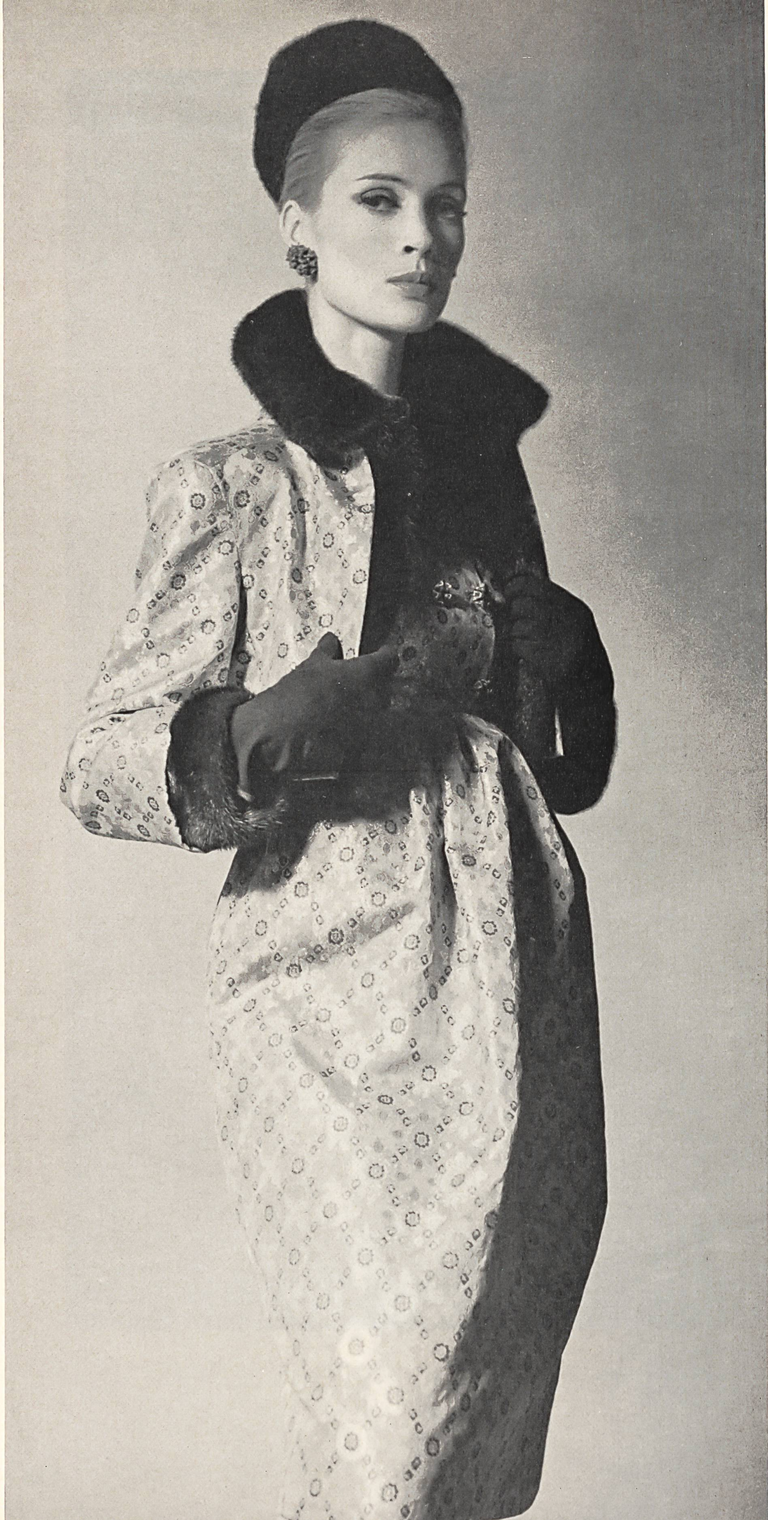
CHRISTIAN DIOR Soie brochée «Emir» de L. Abraham & Cie, Soieries S.A., Zurich