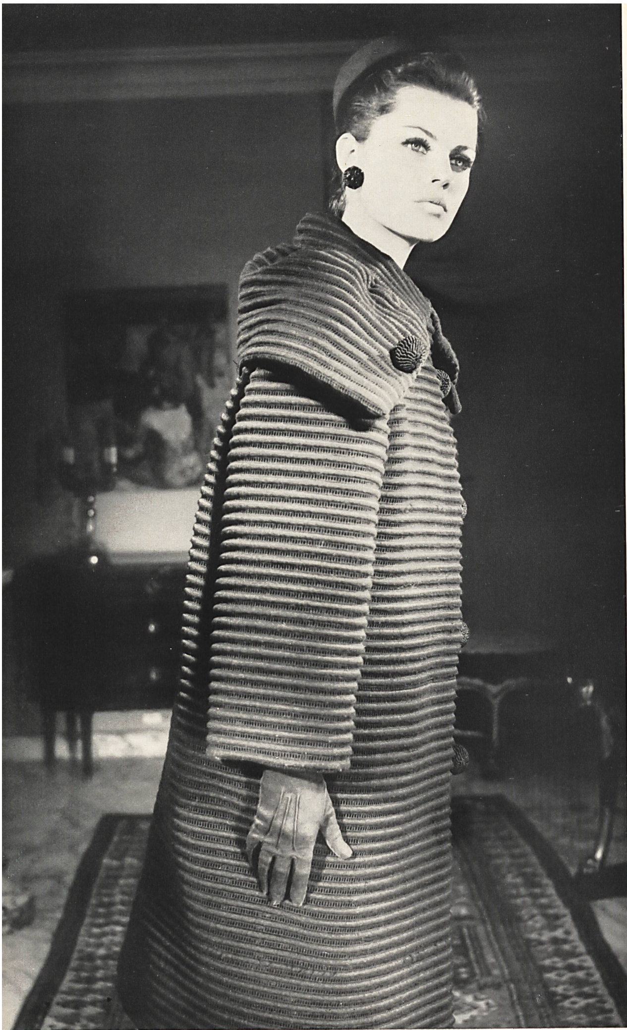
CHRISTIAN DIOR Laize brodée noire pure laine avec effets de jours de Rau S.A., Saint-Gall