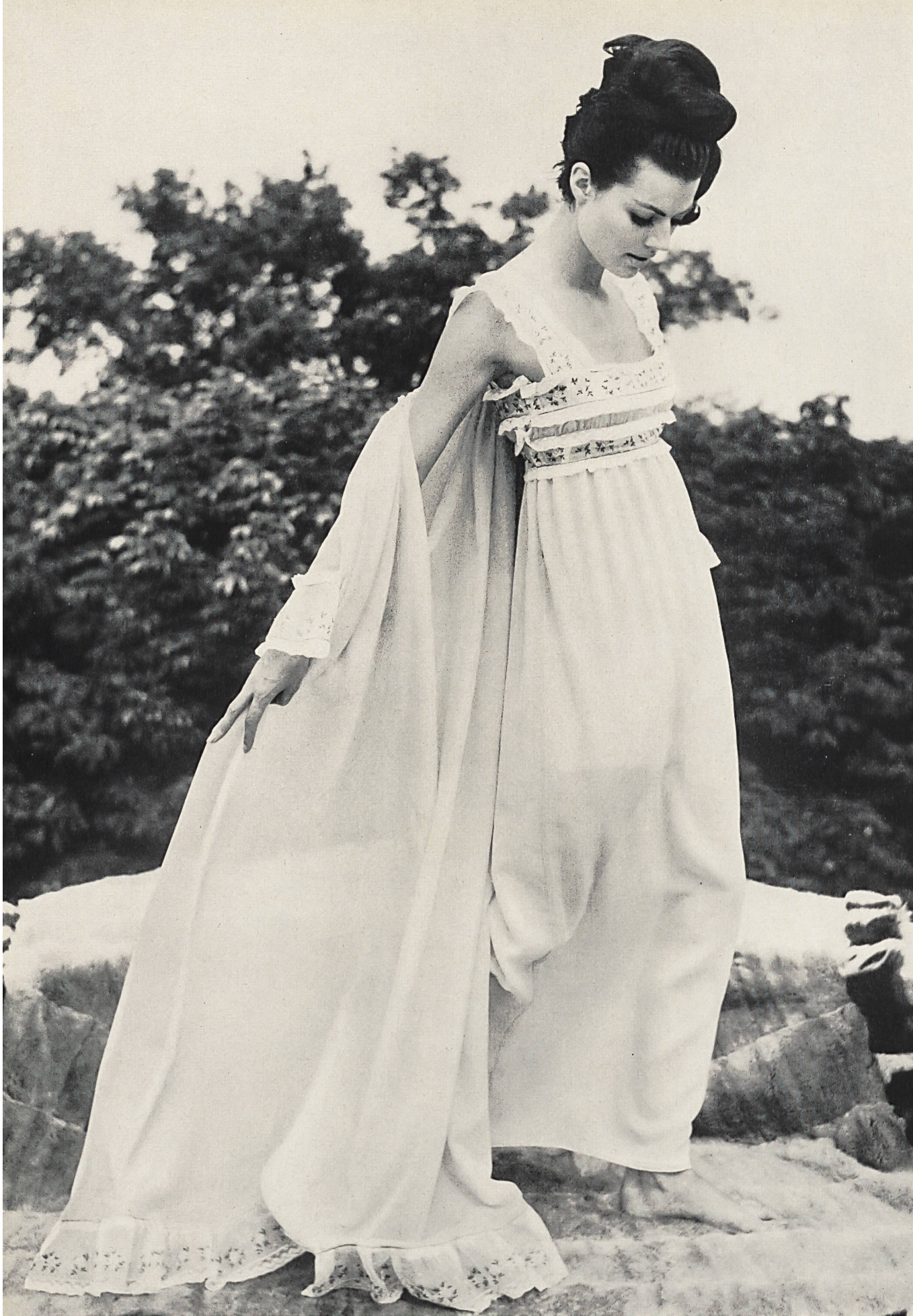
CHRISTIAN DIOR (Boutique) Bandes d'organdi brodées couleur avec dentelles de A. Naef & Cie S. A., Flawil (Saint-Gall)