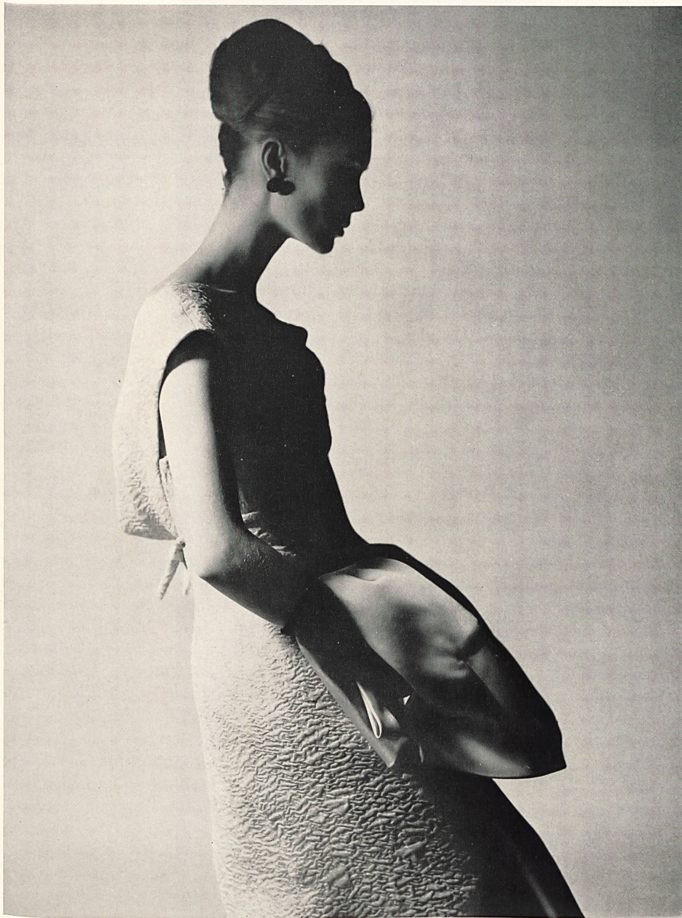
PIERRE BALMAIN Cloqué «Tric» et manteau en «Satin double face» de L. Abraham & Cie, Soieries S.A., Zurich