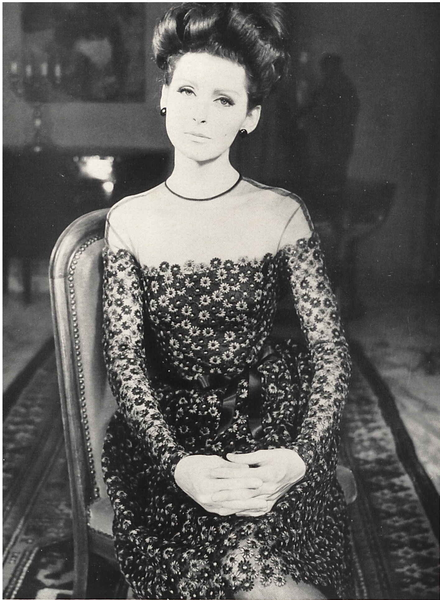
GUY LAROCHE Tulle de Nylon brodé coton de Forster Willi & Cie, Saint-Gall Grossiste à Paris: Robert Burg & Cie