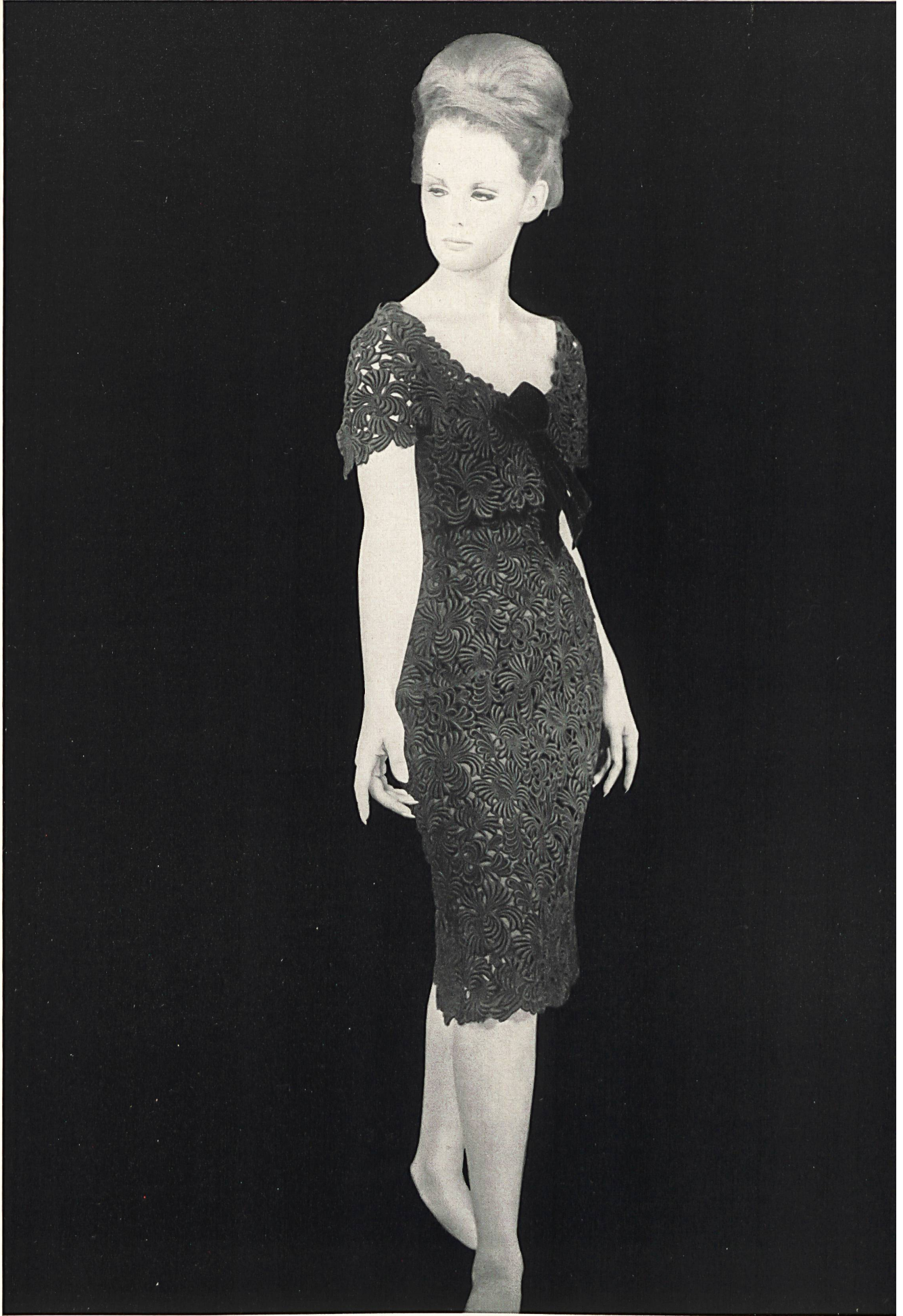
PIERRE BALMAIN Guipure de couleur de Union S. A., Saint-Gall