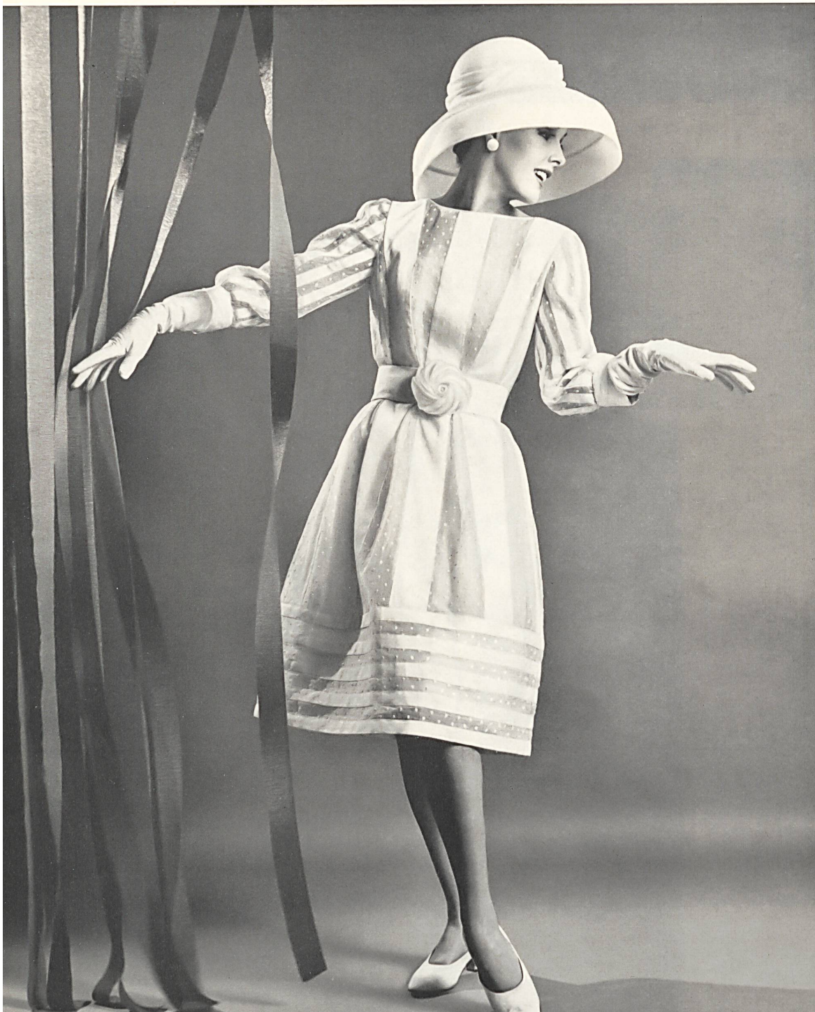
FORSTER WILLI & CO., SAINT-GALL White embroidered dotted organdy Organdi blanc brodé de pois Dress by Paul Whitney, Beverly Hills

Michael Novarese, aunque sólo desde hace pocos años en California, ha obtenido un éxito completo y ha logrado imponerse en todo el país entre la parroquia que busca