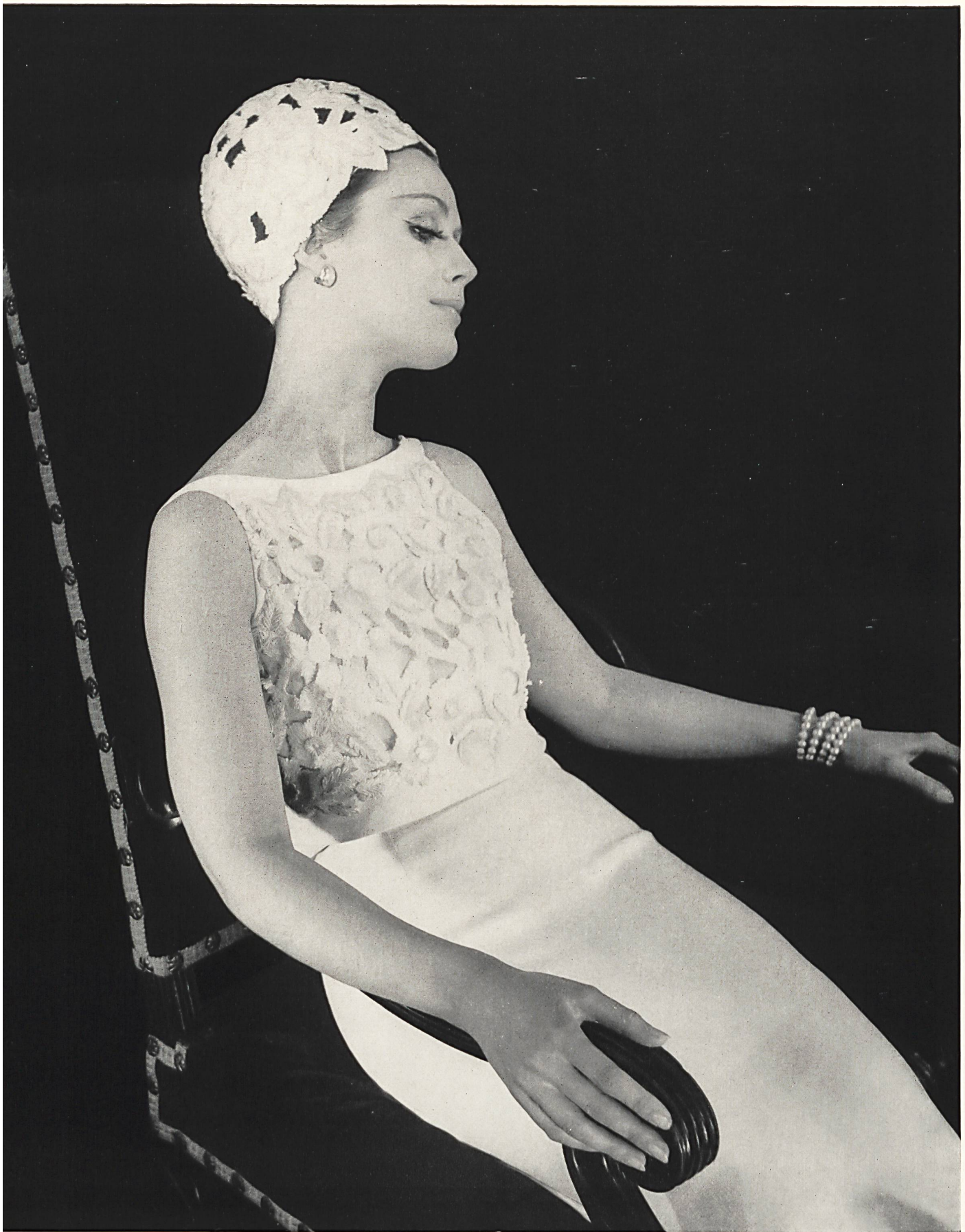
PIERRE BALMAIN Dentelles de guipure ficelle de Jacob Rohner S. A. Rebstein / Saint-Gall