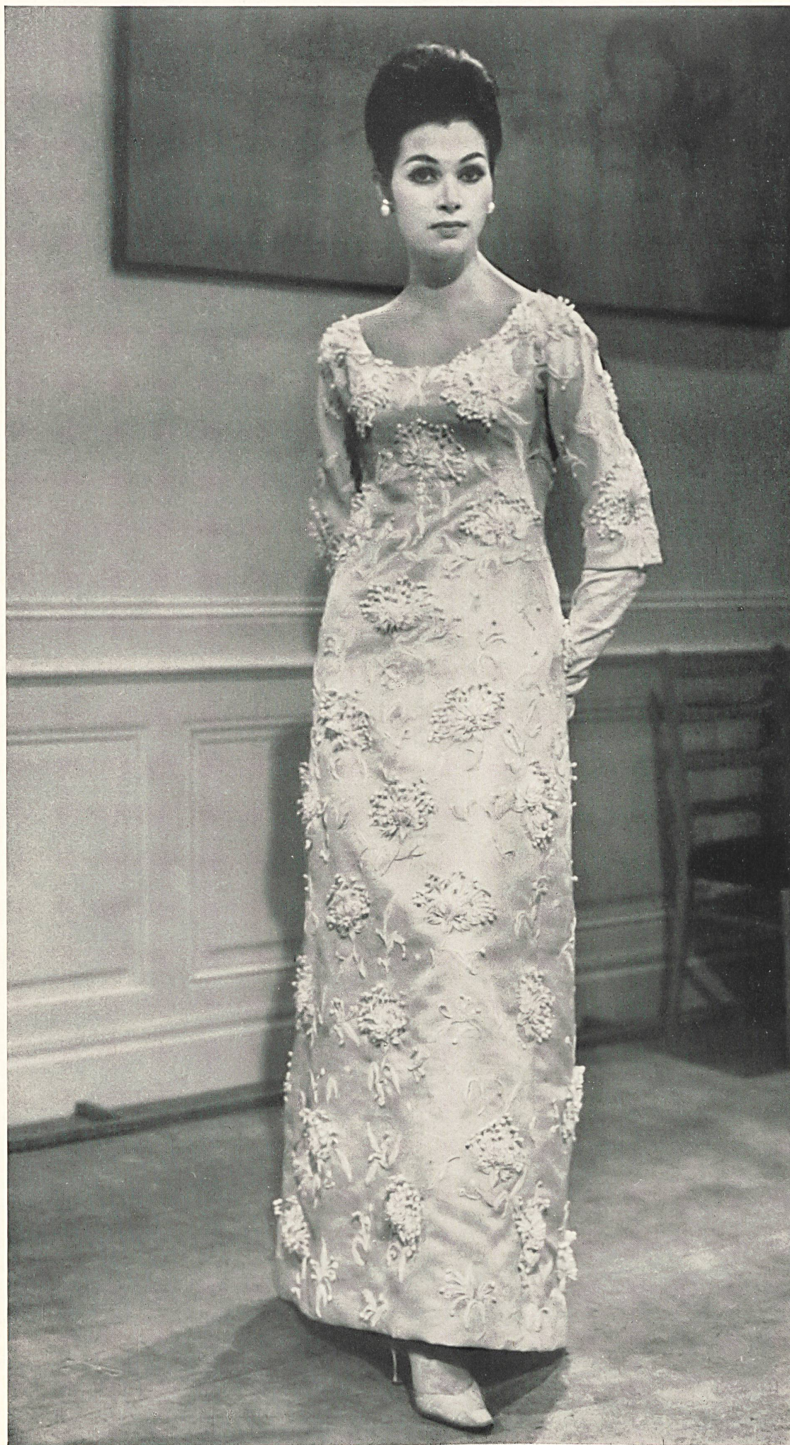
YVES SAINT-LAURENT