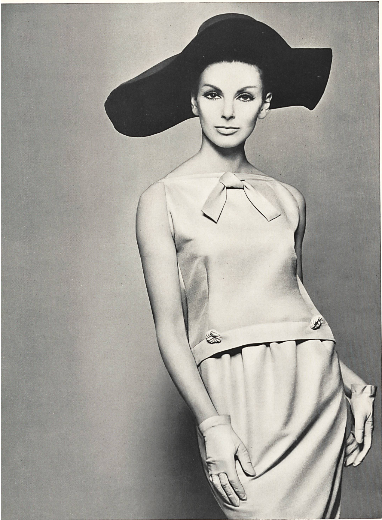
PIERRE CARDIN Shantung « Favorite » pure soie de Robt. Schwarzenbach & Co., Thalwil