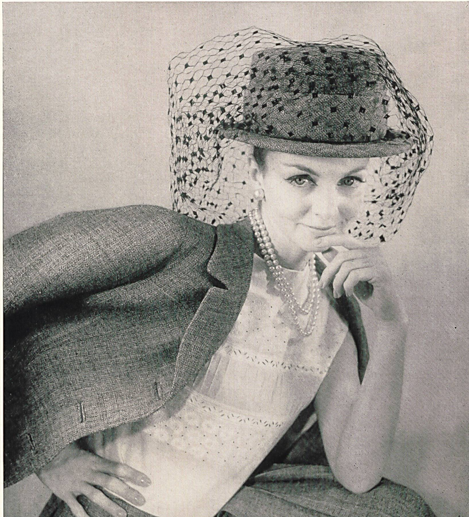
CARVEN Broderie « Nelo » sur « Minicare » Belrosa de J. G. Nef & Co. S. A., Hérissau Grossiste à Paris : Robert Burg & Cie