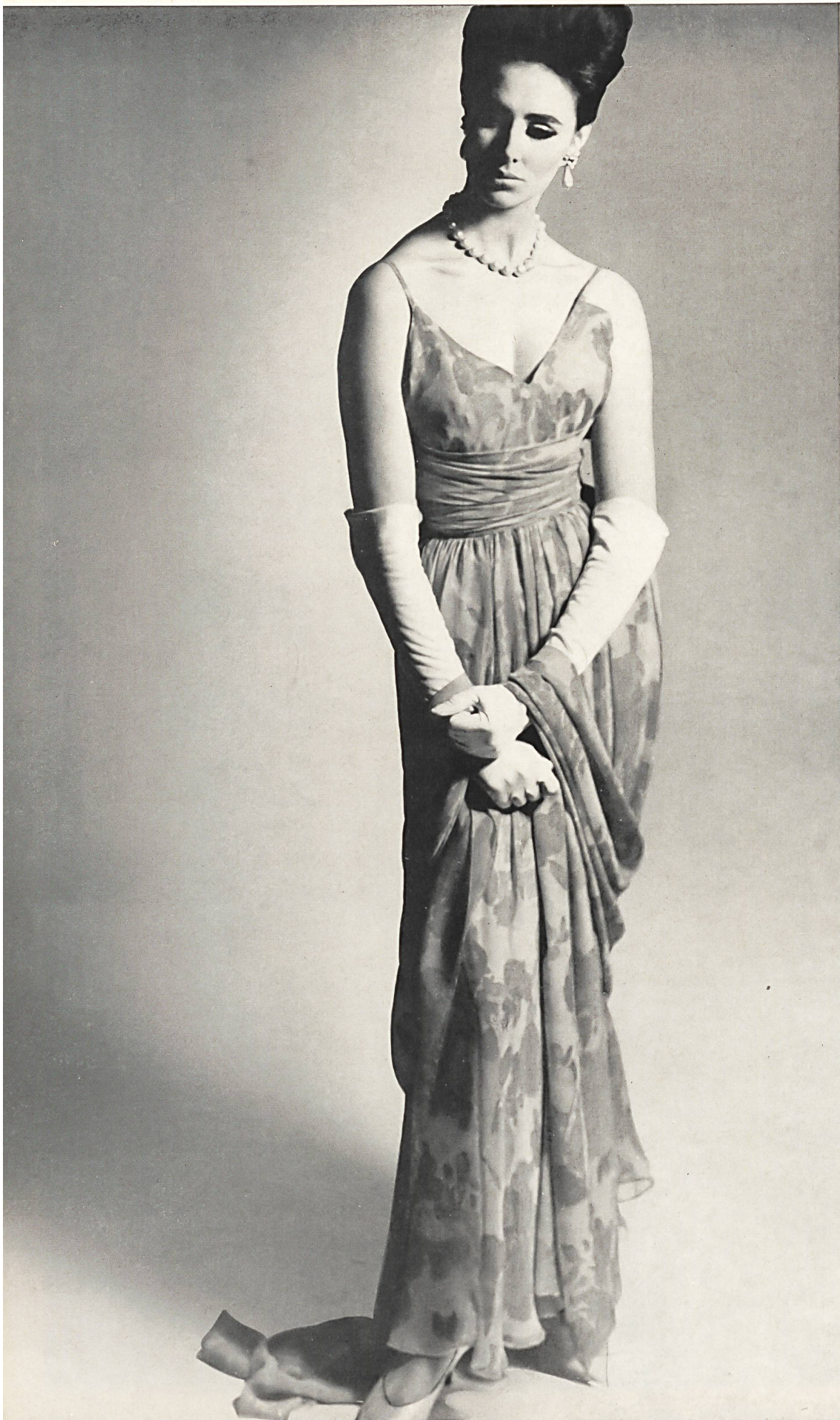
PIERRE BALMAIN Mousseline « Edéa » imprimée de L. Abraham & Cie, Soieries S. A., Zurich