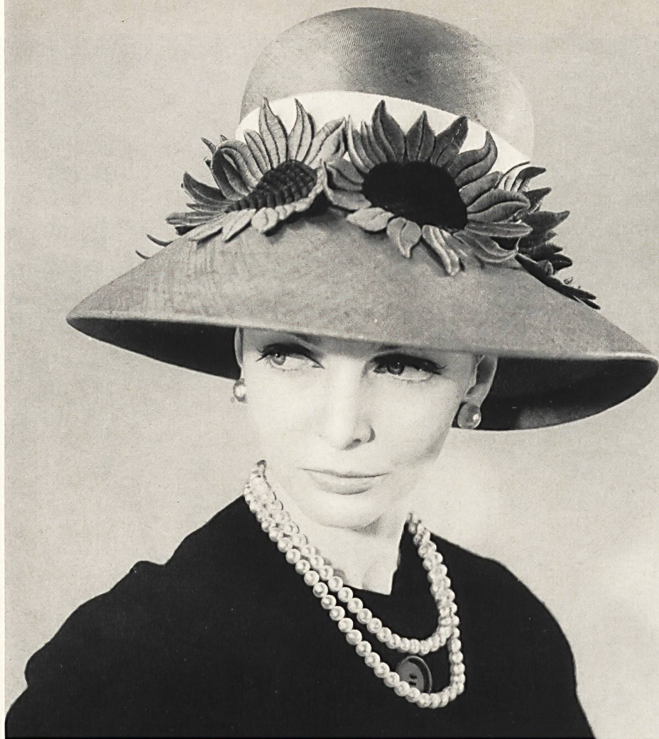
JEANNE LANVIN (DEVAUX) Motifs brodés deux couleurs de Union S. A., Saint-Gall Grossiste à Paris : Robert Burg & C