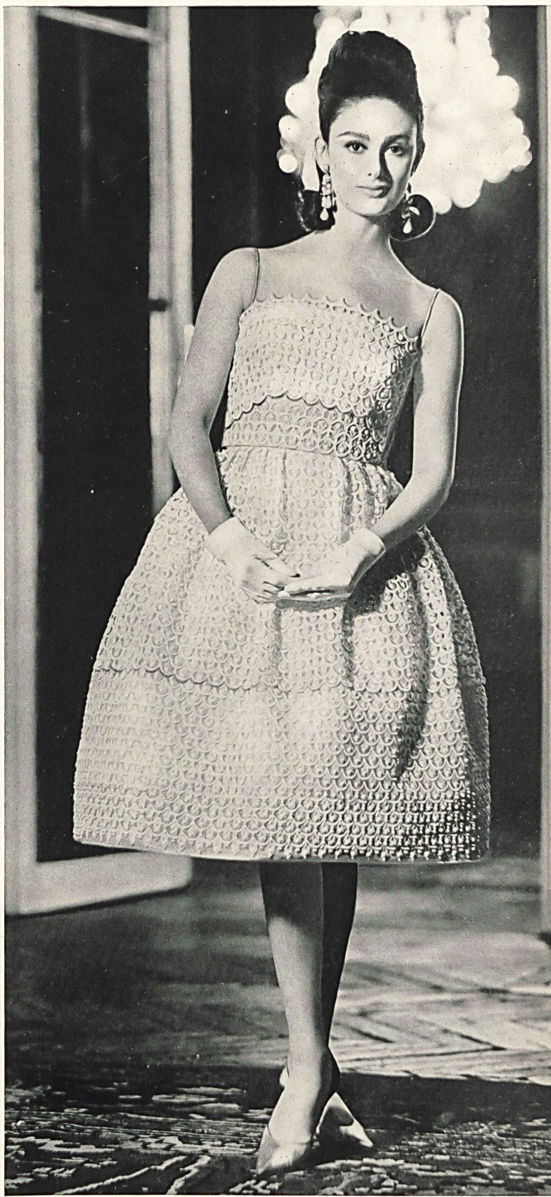
CARVEN Volant de guipure de Forster Willi & Co., Saint-Gall Grossiste à Paris : Robert Burg & Cie