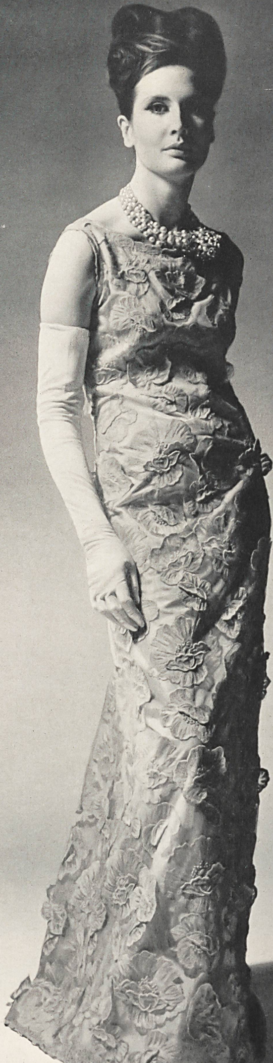
BALENCIAGA Photo Rév