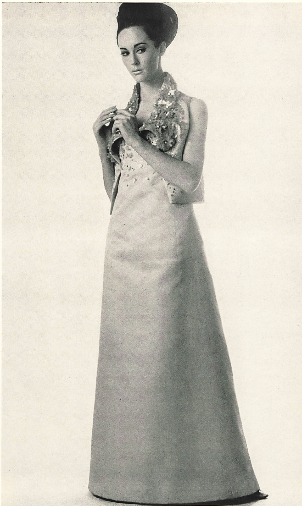
CHRISTIAN DIOR « Tundra » de L. Abraham & Cie, Soieries S. A., Zurich