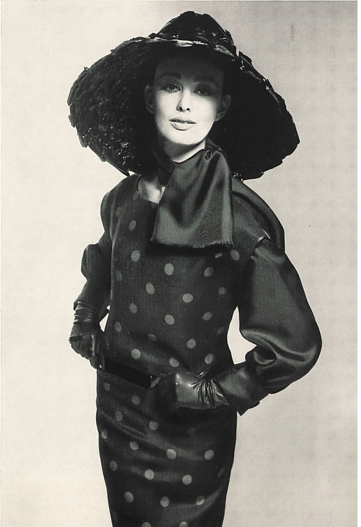
YVES SAINT-LAURENT « Rosco » imprimé de L. Abraham & Cie, Soieries S. A., Zurich

MODÈLES EXCLUSIFS — REPRODUCTION INTERDITE