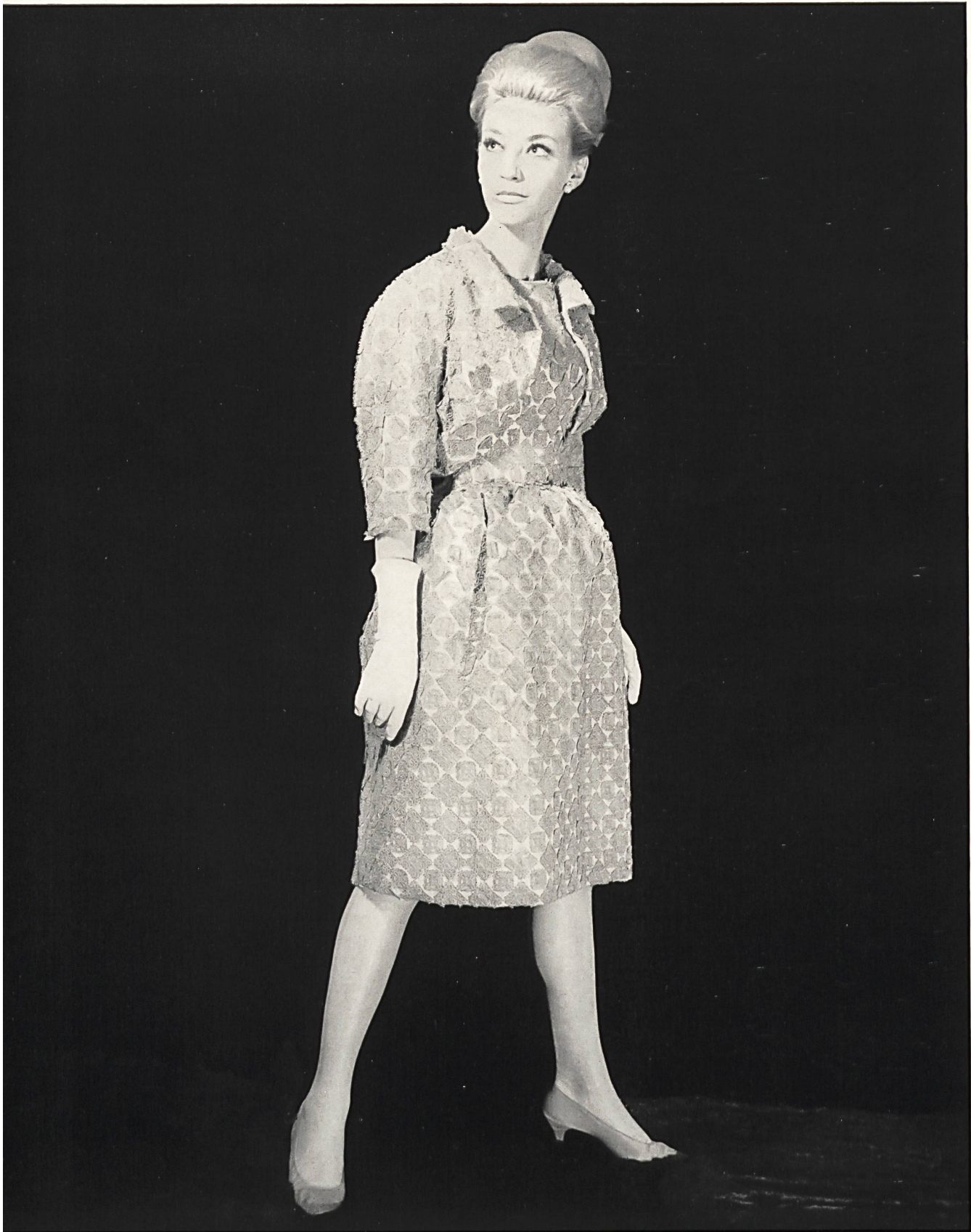
HUBERT DE GIVENCHY