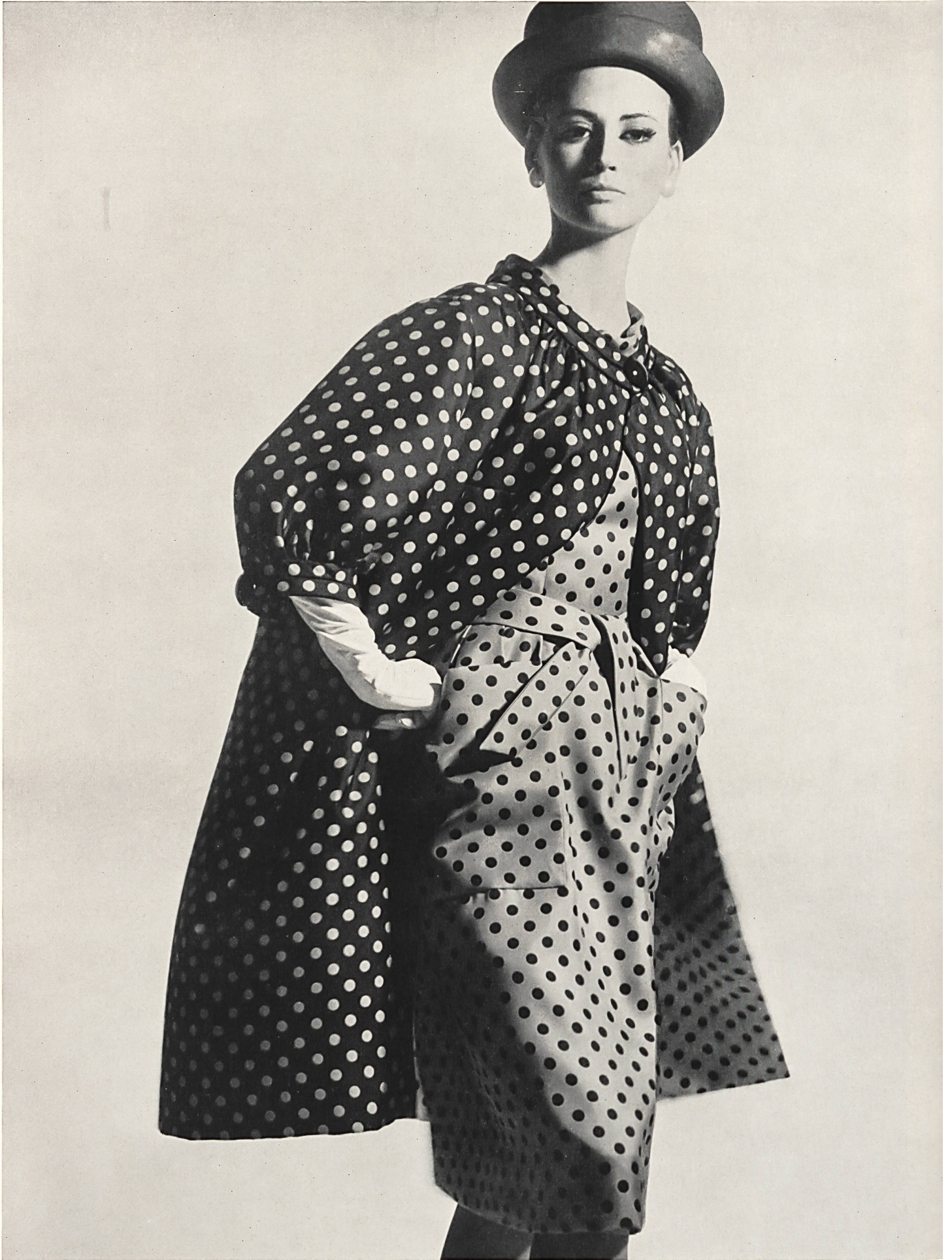
JEANNE LANVIN Twill « Doucine » imprimé de L. Abraham & Cie, Soieries S. A., Zurich