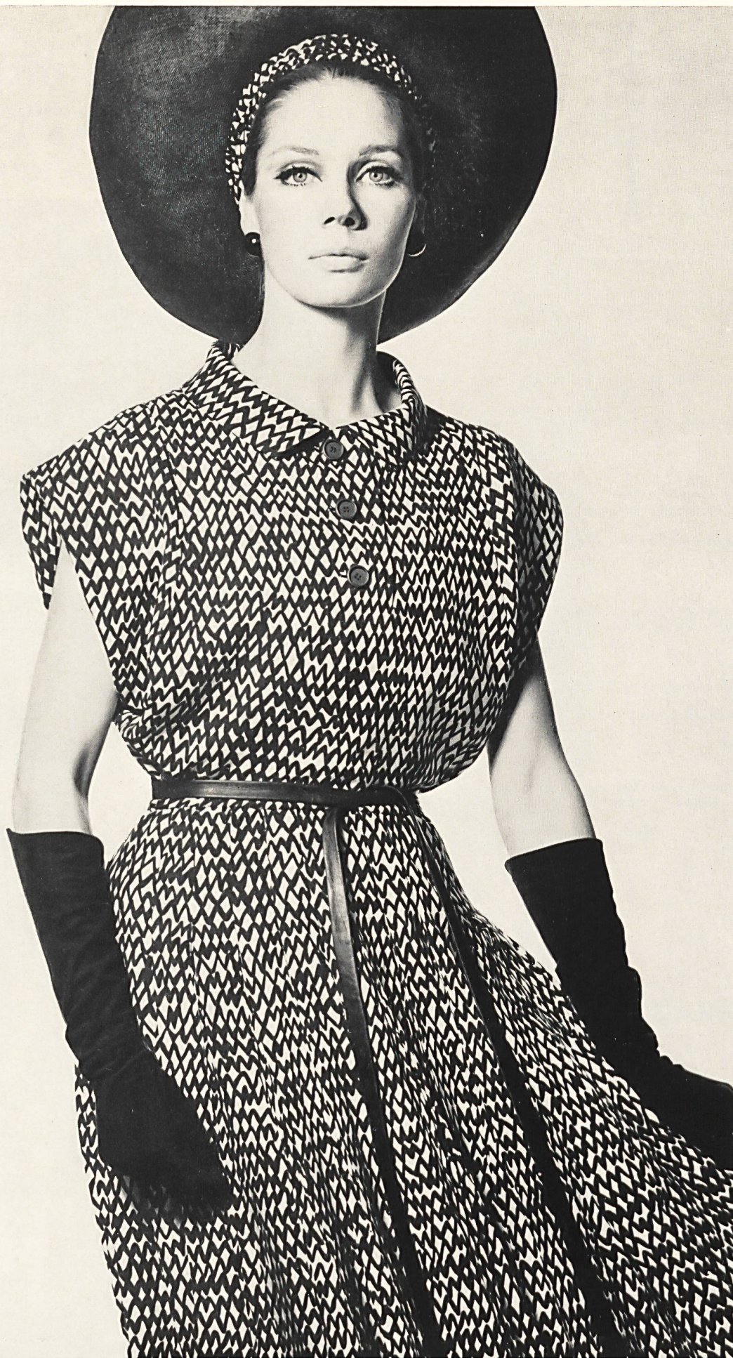
CHRISTIAN DIOR Crêpe « Caroline » imprimé de L. Abraham & Cie, Soieries S. A., Zurich