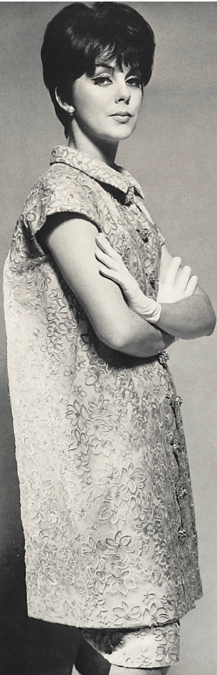
BALENCIAGA Photo Rév