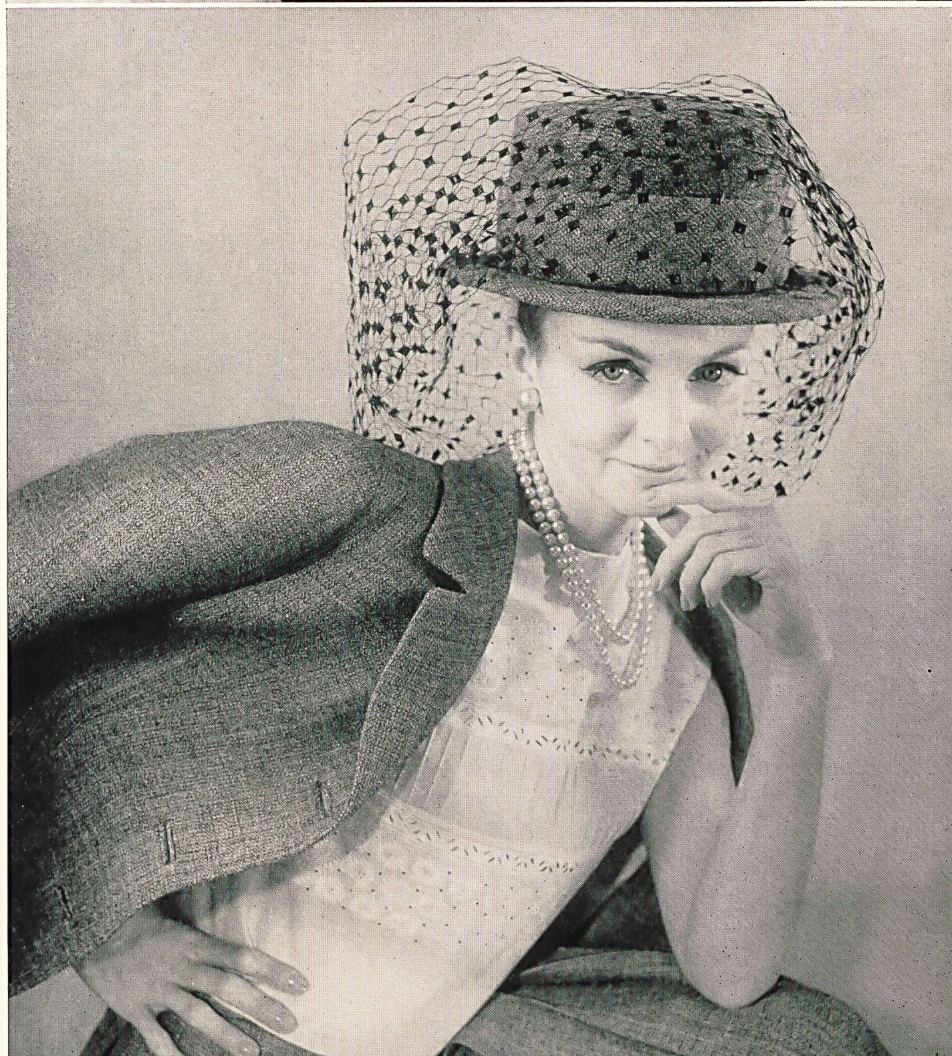
CARVEN Broderie « Nelo » sur « Minicare » Belrosa de J. G. Nef & Co. S. A., Hérissau Grossiste à Paris : Robert Burg & Cie