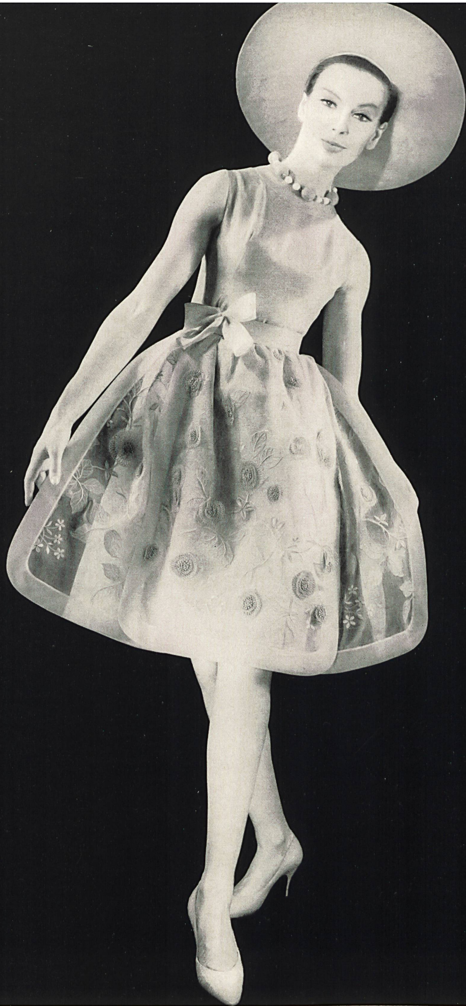
FERRERAS Organdi de soie brodé couleur avec applications de motifs de guipure de Union S. A., Saint-Gall Grossiste à Paris : Robert Burg & Cie