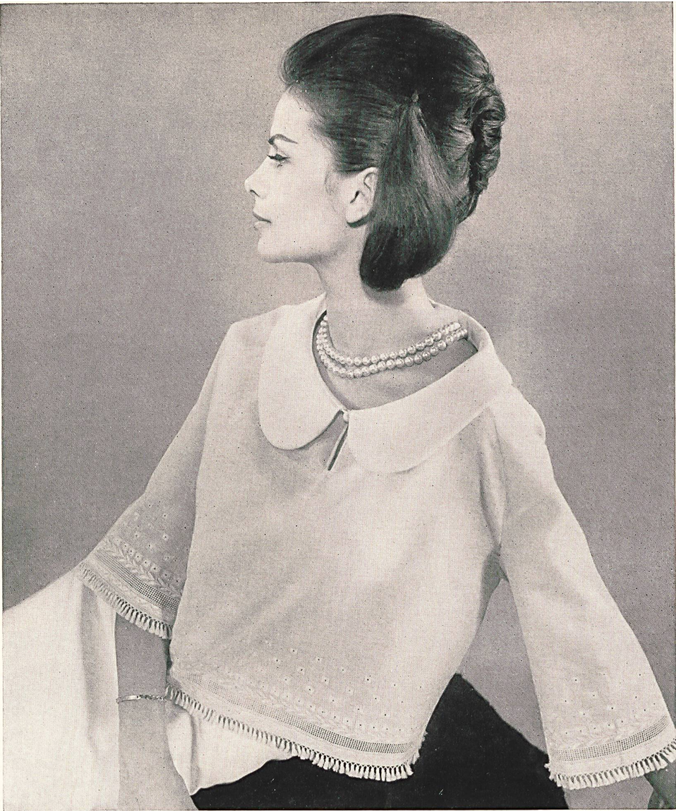
CARVEN Broderie « Nelo » sur « Minicare » Belrosa de J. G. Nef & Co. S. A., Hérissau Grossiste à Paris : Robert Burg & Cie