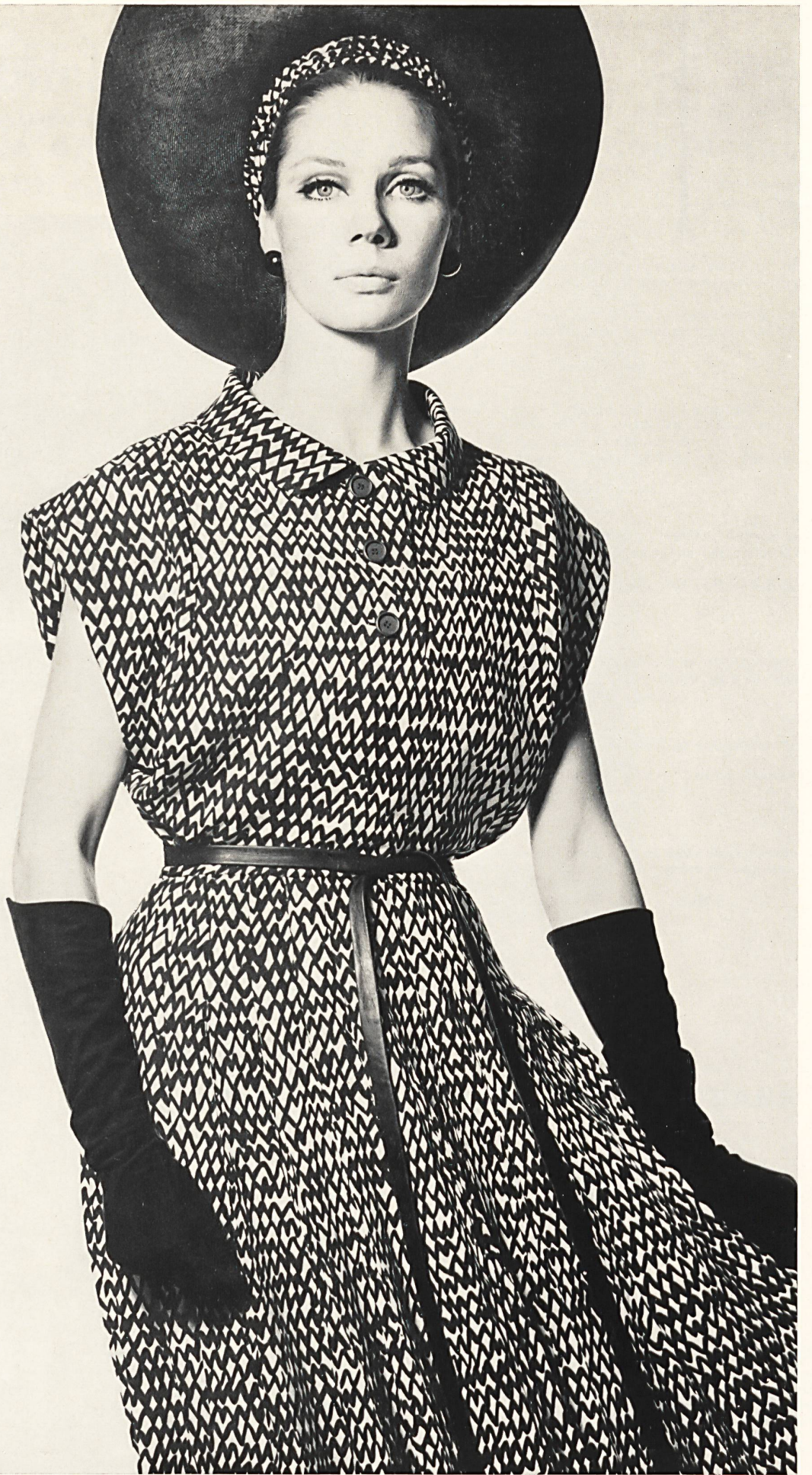
CHRISTIAN DIOR Crêpe « Caroline » imprimé de L. Abraham & Cie, Soieries S. A., Zurich