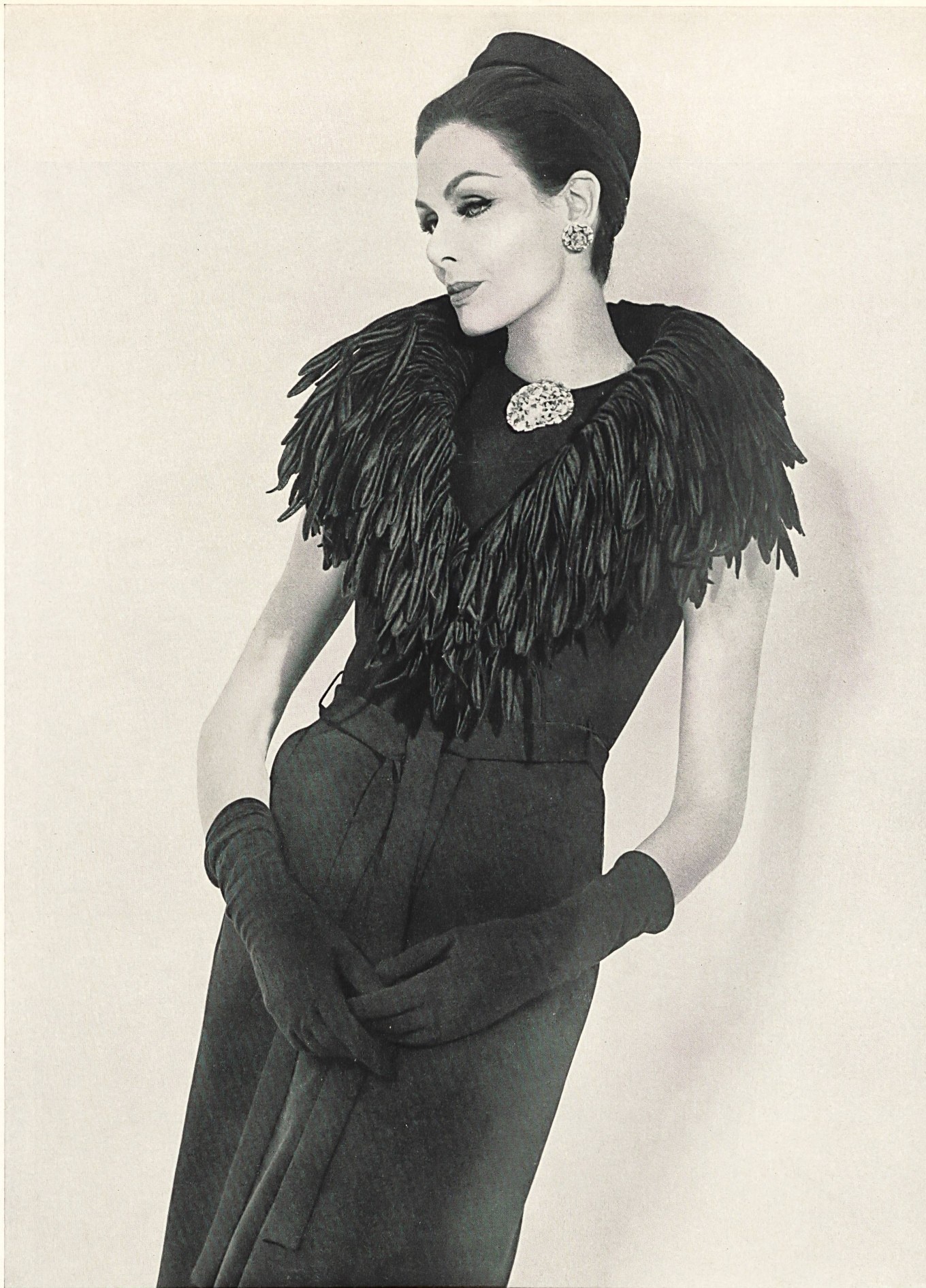
CHRISTIAN DIOR Franges brodées de Forster Willi & Co., Saint-Gall