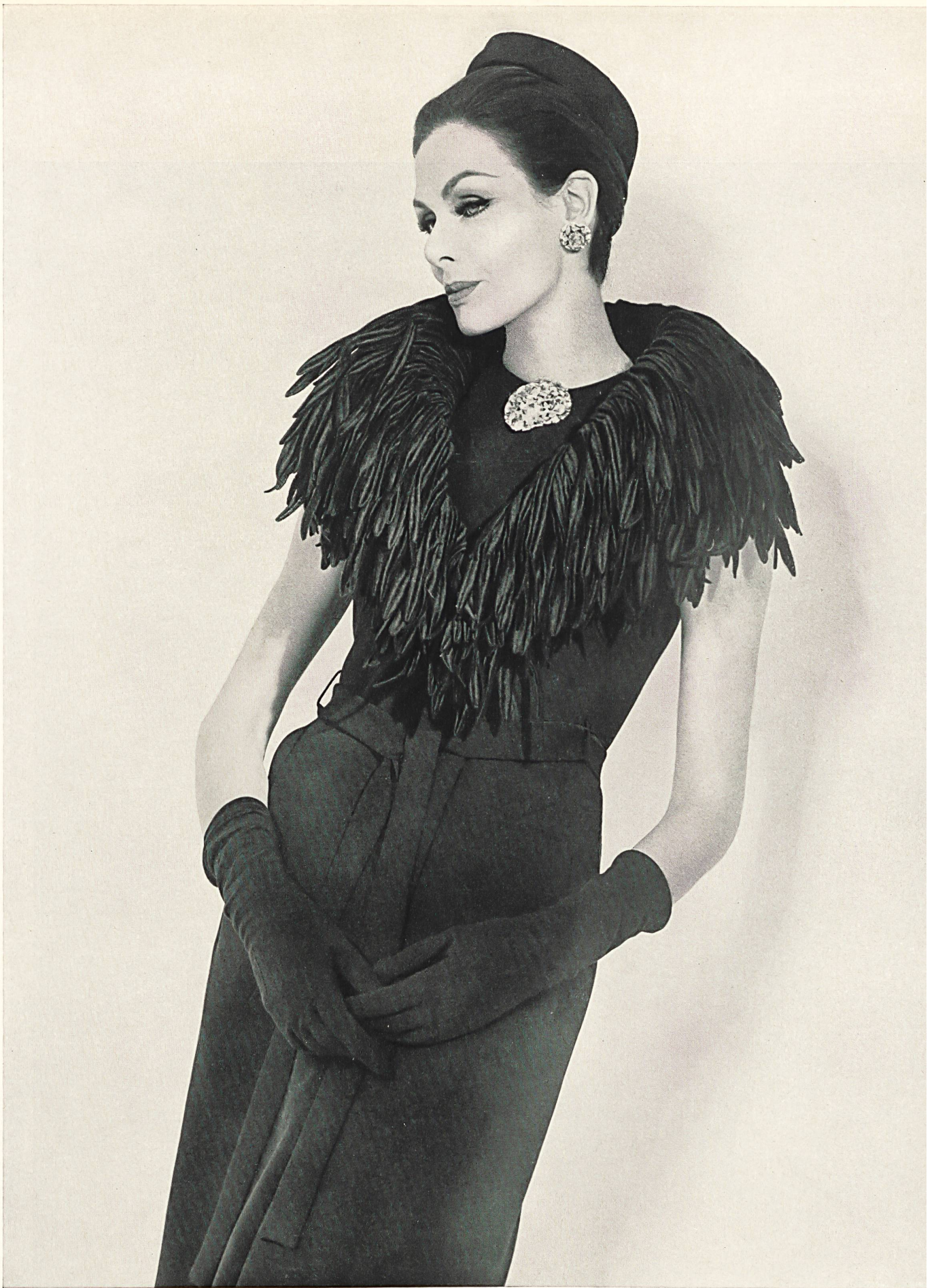
CHRISTIAN DIOR Franges brodées de Forster Willi & Co., Saint-Gall