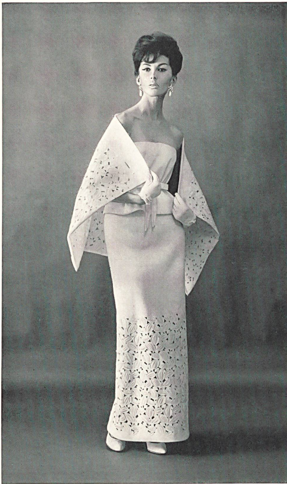
1 FORSTER WILLI & CO., SAINT-GALL Broderie découpée sur piqué de coton blanc Cut out embroidery on white cotton piqué Modèle Arnold Scaasi, New York