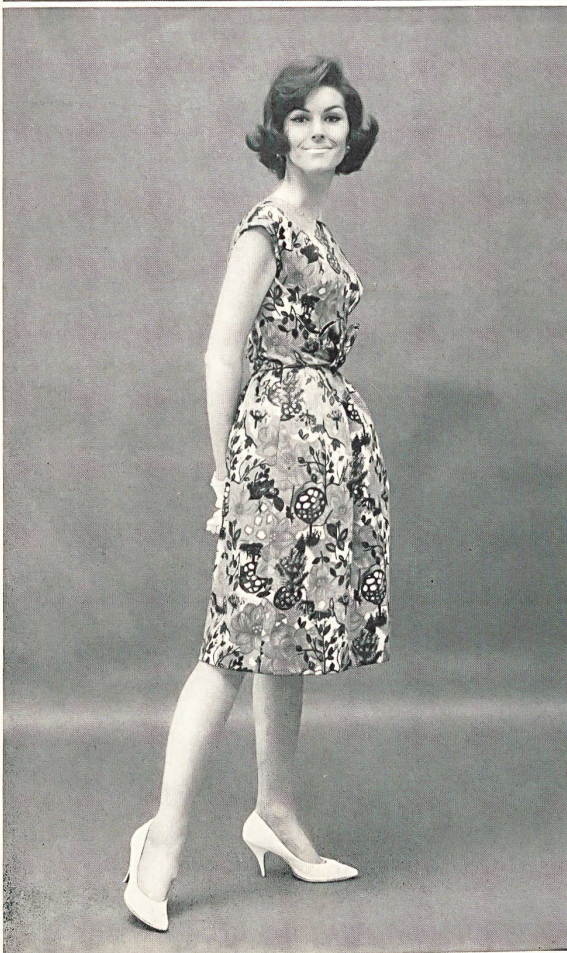
4 « Nelo », J.G. NEF & CO. S. A., HERISAU Ottoman de coton Cotton ottoman Modèle de Mollie Parnis, Parnis-Livingston Inc., New York