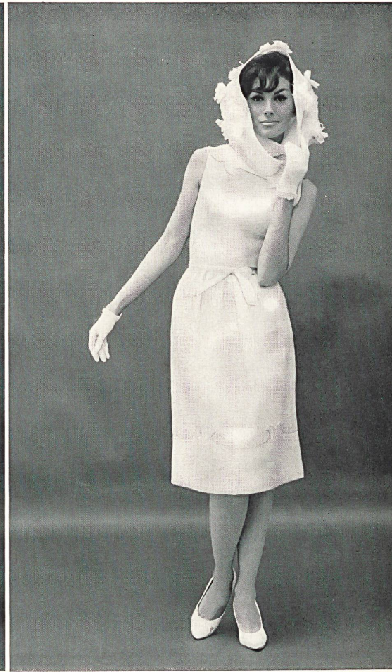
2 STOFFEL S. A., SAINT-GALL Organdi de coton blanc White cotton organdie Modèle de Bill Blass pour Maurice Rentner, Ltd., New York