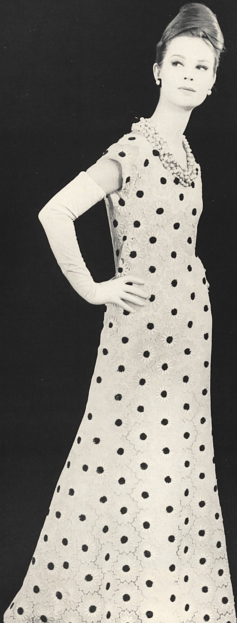
YVES SAINT-LAURENT Guipure de couleur avec motifs de guipure de couleur appliqués de Union S. A., Saint-Gal