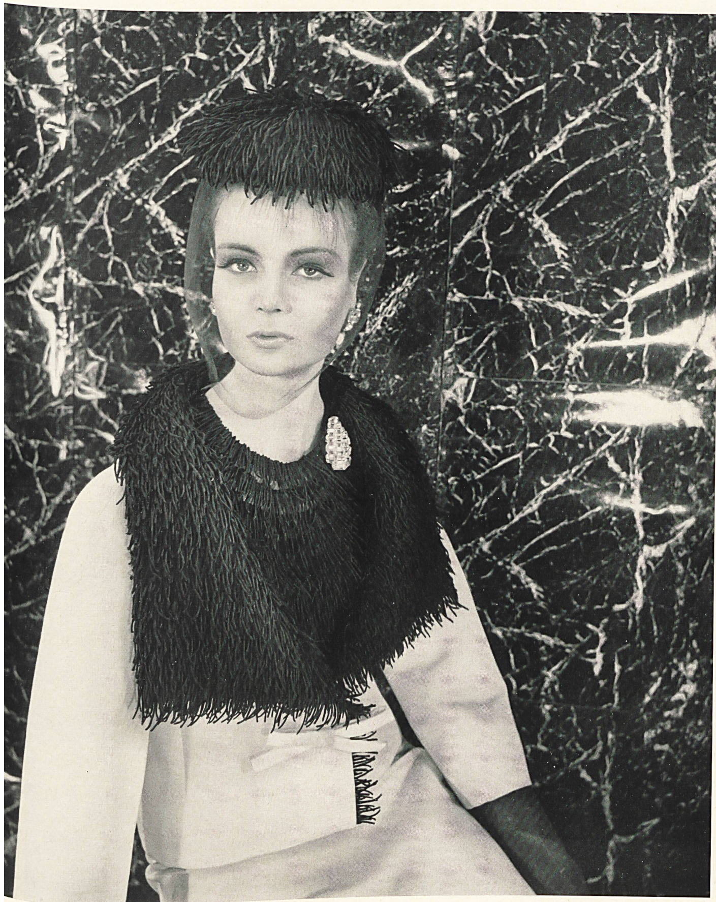
CHRISTIAN DIOR Franges de guipure de A. Naef & Cie S. A., Flawil/Saint-Gall