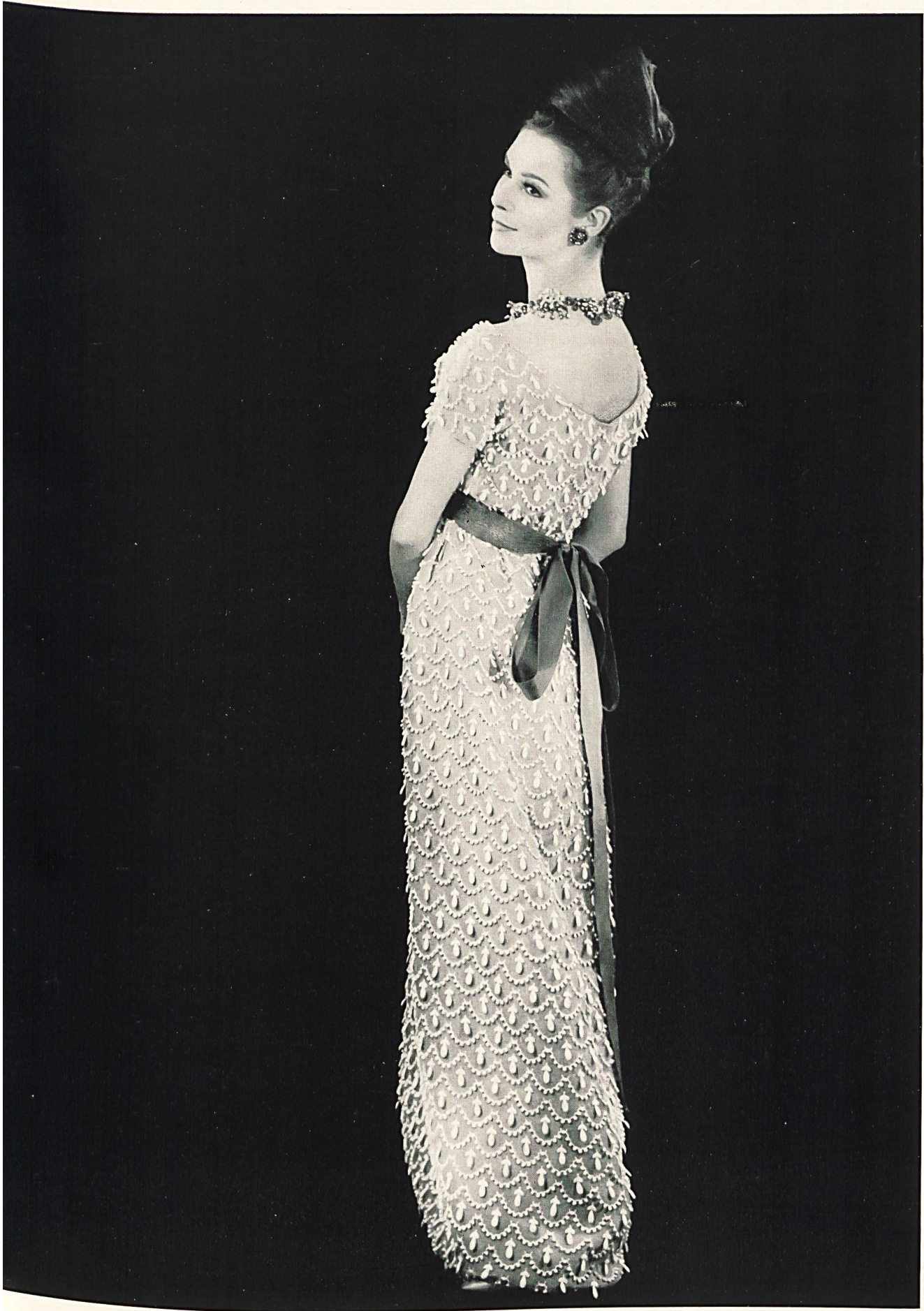
YVES SAINT-LAURENT Volant d'organdi avec guipure superposée de Forster Willi & Co., Saint-Gall