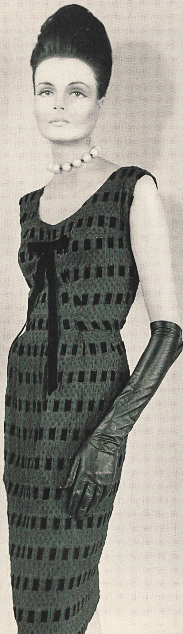
CARVEN Broderie « Nelo » sur pongé « Camilla » de J. G. Nef & Cie S.A., Herisau Grossiste à Paris : Robert Burg & Cie