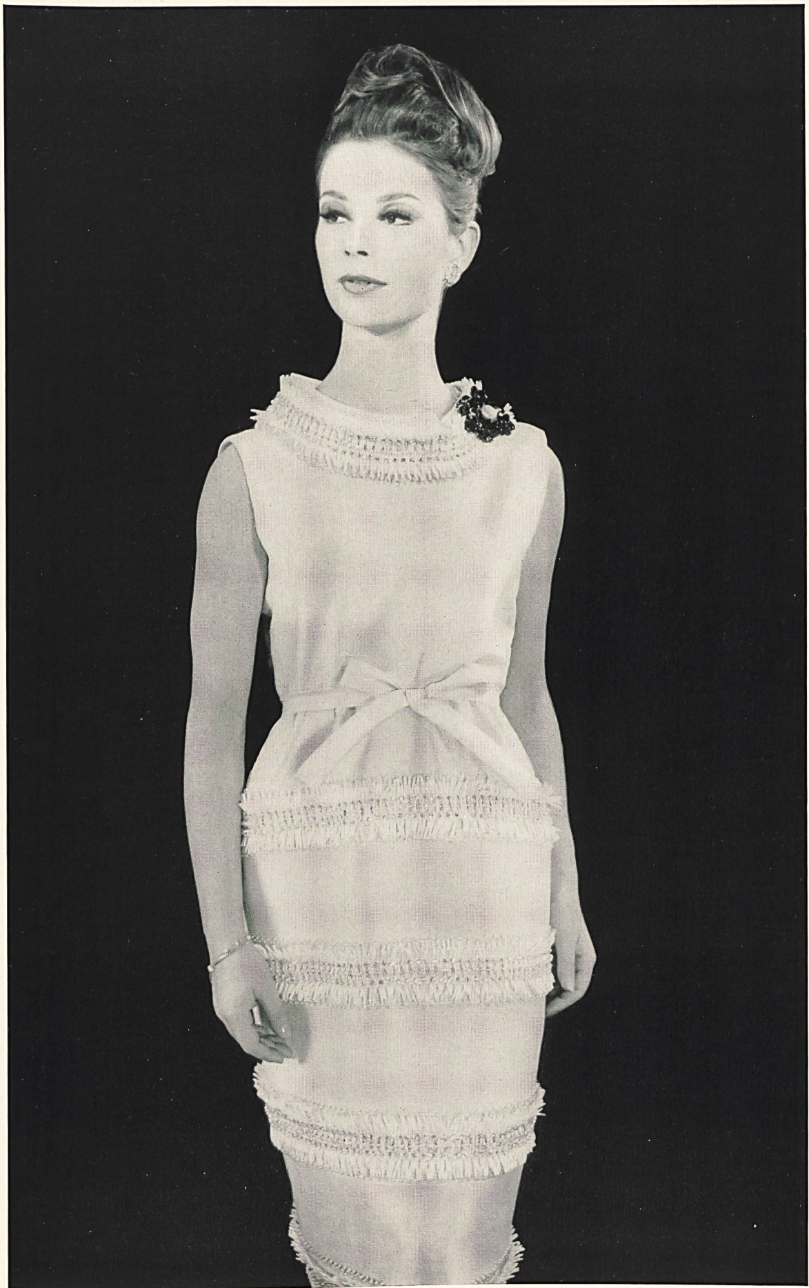
YVES SAINT-LAURENT Franges de broderie chimique de Rau S. A., Saint-Gall