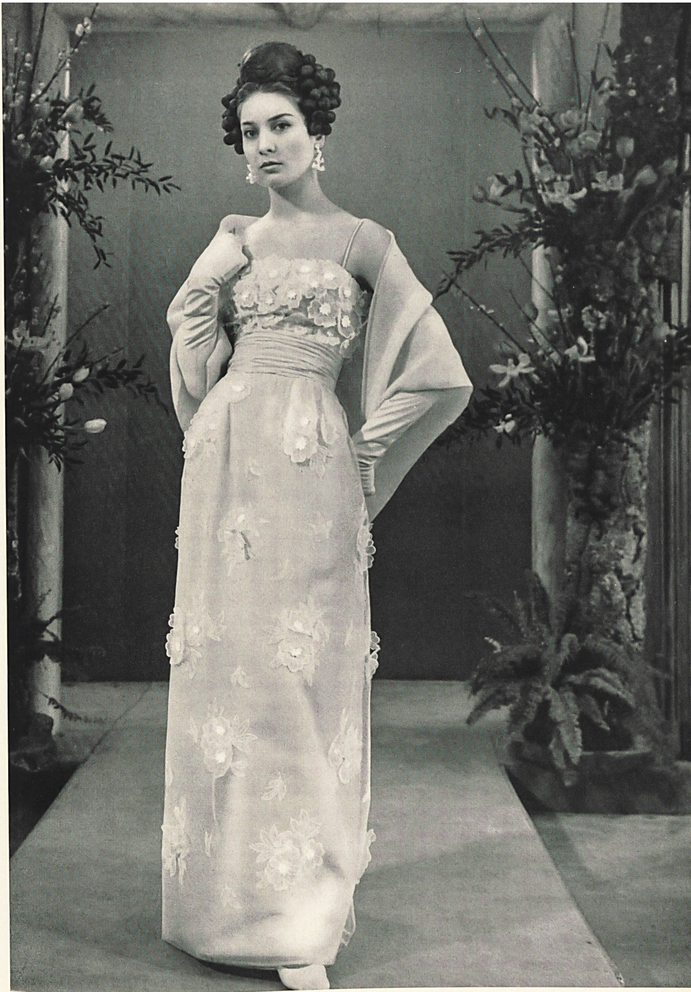
JACQUES HEIM Broderie appliquée sur tulle de A. Naef & Cie S.A., Flawil/Saint-Gall Grossiste à Paris : Les Tisseurs B de M