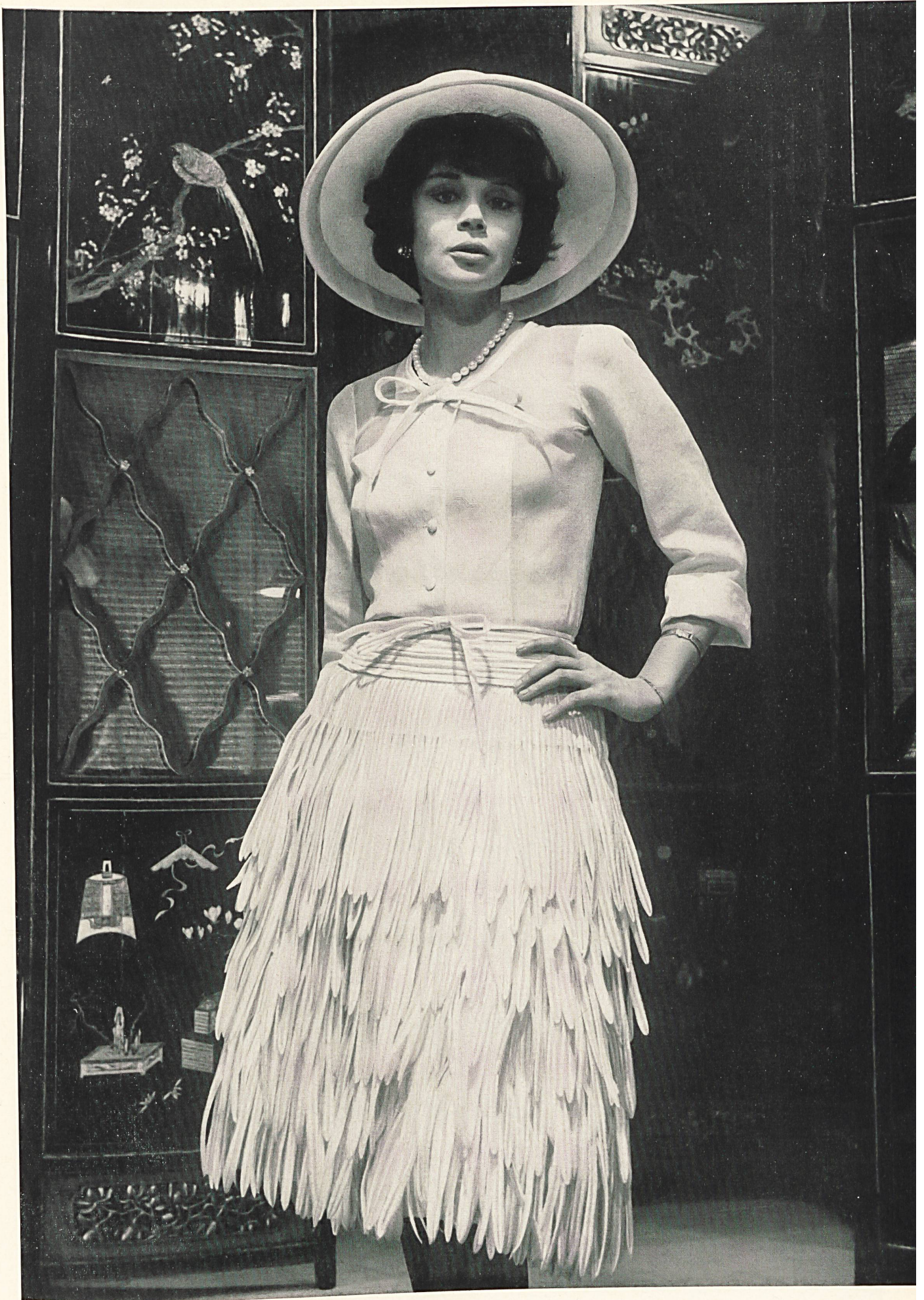
CHANEL Franges brodées de Forster Willi & Co., Saint-Gall Grossiste à Paris : Les Tisseurs B de M