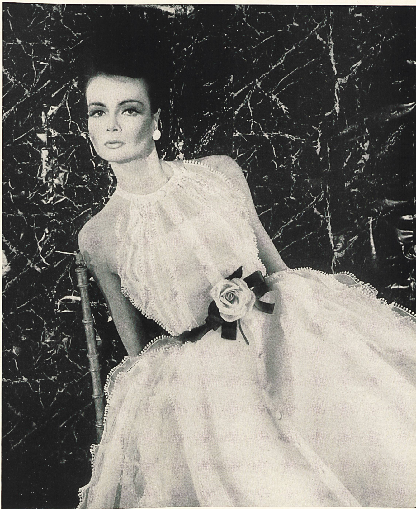
CHRISTIAN DIOR Galons de guipure et broderies sur organdi blanc de Union S. A., Saint-Gall