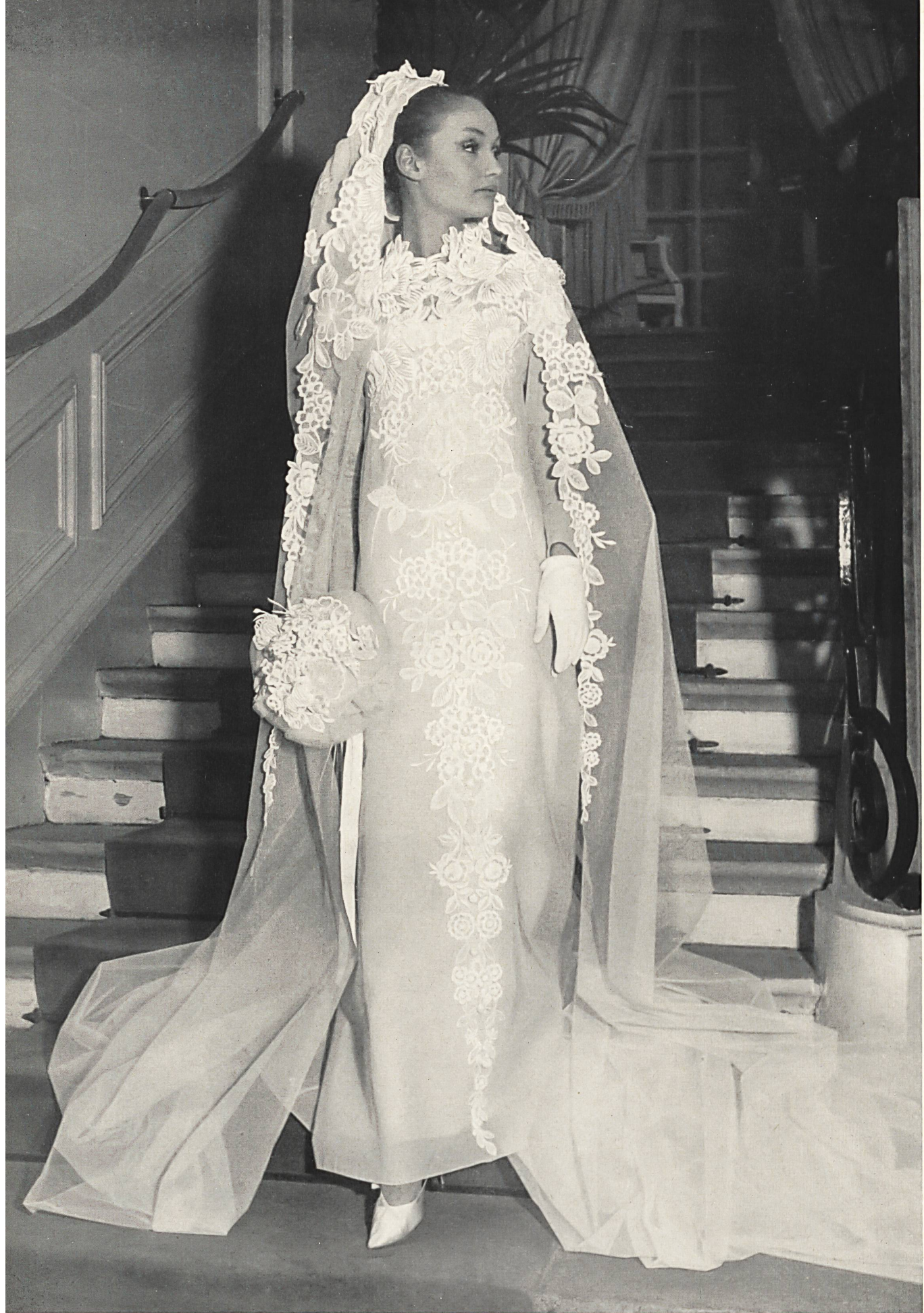
CHRISTIAN DIOR Tulle brodé avec fleurs détachées de A. Naef & Cie S.A., Flawil/Saint-Gall