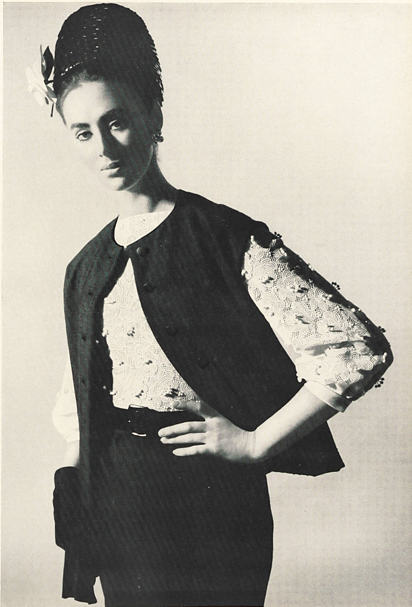
◀ YVES SAINT-LAURENT Organdi découpé avec guipure de Forster Willi & Co., Saint-Gall