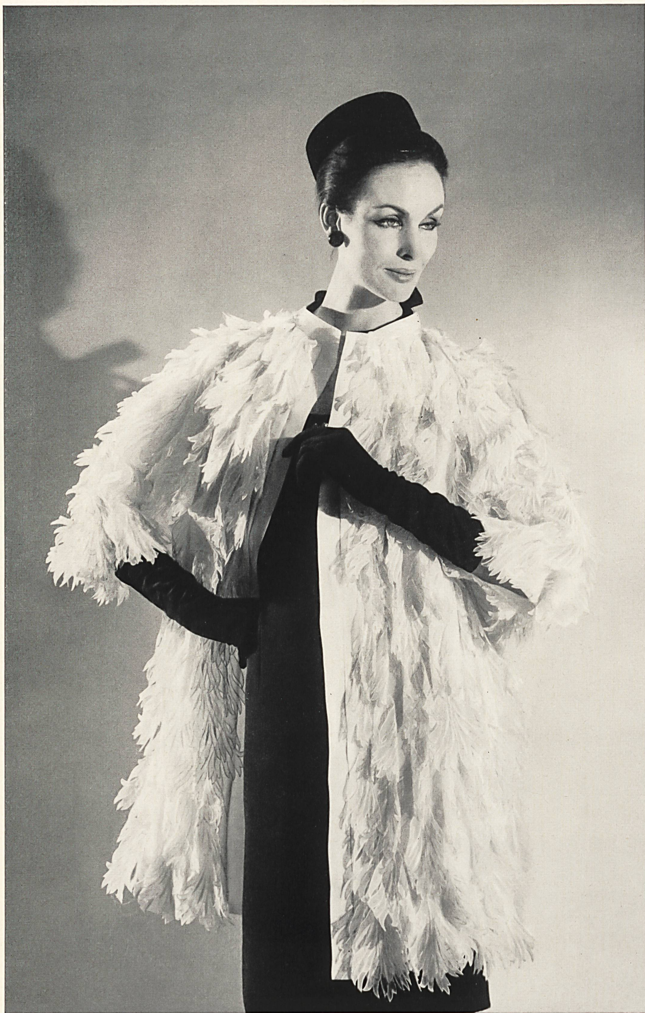
CHRISTIAN DIOR Bordure superposée en organdi de Forster Willi & Co., Saint-Gall