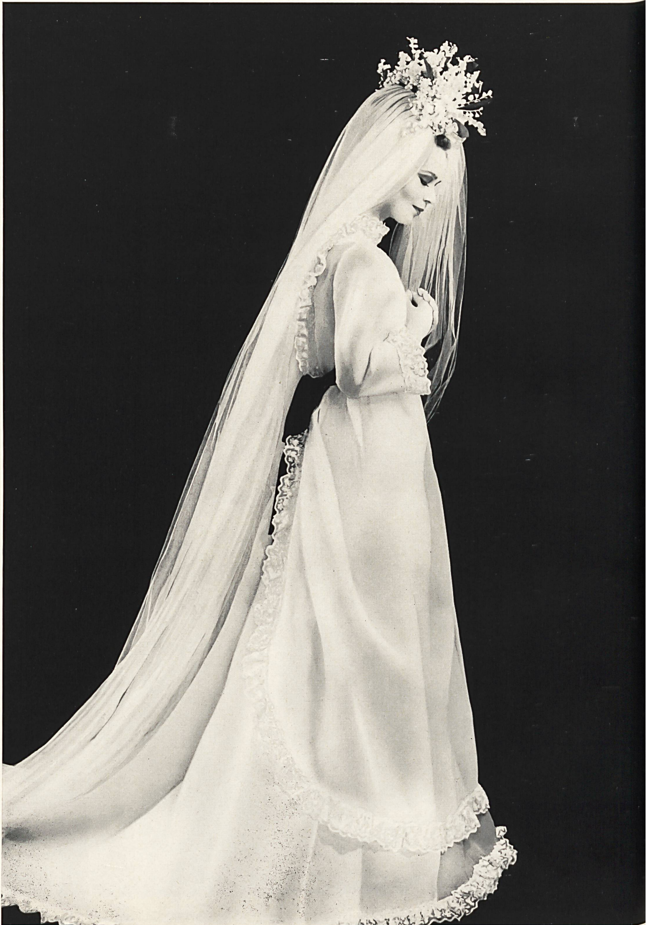
YVES SAINT-LAURENT Galons de broderie blanche et motifs superposés de Union S. A., Saint-Gall