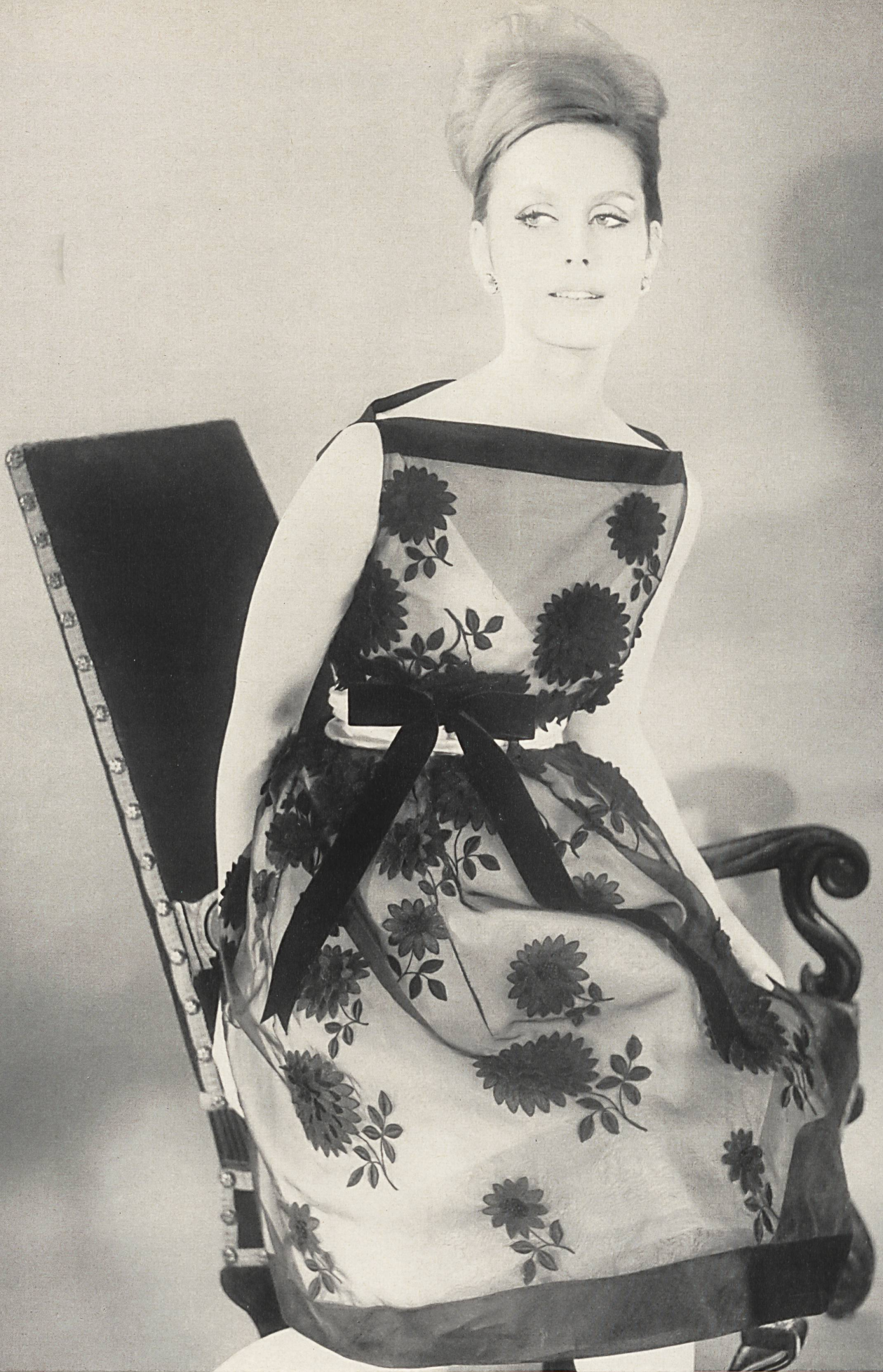
PIERRE BALMAIN Organdi de soie brodé avec fleurs superposées de A. Naef & Cie S. A., Flawil/Saint-Gall Grossiste à Paris : Robert Burg & Cie