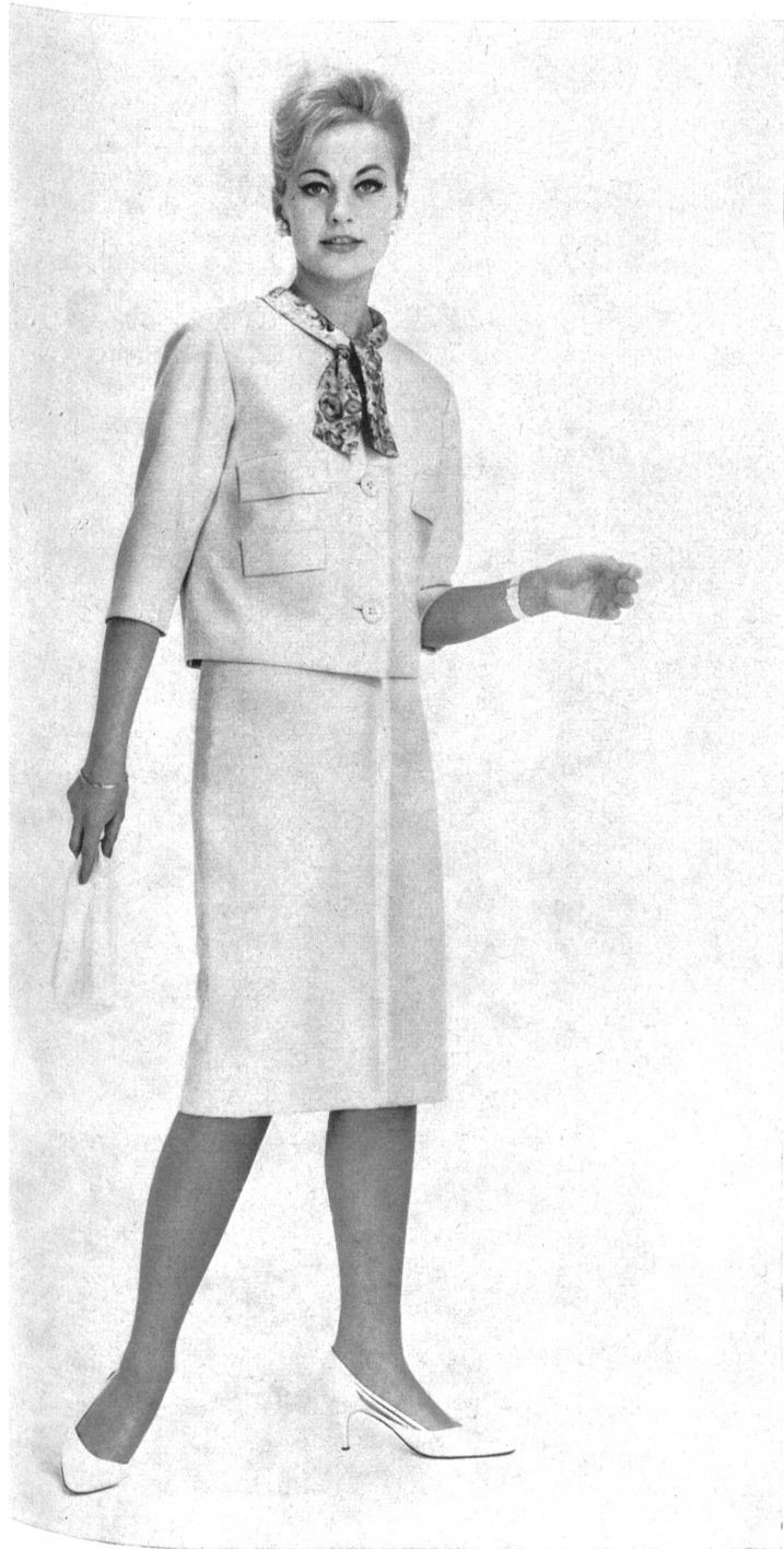
« ZURRER », WEISBROD-ZÜRRER SÖHNE, HAUSEN a. A. Tissu/Gewebe « Canton Lascara » Modèle Honico A/S, Kopenhague