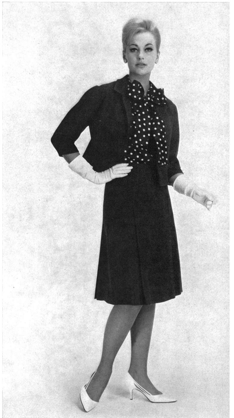
« ZURRER », WEISBROD-ZÜRRER SÖHNE, HAUSEN a. A. Tissu / Gewebe « Canton Lascara » Modèle Honico A/S, Kopenhague