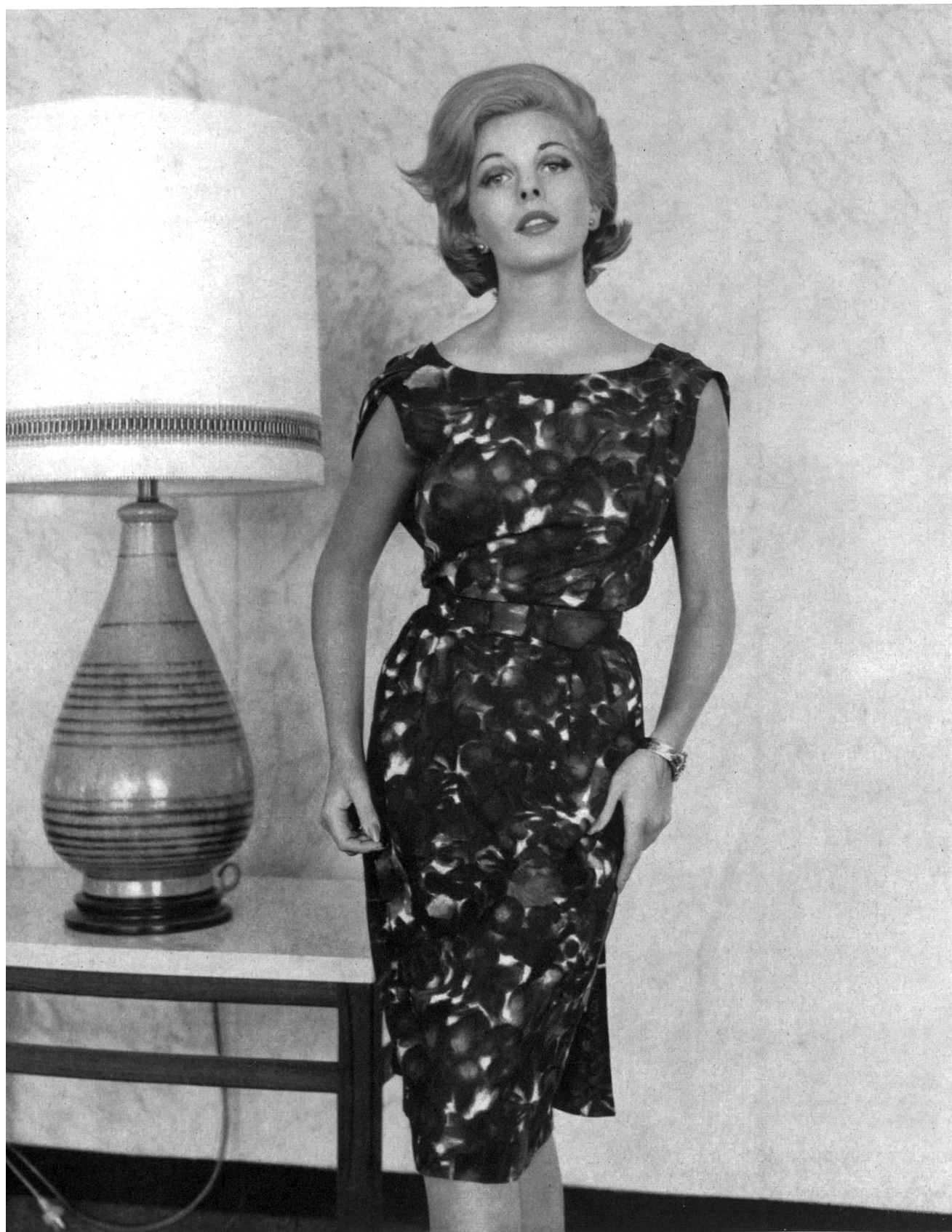
BÉGÉ S. A., ZURICH Tissu / Fabric « bégé-Atlantic » Modèle Sharene, Melbourne