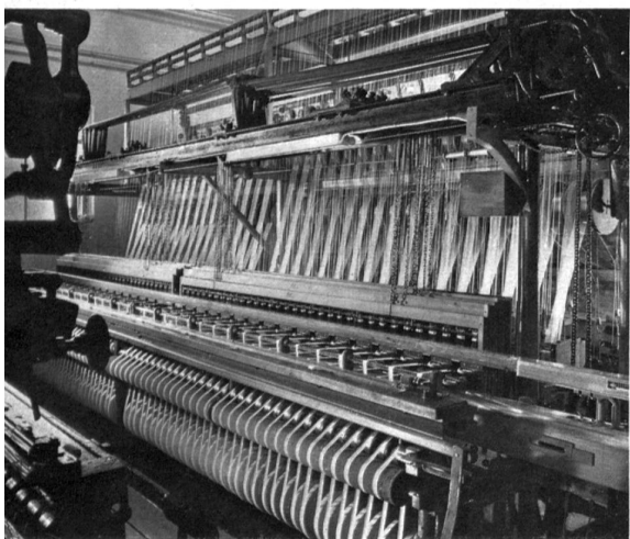
Telar típico para cintas

En la noche del 13 de diciembre de 1960, un violento incendio destruyó la fábrica de cintas de Breitenbach. El daño causado fue considerable. Aunque las naves de telares fueron salvadas, toda la sección de urdiduría quedó destruída y las existencias de primeras materias en almacén así como las de productos terminados fueron presa de las llamas.