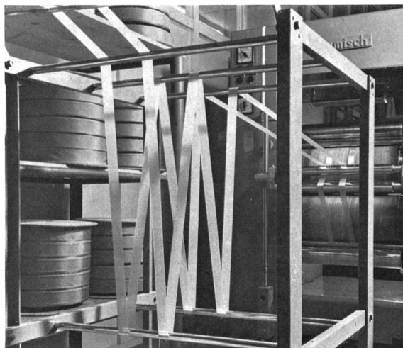
Tinte y apresto: vista parcial