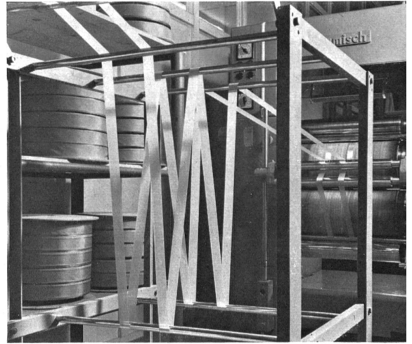
Tinte y apresto: vista parcial