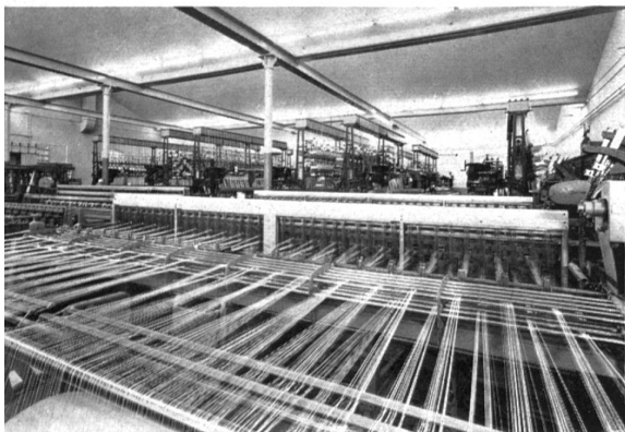
Vista parcial de la tejeduría