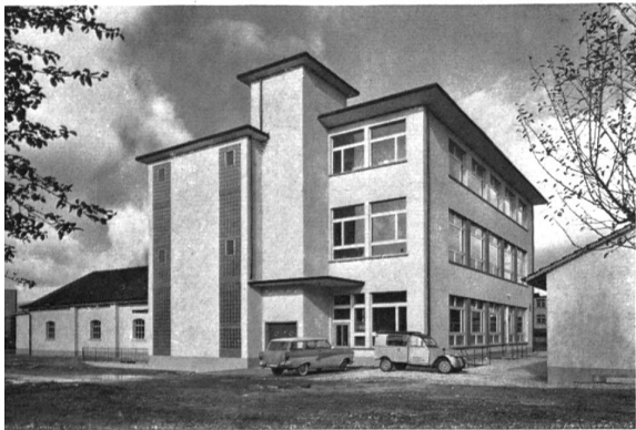
Vista parcial de la fábrica