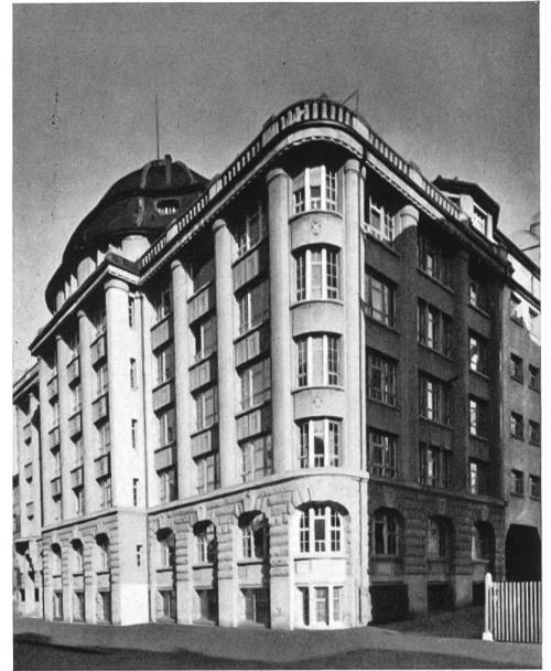
El Laboratorio Federal para el Ensayo de Materiales e Instituto de Investigaciones, Departamento C, en San Galo

El Laboratorio de Ensayos de San Galo desempeña un papel principal en la esfera de la técnica y de la economía al encargarse de la verificación de los materiales y la investigación científica en estrecha colaboración con la industria interesada. Durante los años de marasmo y de crisis, también durante los años de guerra,