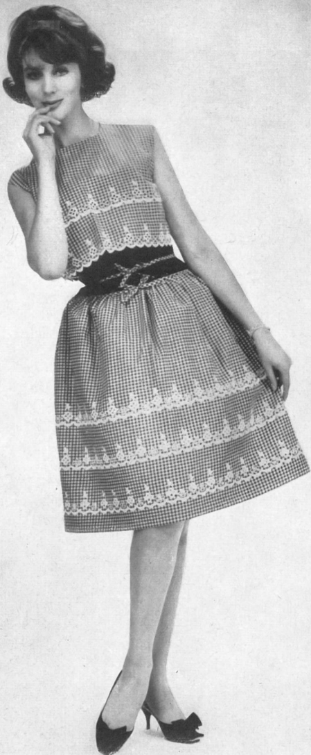
1 JACOB SCHLÄPFER & CO., SAINT-GALL Broderie sur batiste tissée en couleurs, genre Vichy. Modèle Sabrina, Nice.