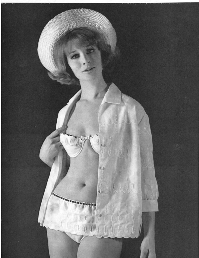
« RECO », REICHENBACH & CO., SAINT-GALL Batiste Minicare brodée. Modèle Alphée, Alassio (Italie).