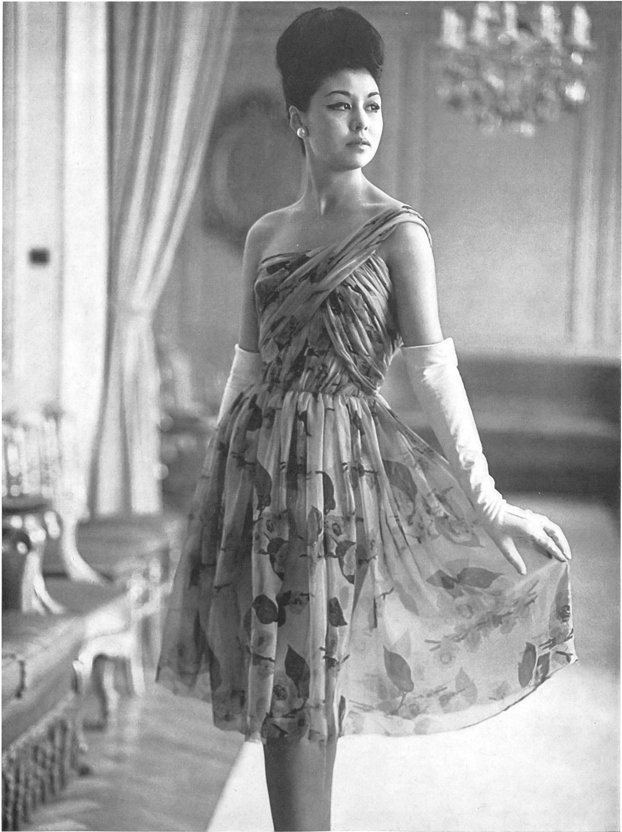
RUDOLF BRAUCHBAR & CIE S. A., ZURICH Mousseline de soie imprimée. Muselina de seda estampada. Modèle El Dique Flotante, Barcelone.