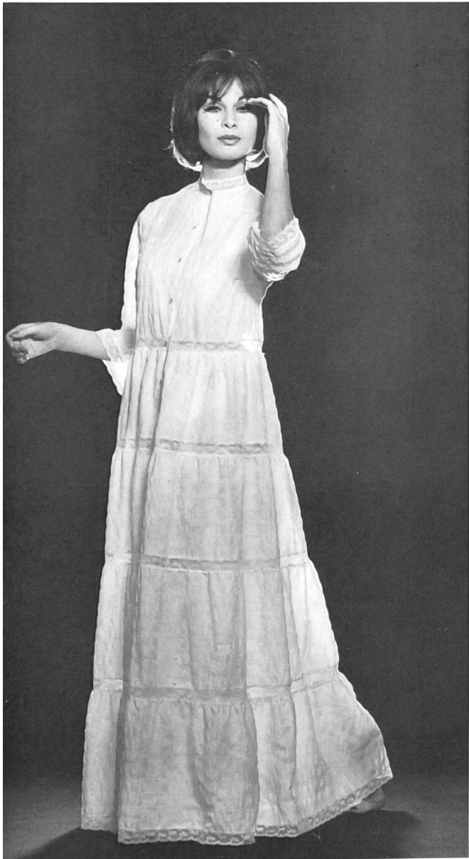
METTLER & CIE S. A., SAINT-GALL Violine gaufrée. Modèle Andréa Grenier, Paris.