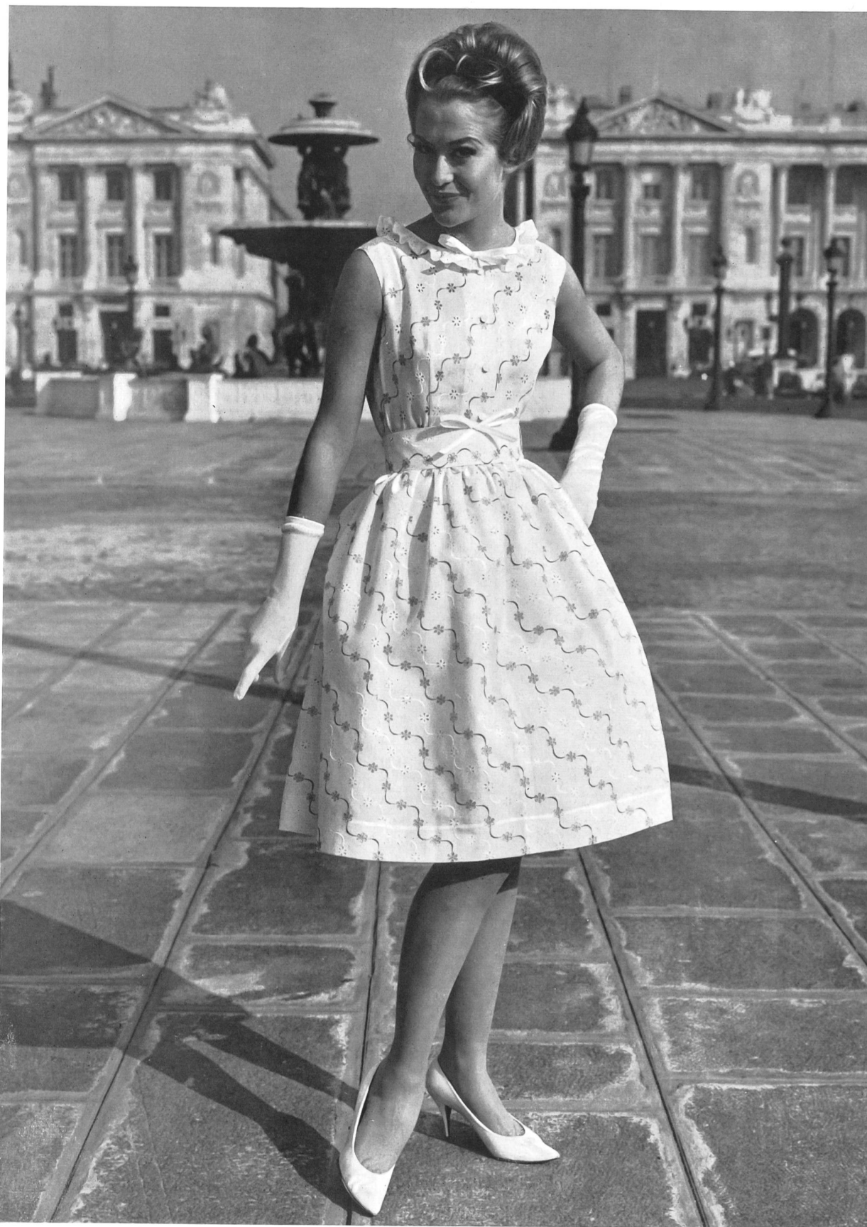
« RECO », REICHENBACH & CO., SAINT-GALL Broderie de couleur sur batiste Minicare blanche. Modèle Lempereur, Paris.