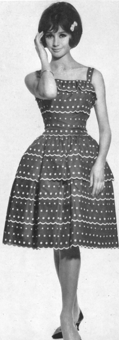
3 Broderie sur batiste tissée en couleurs, genre Vichy. Modèle Pierbe S. A., Lyon.