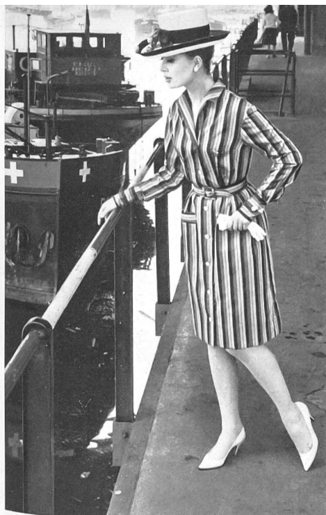
Coton tissé en couleurs. Colour-woven cotton fabric. Algodón tejido en colores. Buntgewebte Baumwolle. Modèle Kurt A.-G., Lucerne.