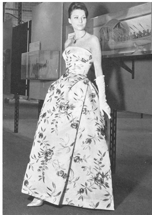
Tissu flammé, brodé. Embroidered flammé fabric. Tejido flameado, bordado. Besticktes flammé Gewebe. Modèle R. Cafader & Co., Zurich.

suiza, merecería por sí misma un artículo. Tan sólo diremos ahora que, durante una visita demasiado breve acompañada de una colación, hemos visto numerosos mapas y esquemas que ilustran la producción, el acondicionamiento y el transporte hasta Suiza de las principales materias primas que requiere la industria de este país, tales como el algodón, el azúcar, el caucho; una historia de la navegación renana ilustrada por numerosos grabados, cuadros, documentos originales, etc., una maqueta del puerto de Basilea y de sus instalaciones actuales que mide aproximadamente 40 m 2 , así como una interesantísima exposición de modelos de barcos antiguos y modernos.