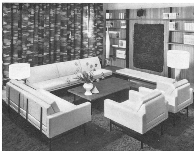
Un beau rideau en tissu de coton imprimé suisse, exposé chez Idealheim S. A., Bâle. An attractive curtain in a Swiss cotton print, on display at Idealheim Ltd., Basle. Una hermosa cortina suiza de género de algodón estampado expuesta en la tienda de Idealheim S. A., Basilea. Ein schöner Vorhang aus bedruckter Baumwolle ausgestellt in der Idealheim A.-G., Basel.

Ya es sabido que, independientemente de la boga siempre renovada del bordado suizo, los continuos esfuerzos de los productores para hacer del algodón un tejido noble, tan agradable de usar como elegante, han desarrollado considerablemente la importancia económica de este ramo. En 1961, la exportación suiza de productos de algodón llegó a los 379 millones de francos suizos ($ USA = 88,6 millones) de los cuales un poco más de la tercera parte consistía en bordados. Durante el mismo año, Suiza ha exportado más de 4800 toneladas de hilos y torzales de algodón, mitad y mitad de cada clase, y 7474 toneladas de bordados y de tejidos de algodón. La hilatura de algodón ocupa en Suiza 1,3 millones de husos y la torceduría otros 350.000, mientras que funcionan