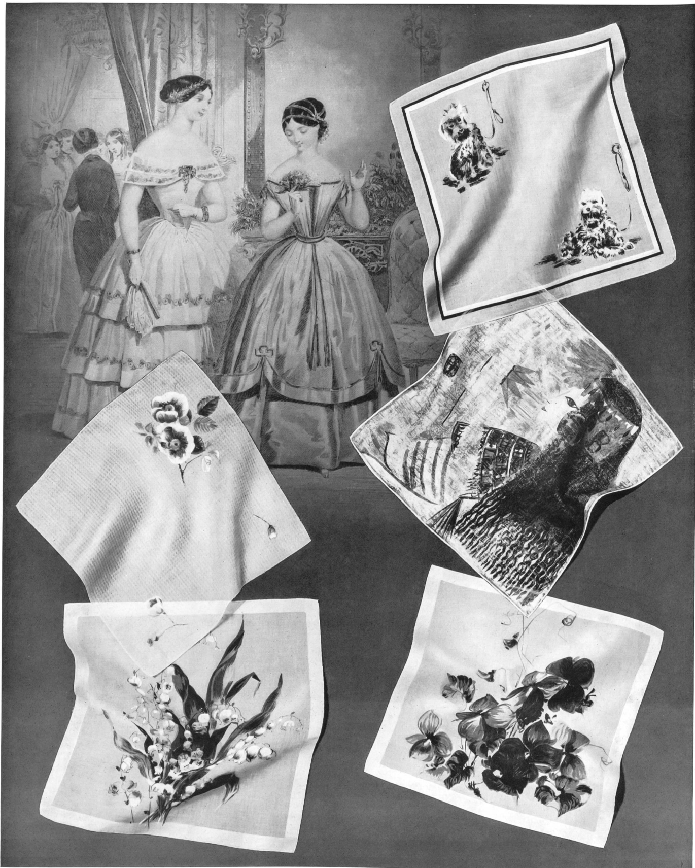
«NELO», J. G. NEF & CO. A.-G., HERISAU Mouchoirs «Nelo» imprimés, classiques et modernes. Printed «Nelo» handkerchiefs in classical and modern styles. Pañuelos «Nelo» estampados, clásicos y modernos. Bedruckte «Nelo»-Tüchli im klassischen und modernen Genre.