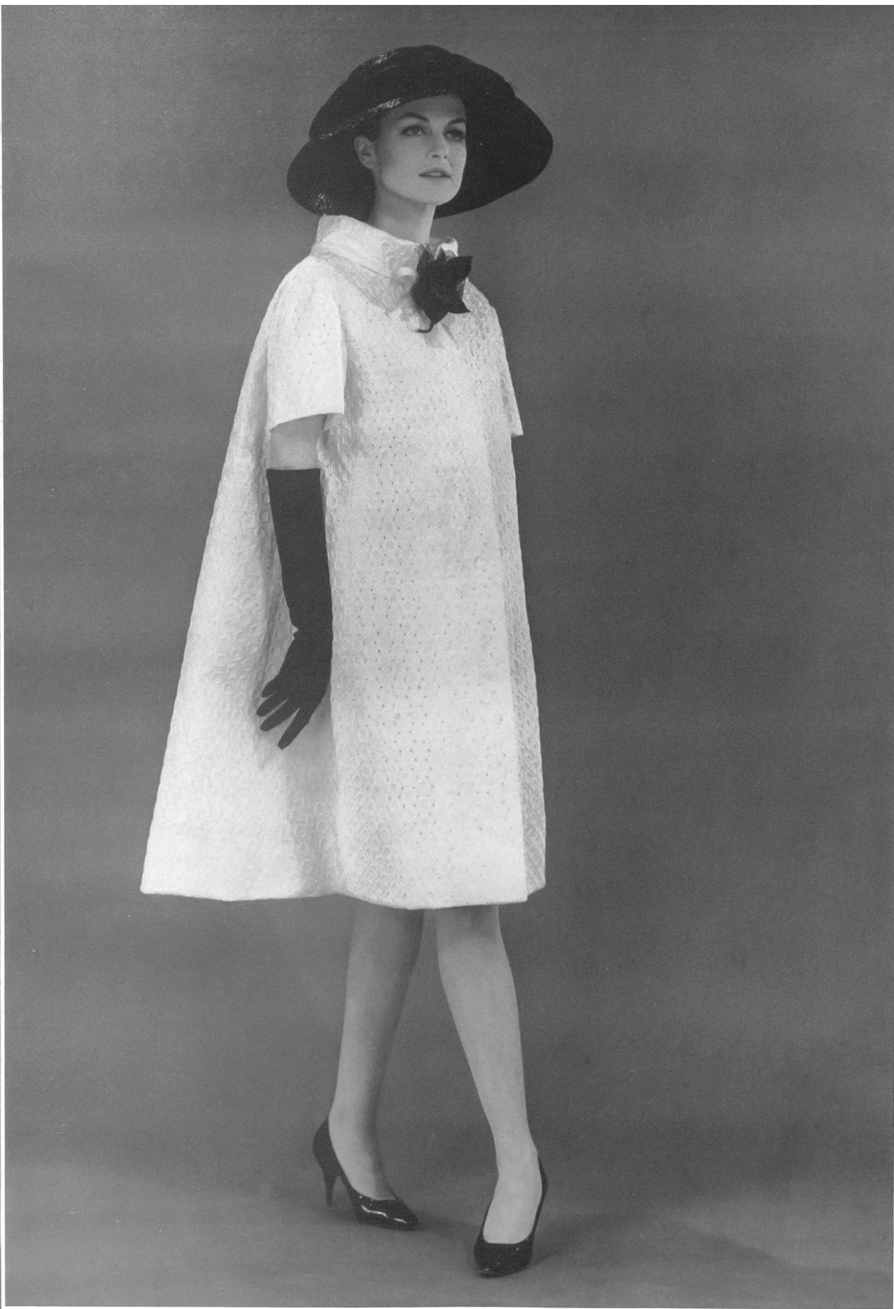
JACQUES HEIM Batiste Minicare blanche brodée de Reichenbach & Co., Saint-Gall