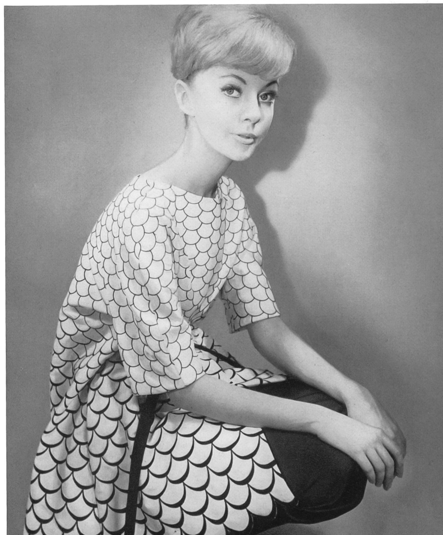
CHRISTIAN DIOR (Boutique) Bordure brodée sur piqué de Forster Willi & Co., Saint-Gall