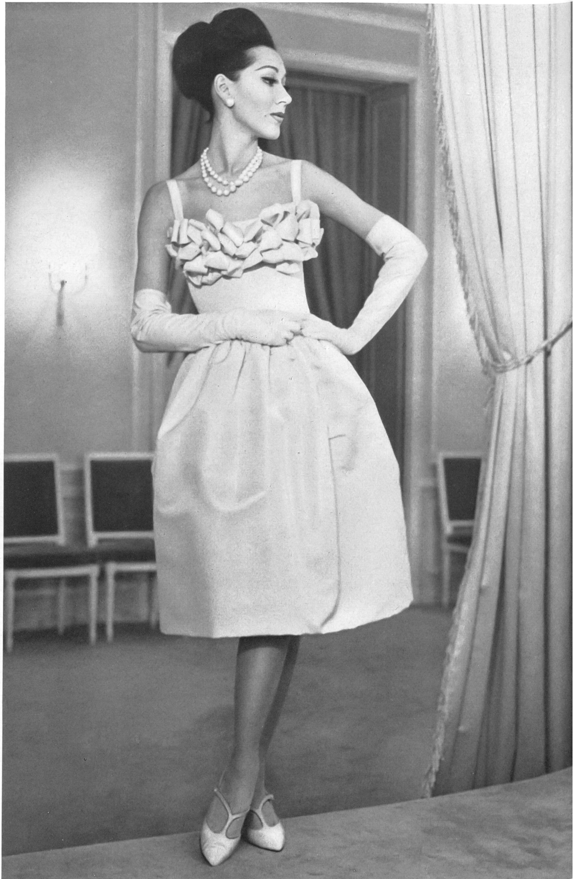
CHRISTIAN DIOR (Boutique) Poult de soie de la S.A. Stünzi Fils, Horgen