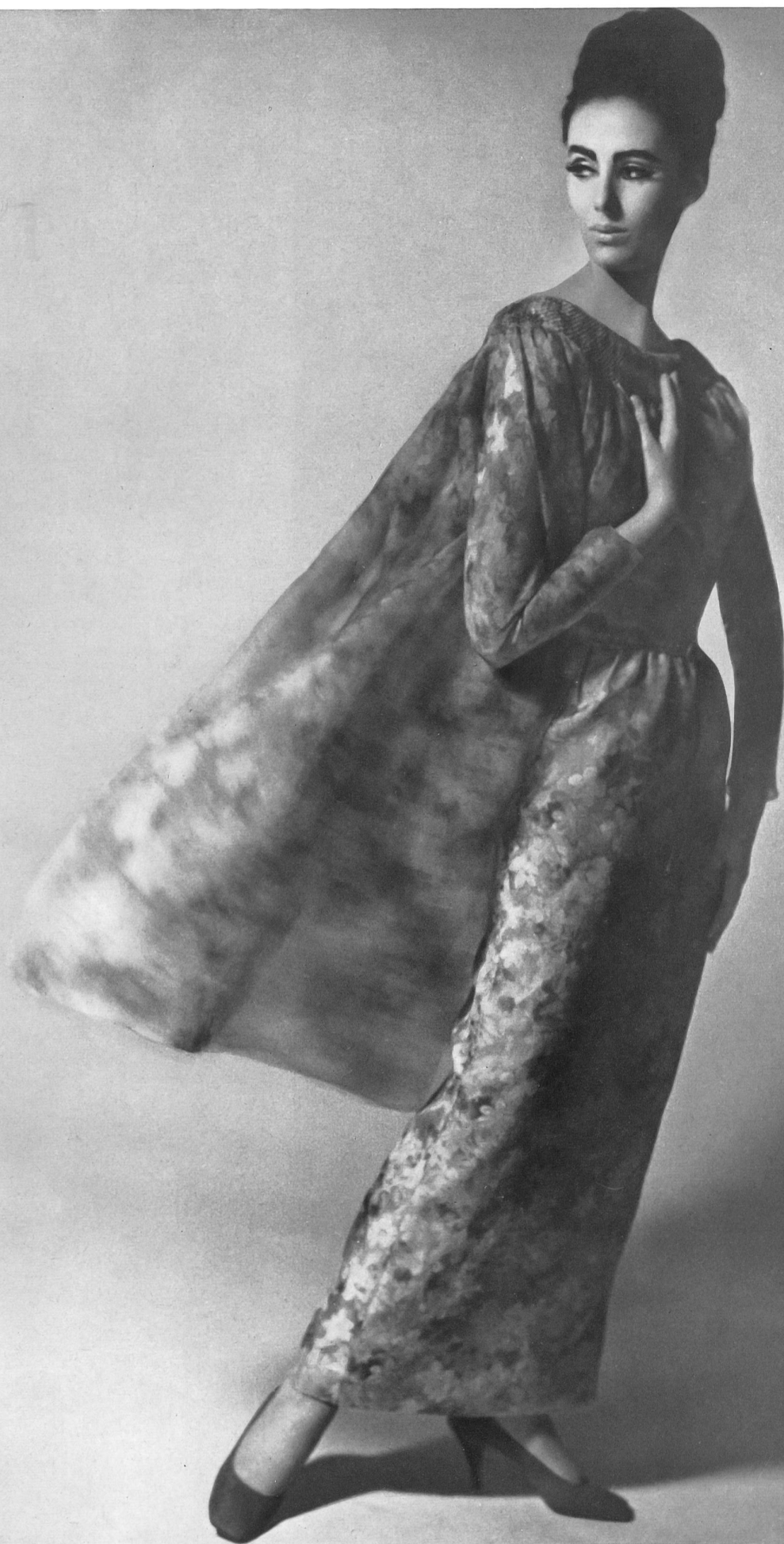
PIERRE CARDIN Robe du soir en «Mousseline Chichi» de L. Abraham & Cie, Soieries S.A., Zurich