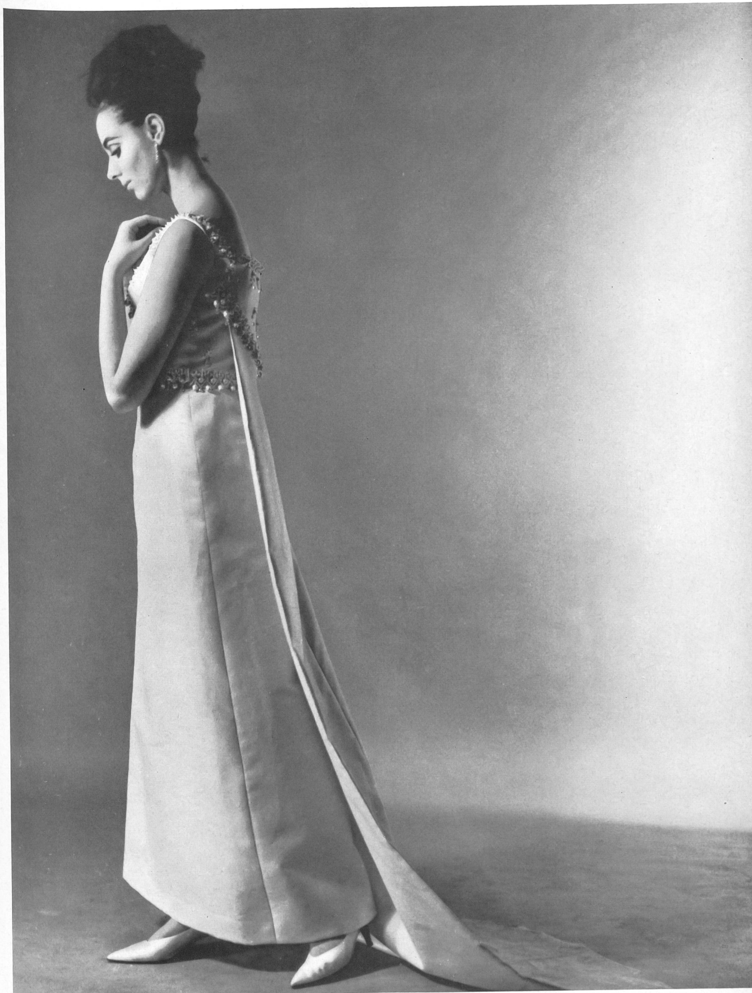
JACQUES HEIM Robe du soir en «Tundra» de L. Abraham & Cie, Soieries S.A., Zurich