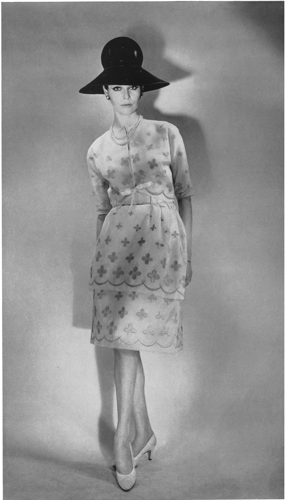
BERNARD SAGARDOY Laize d'organdi de soie brodé couleur de Union S. A., Saint-Gall