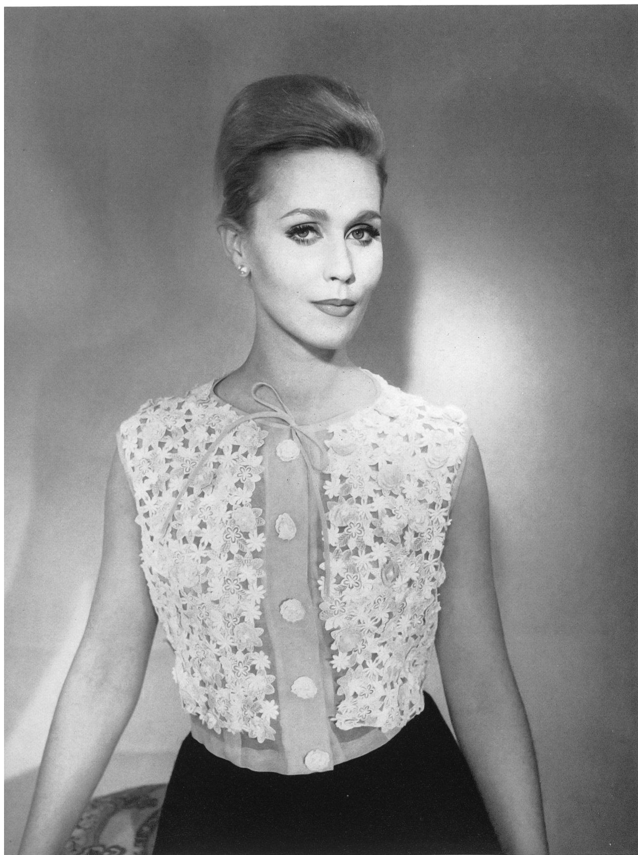
BERNARD SAGARDOY Organdi brodé avec fleurs superposées de A. Naef & Cie S. A., Flawil/Saint-Gall Grossiste à Paris: Robert Burg & Cie