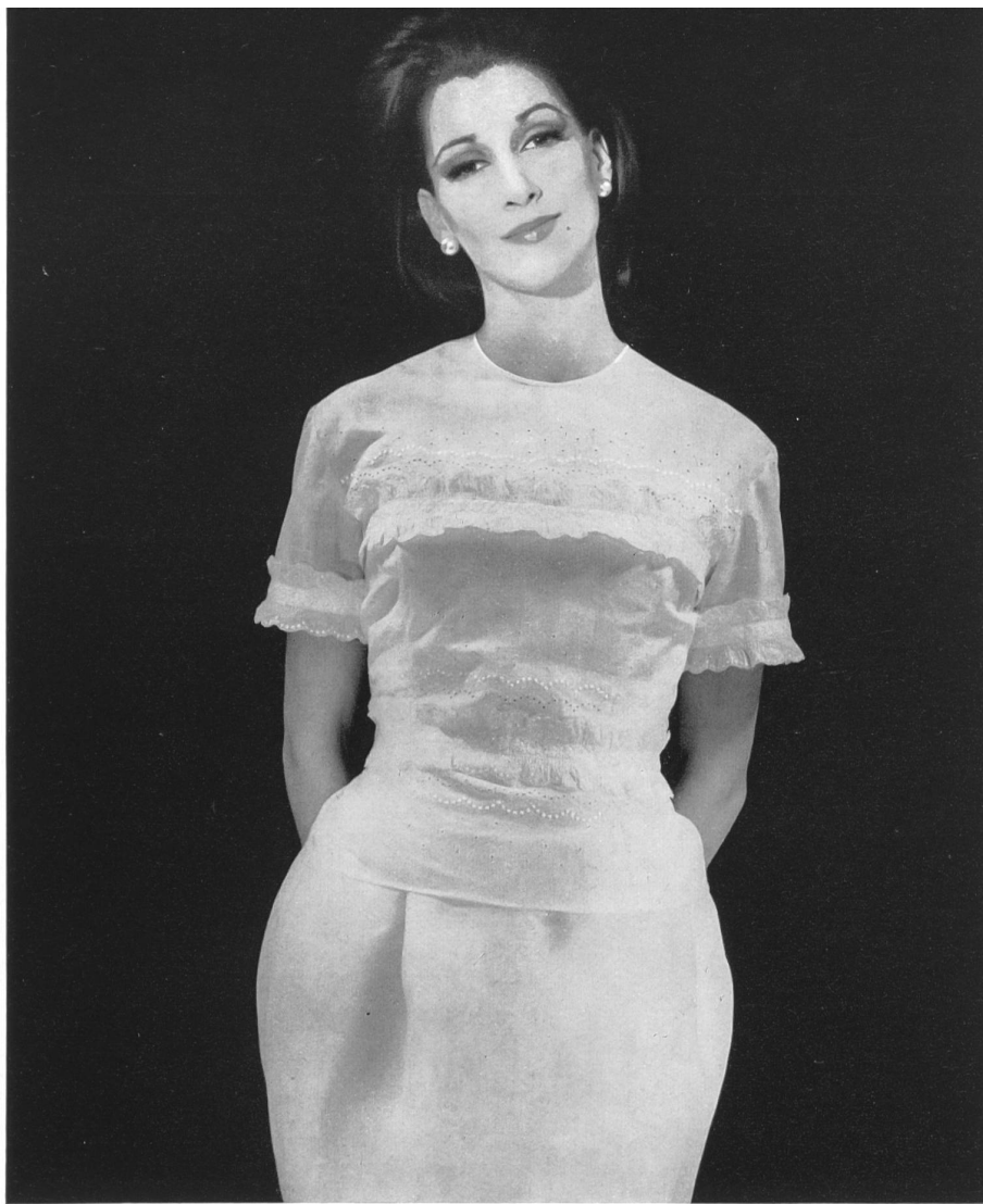
CARVEN « Nelo », broderie coton « Belrosa » Minicare de J. G. Nef & Co. S.A., Hérissau