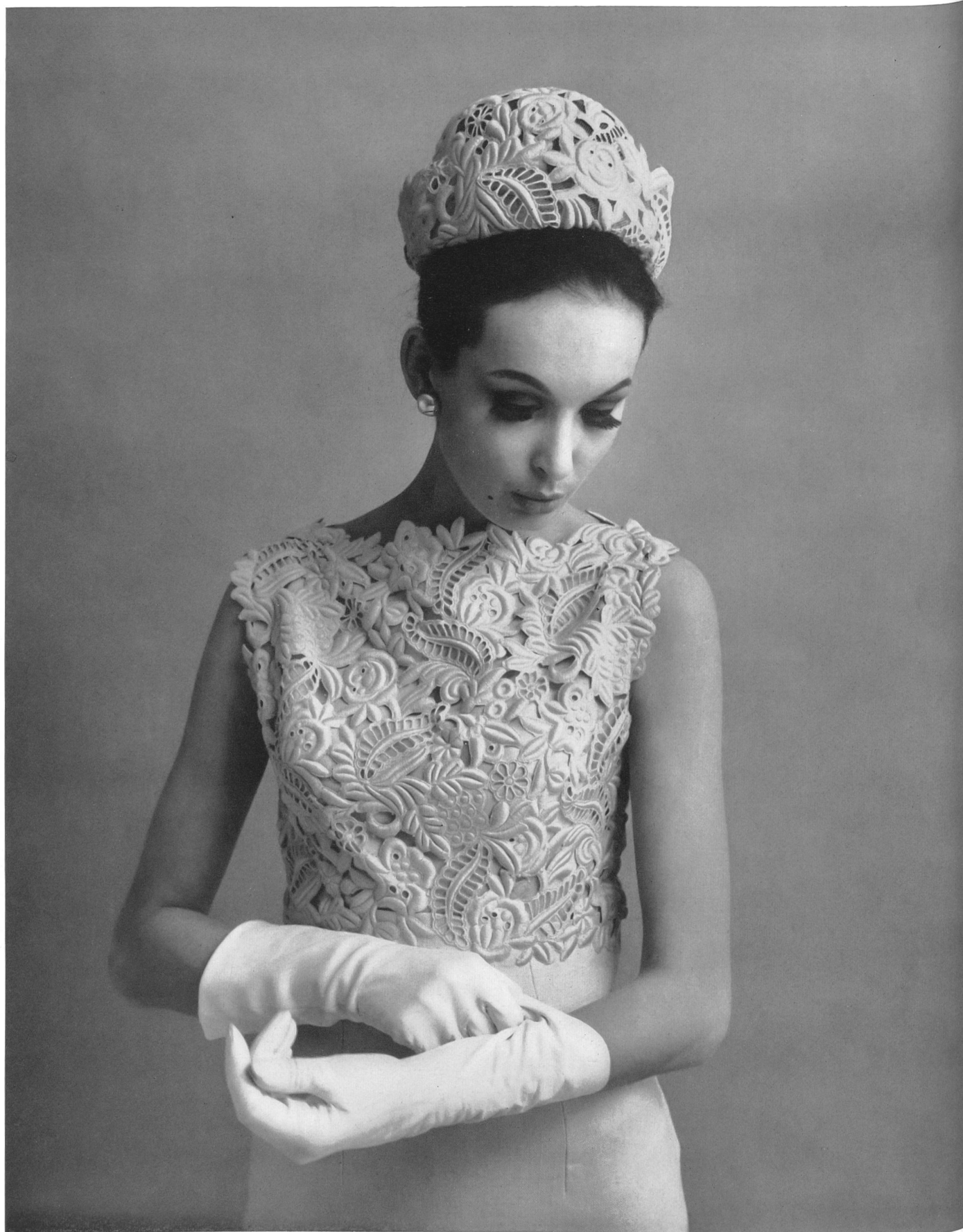
PIERRE BALMAIN Galon découpé de Forster Willi & Co., Saint-Gall