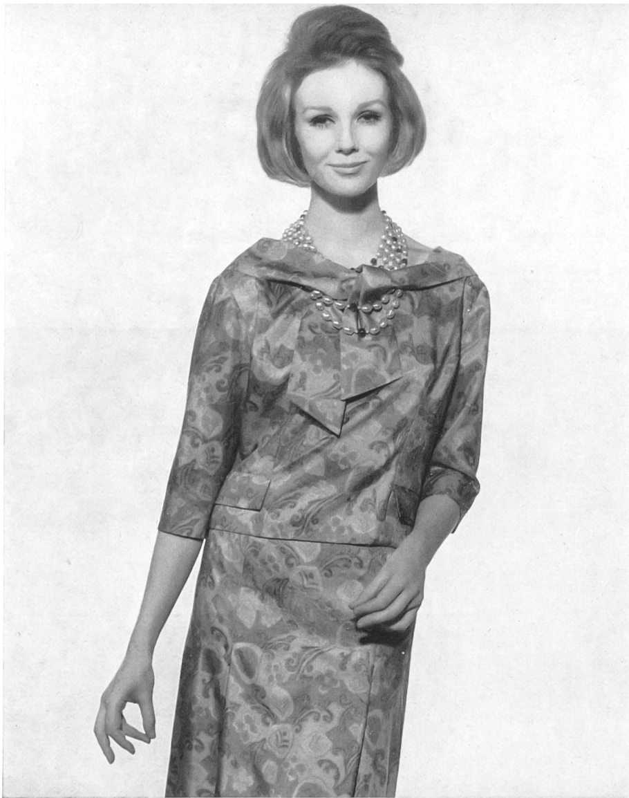
RÉGINE LUTÈCE, PARIS Tissu « bégé-Oki Ama » pure soie de Bégé S.A., Tissus Nouveautés, Zurich Lahondès, grossiste exclusif, Paris