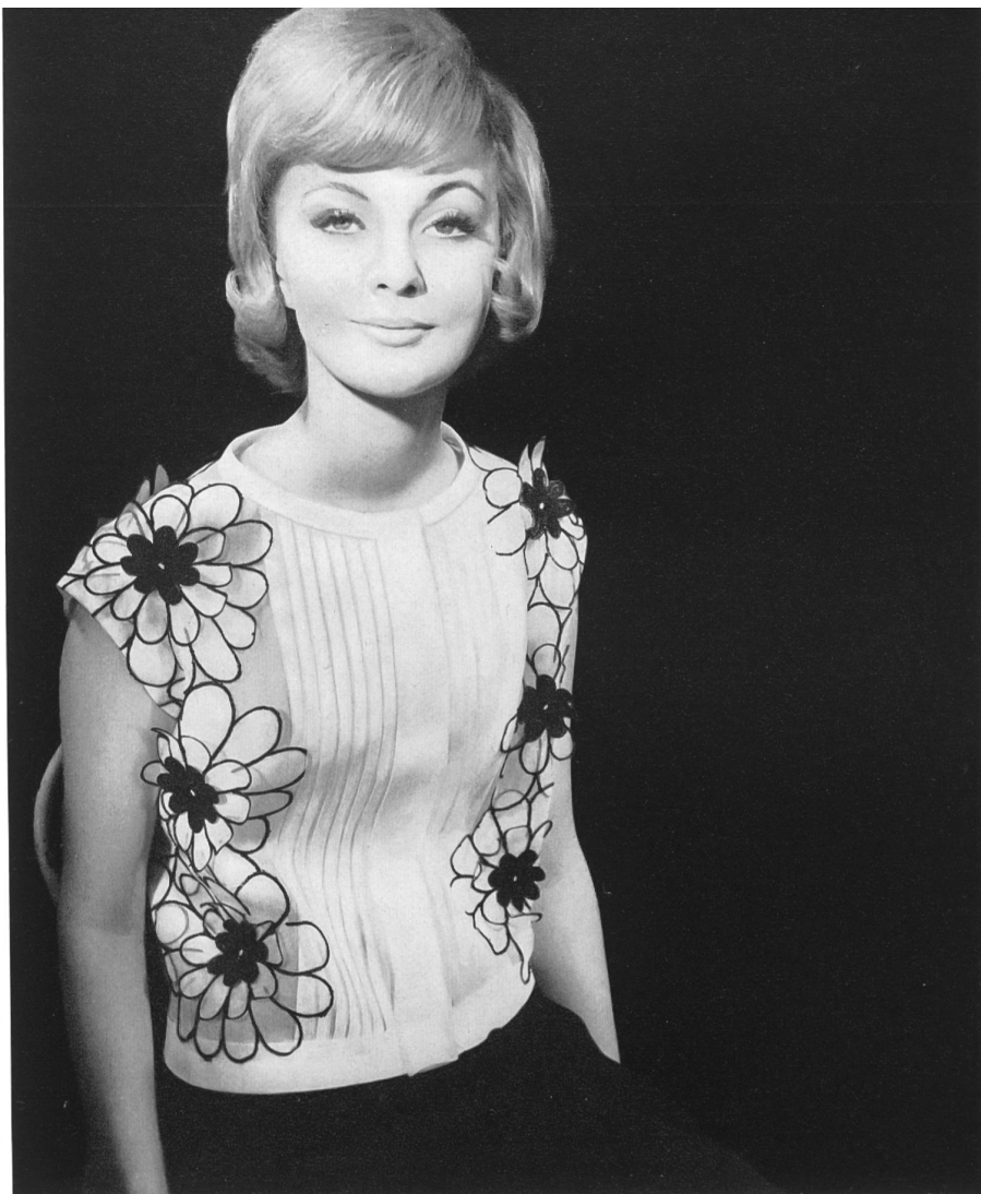
BERNARD SAGARDOY Laize d'organdi avec application de motifs découpés de Union S. A., Saint-Gall