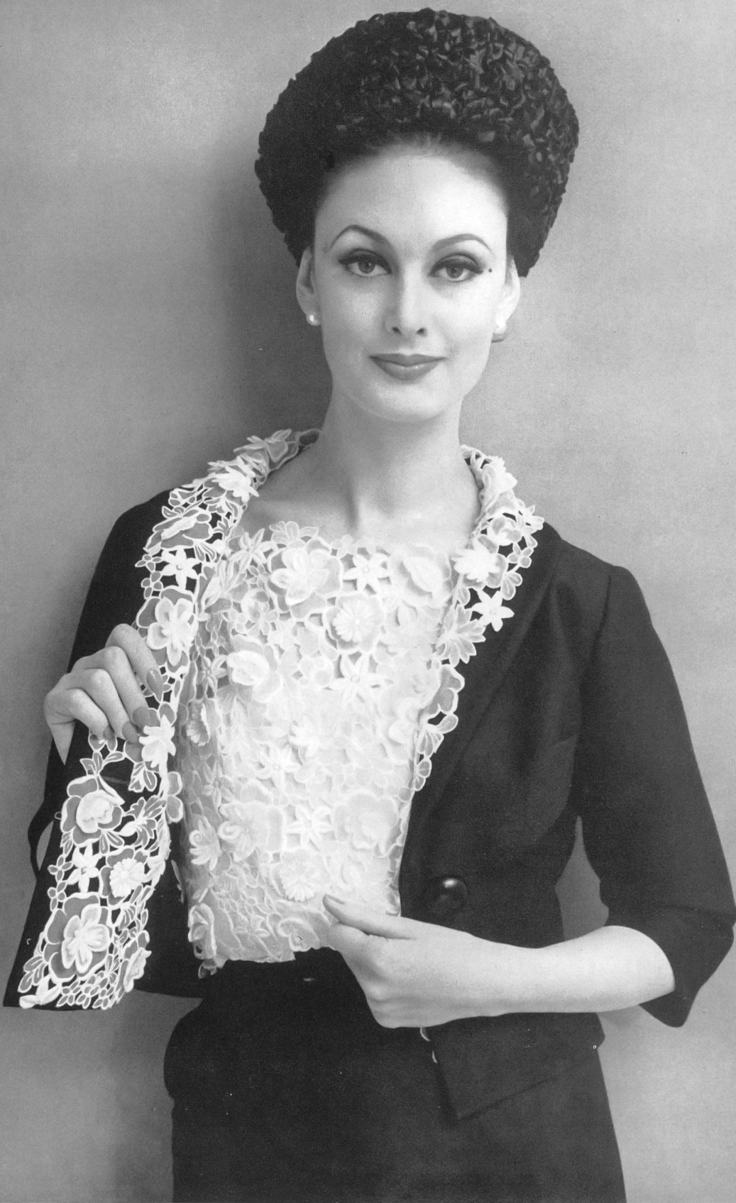
JEAN DESSÈS Galon d'organdi découpé de Forster Willi & Co., Saint-Gall Grossiste à Paris : Pierre Brivet, S.à r.l.