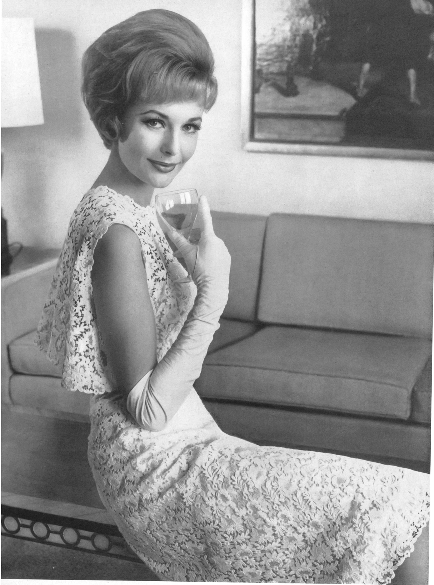
FORSTER WILLI & CO., SAINT-GALL Guipure Modèle Detlev Albers, Berlin