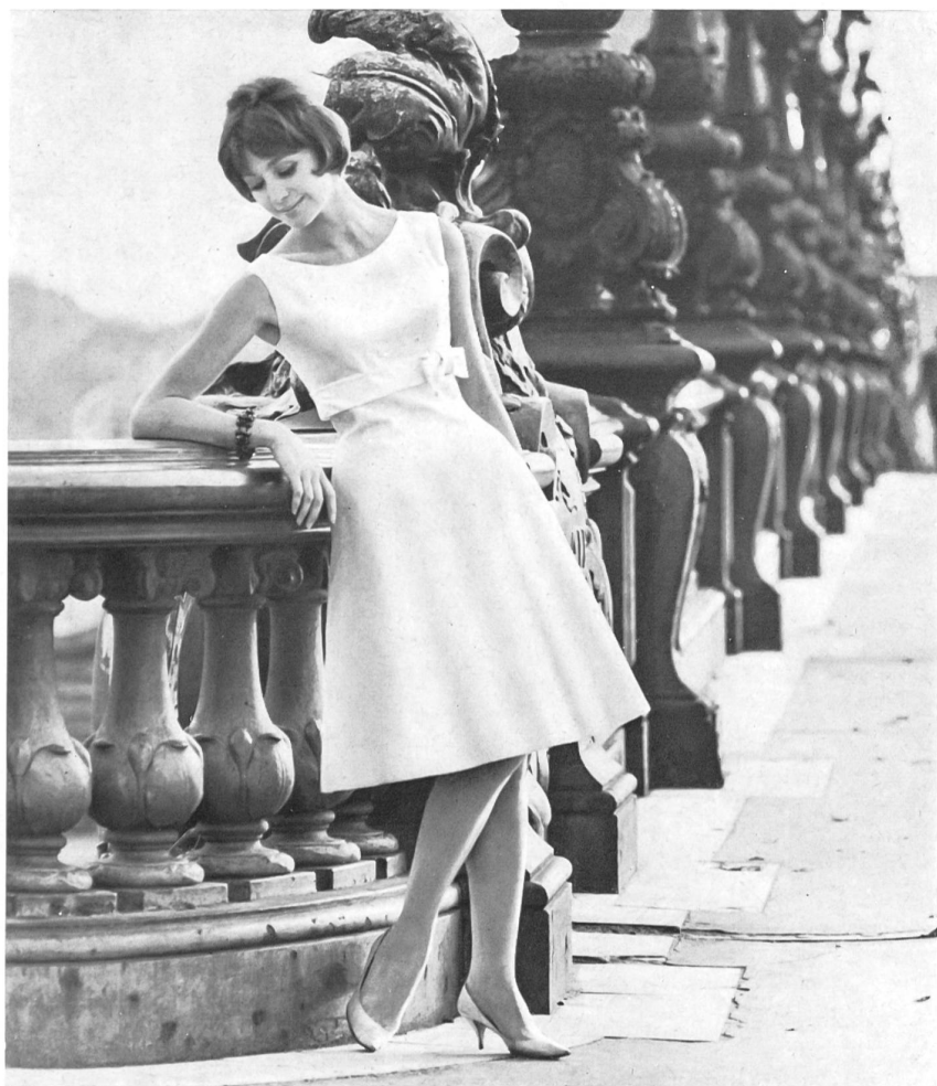
ROBT. SCHWARZENBACH & CO., THALWIL Tissu acétate « Joyeuse » – acetate fabric – tejido de acetato – Azetatgewebe Modèle Pierre Billet, Paris