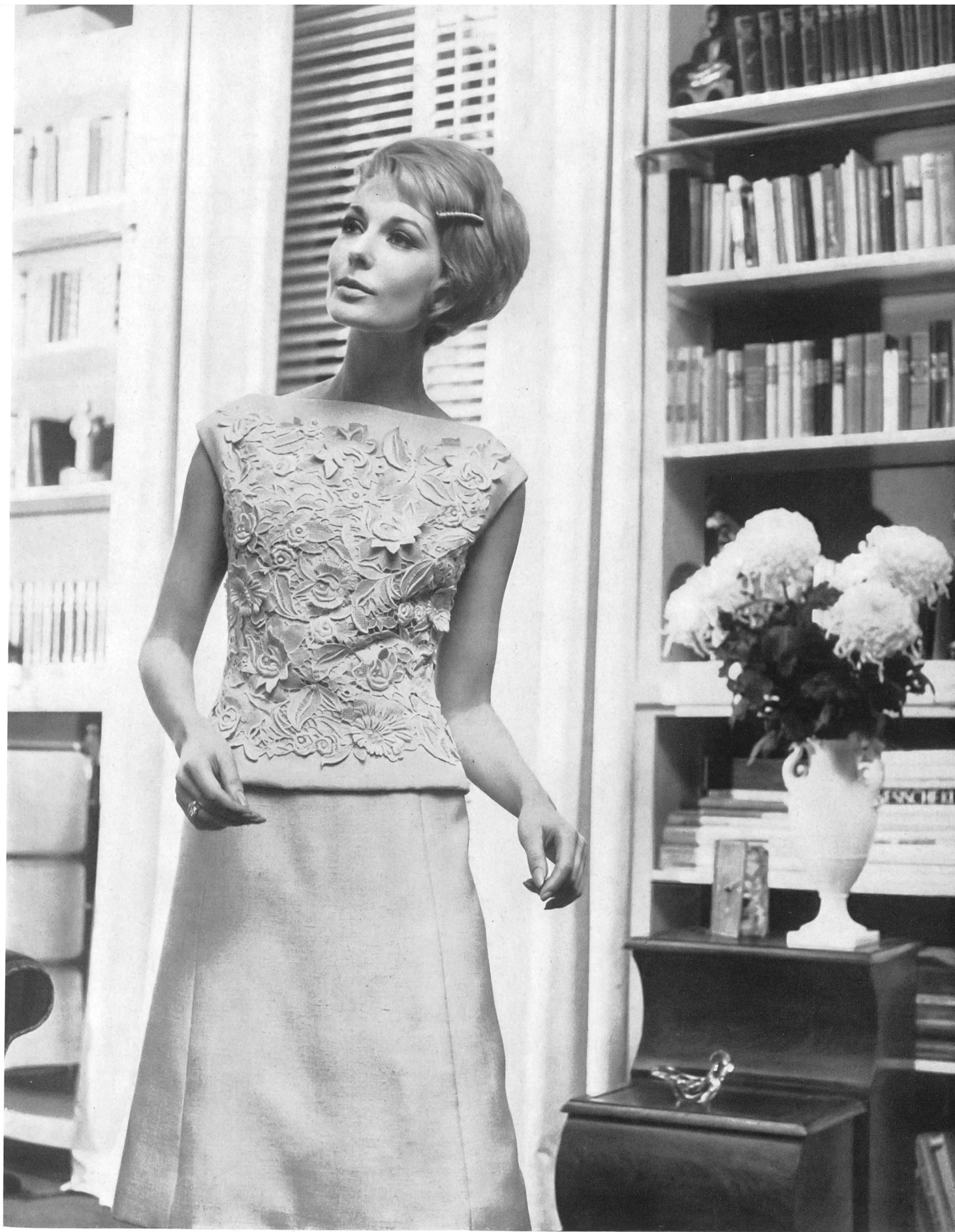
FORSTER WILLI & CO., SAINT-GALL Guipure Modèle Staeb-Seger, Berlin