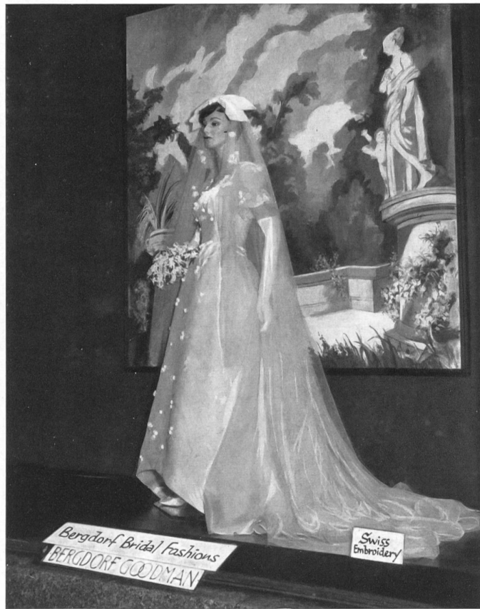
Robe de mariée en broderie suisse, exposée dans une vitrine du magasin Bergdorf-Goodman à New York Swiss embroidery bridal gown displayed in a Bergdorf-Goodman's store window in New York City