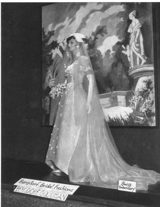
Robe de mariée en broderie suisse, exposée dans une vitrine du magasin Bergdorf-Goodman à New York Swiss embroidery bridal gown displayed in a Bergdorf-Goodman's store window in New York City