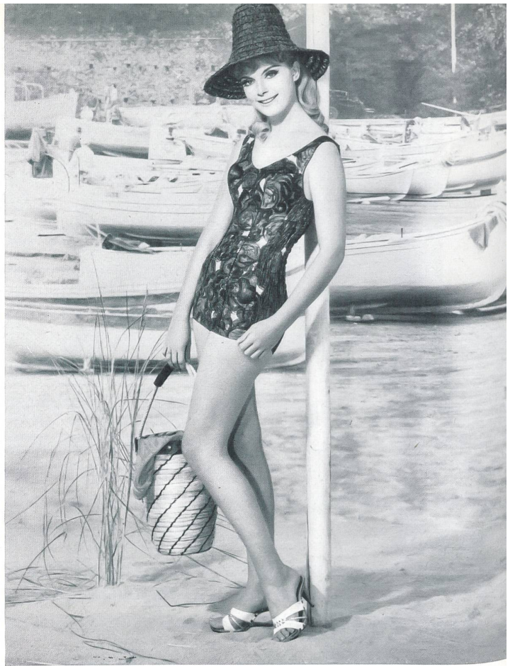
«ROBORO», J. F. ROHRER-BOLLIGER S.A., ROMANSHORN Maillot de bain en coton imprimé, épaulettes larges, profondément échancré dans le dos. — Printed cotton swimsuit, wide straps, deeply plunging back. — Bañador de algodón estampado, con hombreras anchas, muy escotado en la espalda. — Badeanzug aus bedrucktem Baumwollstoff, breite Träger, tiefer Rücken.