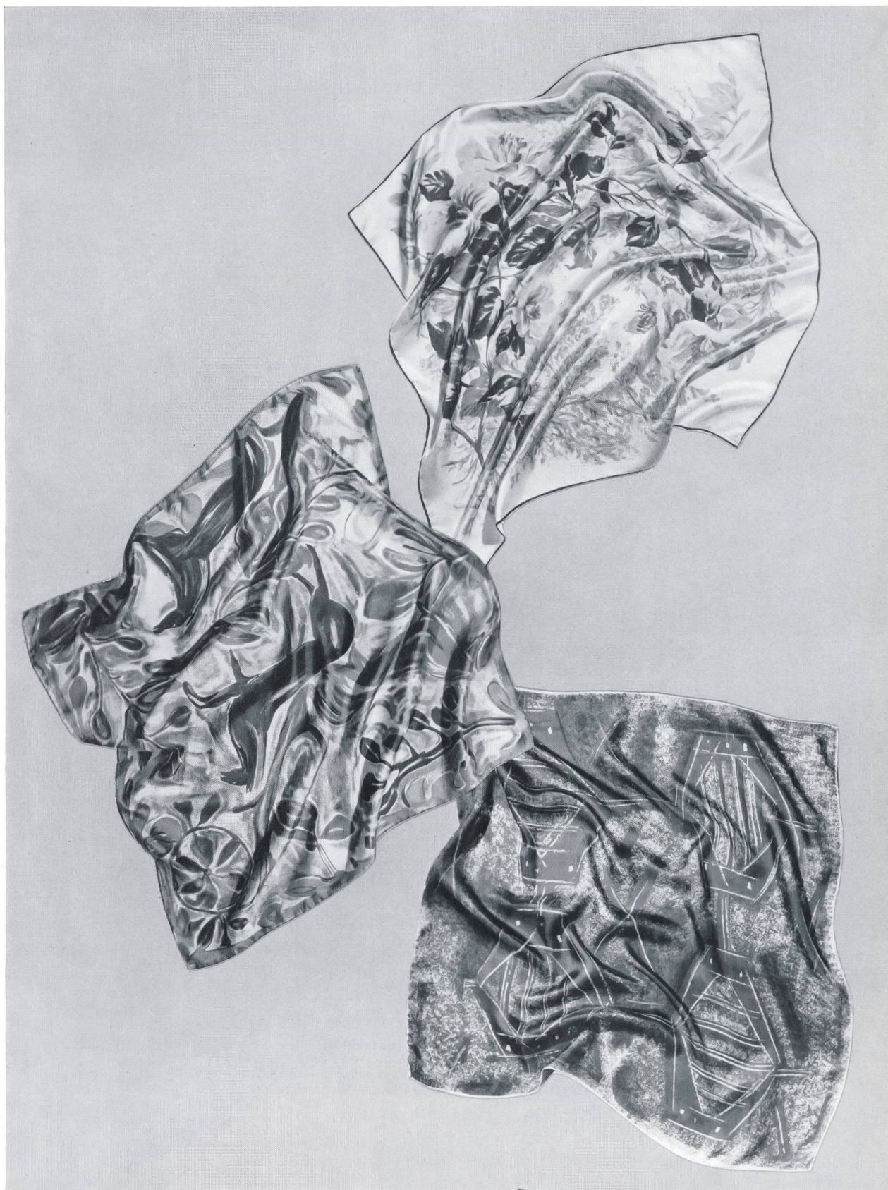
MAVIR, ZURICH Foulards imprimés sur pure soie et rayonne. Pure silk and rayon printed squares. Cuadrados estampa- dos sobre seda pura y rayón. Bedruckte Kopf- tücher in reiner Seide und Rayonne.