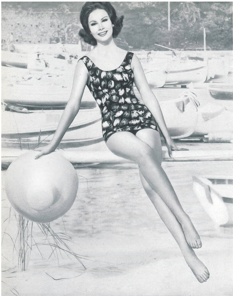
«ROBORO», J. F. ROHRER-BOLLIGER S.A., ROMANSHORN Maillot de bain en tissu «Hélanca» imprimé, épaulettes larges, profondément échancré dans le dos. — Printed "Helanca" swimsuit, wide straps, plunging low at the back. — Bañador de tejido «Helanca» estampado, con hombreras anchas, muy escotado en la espalda. — Badeanzug aus bedrucktem Helanca-stoff, breite Träger, tiefer Rücken.