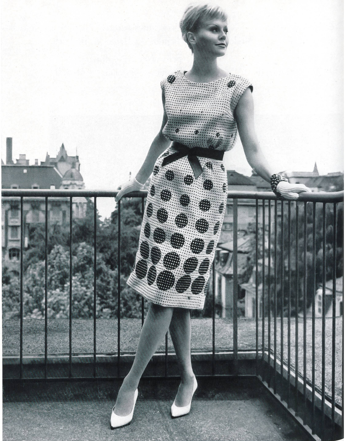
MAX KIRCHHEIMER FILS & CIE, ZURICH Tissu — fabric — tejido — Gewebe Modèle Cortesca A.-G., Zurich