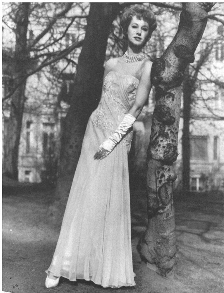
FORSTER WILLI & CO., SAINT-GALL

Applications de broderie Stickereiapplikationen Modell Charles Ritter, Hamburg-Lübeck