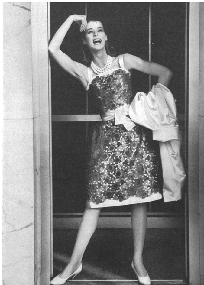
UNION S.A., SAINT-GALL

Applications de broderie Stickereiapplikationen Modell Charles Ritter, Hamburg-Lübeck