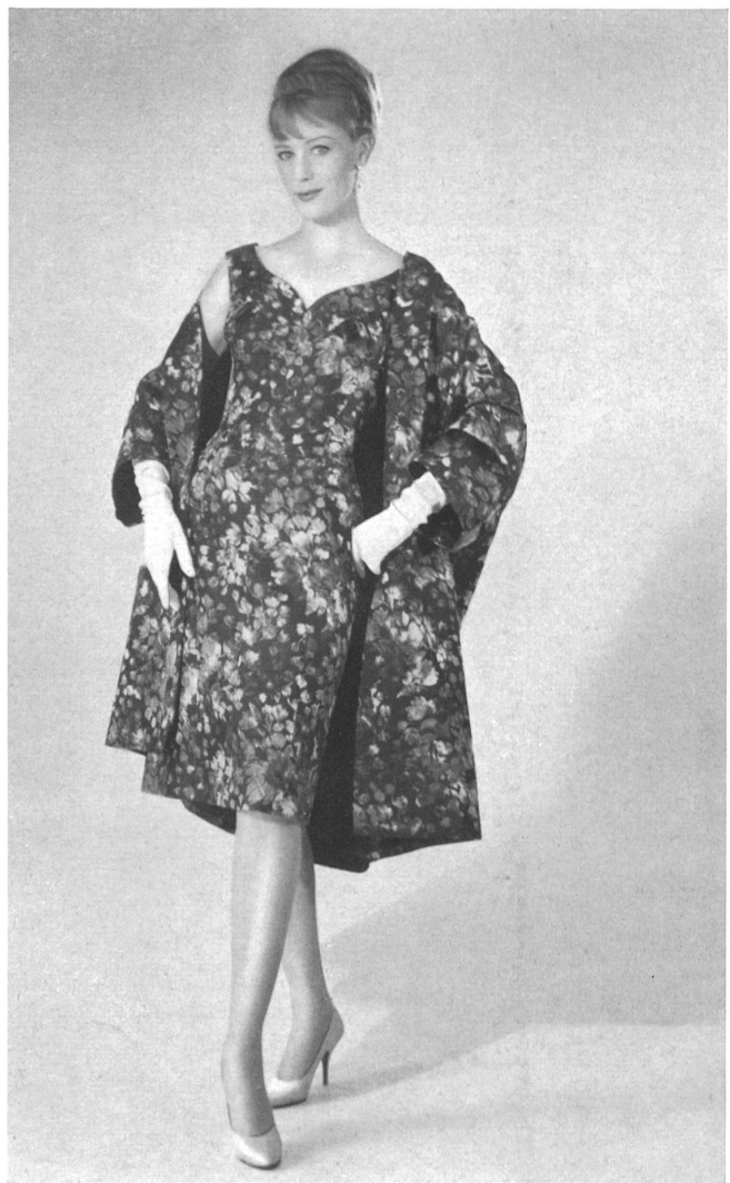
H. HALLER & CO., ZURICH Ensemble en jacquard pure soie Pure silk jacquard outfit Conjunto de tejido jacquard seda pura Complet aus reinseidenem Jacquard Gewebe