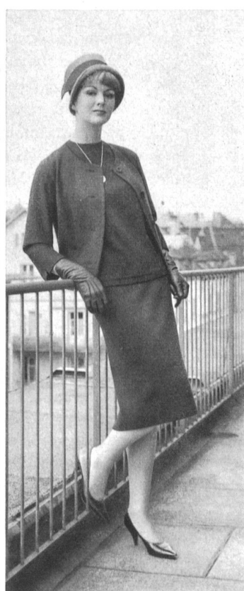
« SNAKY-BELFA » OUMANSKY & CO., GENÈVE Trois-pièces tricot Three-piece knitted outfit Tres piezas de punto