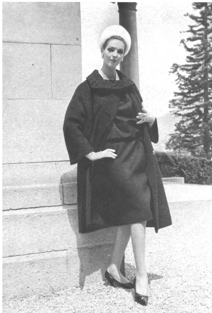
ARTHUR SCHIBLI S. A., GENEVE Robe noire avec manteau assorti Black dress with coat to match Vestido negro con abrigo haciendo juego Schwarzes Kleid mit passendem Mantel

de modelos de vestidos de punto de malla, de impermeables, de vestidos para después de la nieve, para los deportes de invierno y para la playa. A la hora del aperitivo, los asistentes pudieron examinar una exposición de lencería; después del almuerzo le tocó el turno a los abrigos, los trajes, dos piezas, vestidos, vestidos de punto para la tarde, blusas y artículos para niños. Vino luego la hora del té, y después de éste tuvo lugar la presentación de vestidos de cóctel y de noche. El programa se terminó por un cóctel y una cena. Reproducimos aquí varias vistas de ambiente impresionadas durante esta manifestación que, por lo demás, fue un verdadero éxito desde todos los puntos de vista.