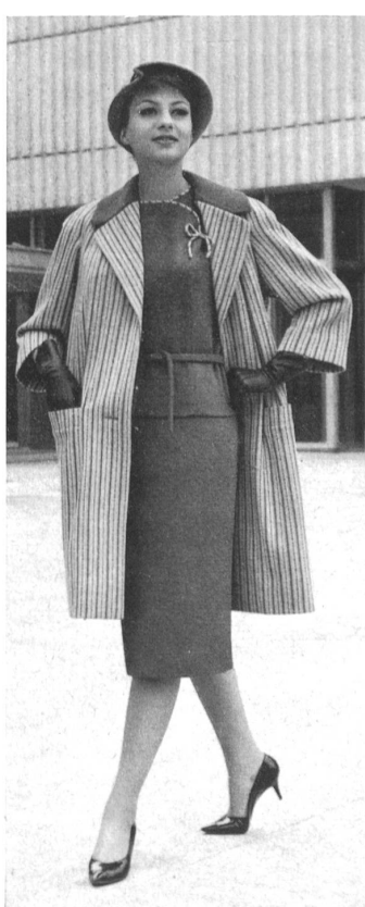
« HISCO » HIS & CIE S.A., MURGENTHAL Trois-pièces tricot Three-piece knitted outfit Tres piezas de punto