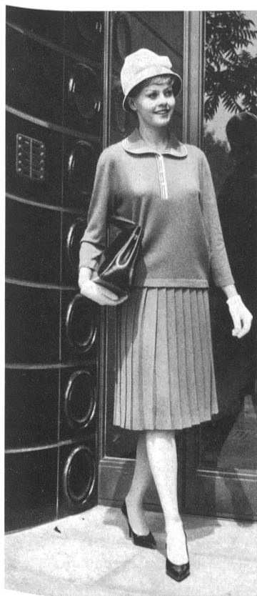
« ALPINIT » RUEPP & CIE S.A., SARMENSTORF Ensemble tricot Knitwear outfit Conjunto de punto