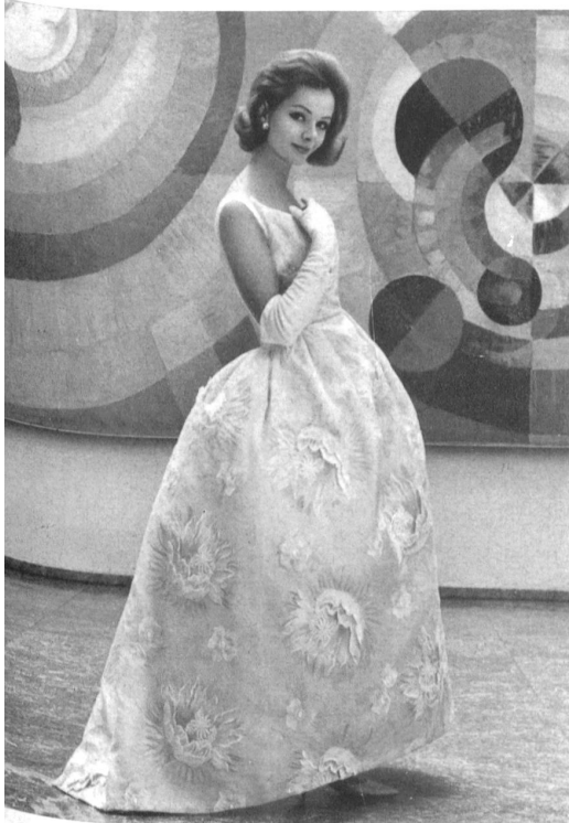
A. NAEF & CIE, FLAWIL Broderie - Embroidery - Bordado - Stickerei Modèle Mira, H. Grossenbacher AG., Zurich