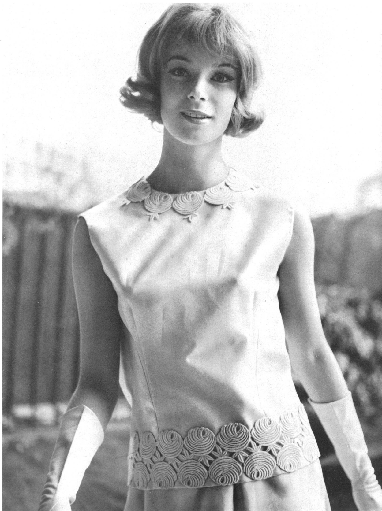
BERNARD SAGARDOY Bande de guipure de Jacob Rohner S. A., Rebstein