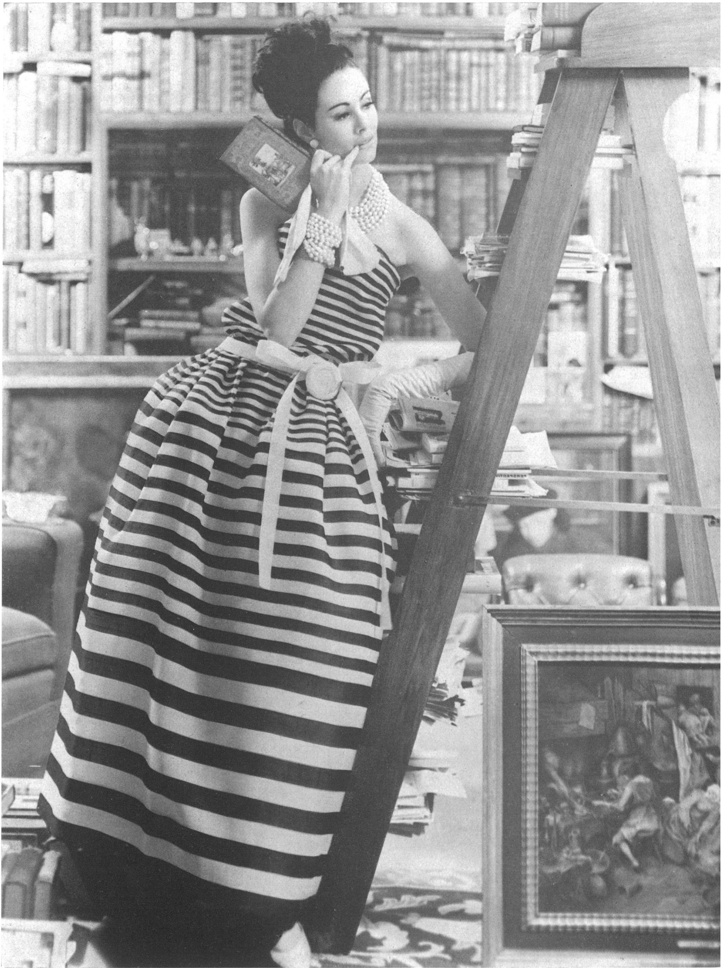
CHRISTIAN DIOR « Gazar » rayé de L. Abraham & Cie, Soieries S. A., Zurich