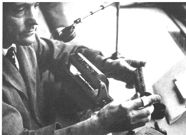
Grabador sobre rollos para la estampación de tejidos. (Cilander A.G., Herisau)

Exposición de una colección de tejidos para la decoración. (J.G. Nef & Co., Herisau)