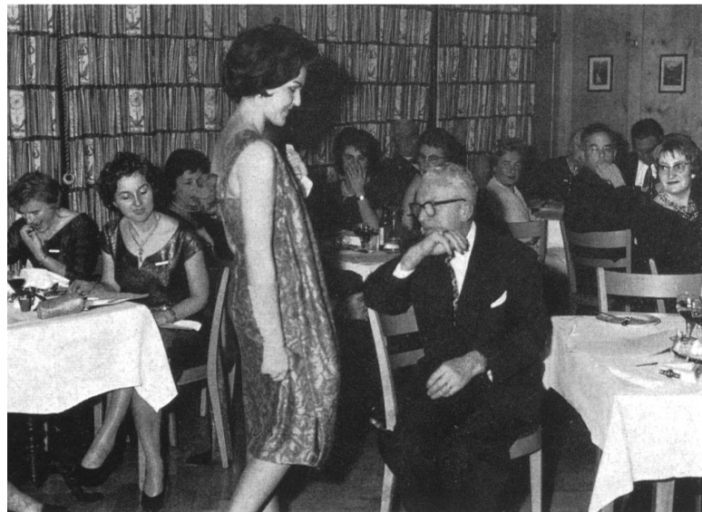
Durante el desfile.

En el mes de febrero ppdo., la Oficina de Propaganda de la Industria Suiza del Algodón y del Bordado, de San Galo, organizó para la prensa un viaje de dos días a través de la Suiza Oriental para informar más particularmente a los participantes sobre lo que la industria textil de la Suiza Oriental produce en cuanto se refiere a tejidos para el mobiliario, a lencería de casa, etc. El programa incluía sobre todo la visita de una fábrica de cortinas de tul, la otra de muebles acolchonados modernos, de un establecimiento de perfeccionamiento de textiles y, especialmente, del departamento de « estampación » y de una tejeduría de telas en colores. Los participantes asistieron además a la presentación de una colección recientísima de tejidos para tapizar paredes y muebles y pudieron ver una colección de tejidos para cortinas y ropa de cama. Para terminar, los periodistas presentes fueron recibidos en la Escuela Profesional del Bordado de la Suiza Oriental, domiciliada en San Galo, y tuvieron también ocasión de admirar una exposición de lencería de cama bordada, producida por varias empresas del bordado de San Galo y de sus alrededores.