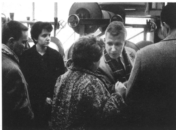
Periodistas visitando una tejeduría de algodón. (Meyer-Mayor Söhne, Neu St. Johann)