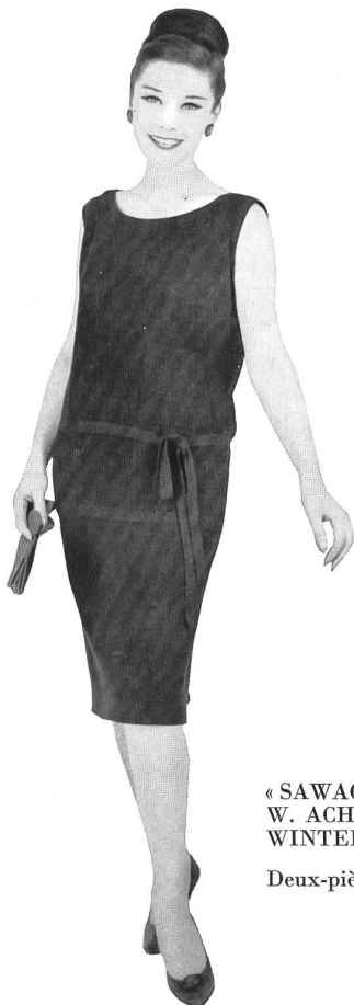
« SAWACO », W. ACHTNICH & CO. S. A., WINTERTHOUR

Deux-pièces très mode en jersey de dralon et Lurex