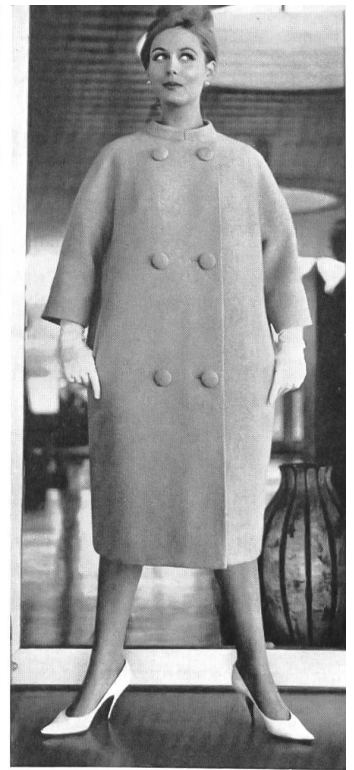
SCHMID A.G., GATTIKON Orlon/laine Modèle : Arthur Schibli S. A., Genève

Para terminar, mencionaremos que la Du Pont de Nemours International S. A. ha organizado un desfile de moda dedicado al orlón y que será presentado en distintos países. A esta manifestación han participado, entre otros, un gran número de fabricantes de artículos de punto y de prendas confeccionadas de Suiza y, indirectamente, de fabricantes suizos de tejidos. Esta presentación que abarcaba desde los trajes de baño hasta los vestidos de cóctel y los abrigos, pasando por los pulóveres y los conjuntos para deportes, confería una idea completa de las posibilidades tan sumamente variadas que se le ofrecen al orlón en la moda actual.