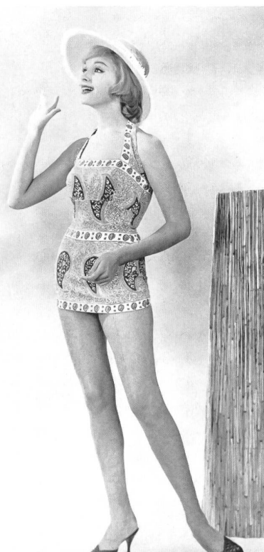
MYLORD S. A., CHATEL-SAINT-DENIS

Ensemble de loisirs en orlon « Hélanca »