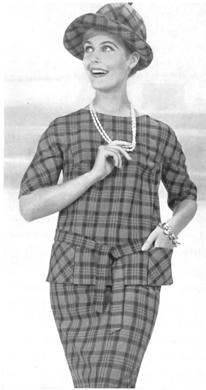
«ZURRER» WEISBROD-ZURRER FILS, HAUSEN s. A. Orlon/rayonne Modèle : Brüllmann & Co., Zurich