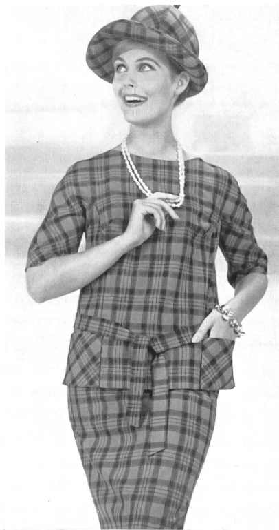
«ZURRER» WEISBROD-ZURRER FILS, HAUSEN s. A. Orlon/rayonne Modèle : Brüllmann & Co., Zurich