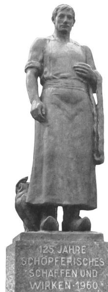
El Tintorero, estatua que adorna la fuente Heberlein en Wattwil