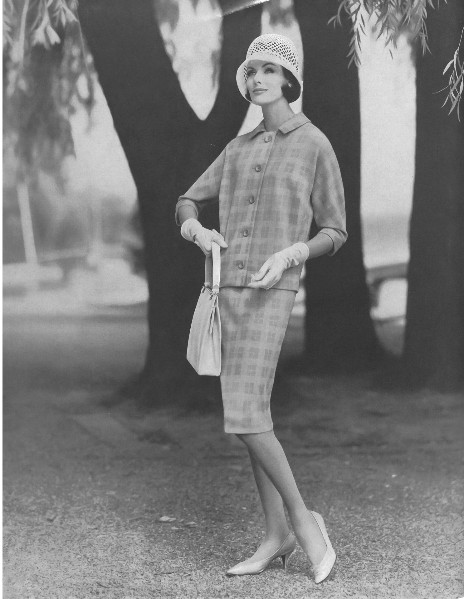
« PRIORA » 75 ans / 75 years / 75 Jahre JOH. LAIB & CIE S. A., AMRISWIL

Fabrique de bonneterie / Knitwear manufacturers / Strick-und Wirkwarenfabrik