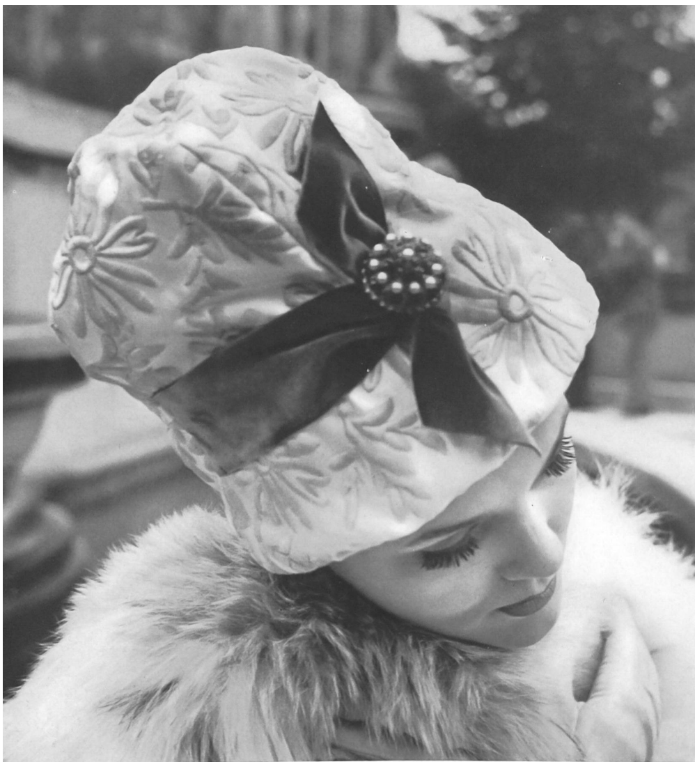
LANVIN CASTILLO Satin Duchesse brodé de Forster Willi & Co., Saint-Gall Grossiste à Paris : Robert Burg & Cie