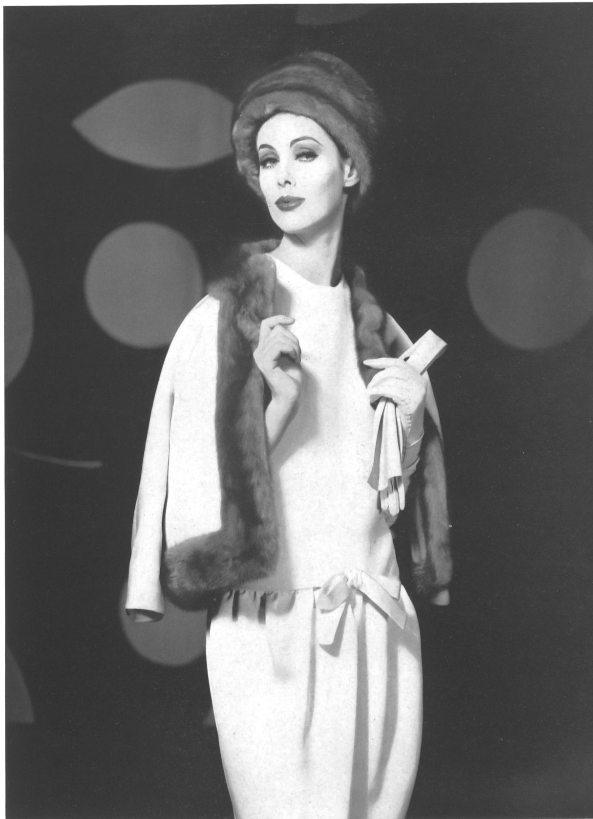
CHRISTIAN DIOR Gabardine de soie de L. Abraham & Cie, Soieries S. A., Zurich

MODÈLES EXCLUSIFS — REPRODUCTION INTERDITE