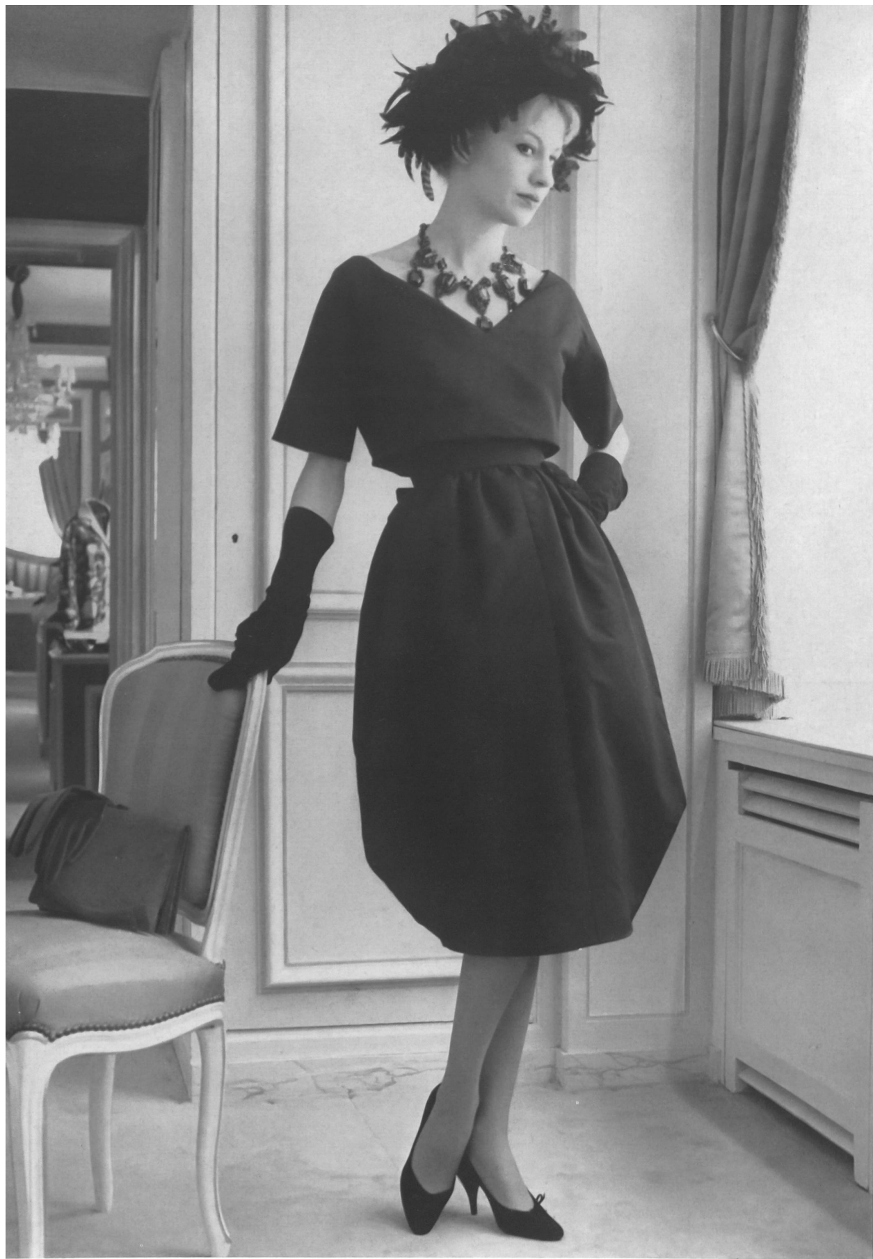
LANVIN CASTILLO Poulx de soie noir de la S. A. Stünzi Fils, Horgen