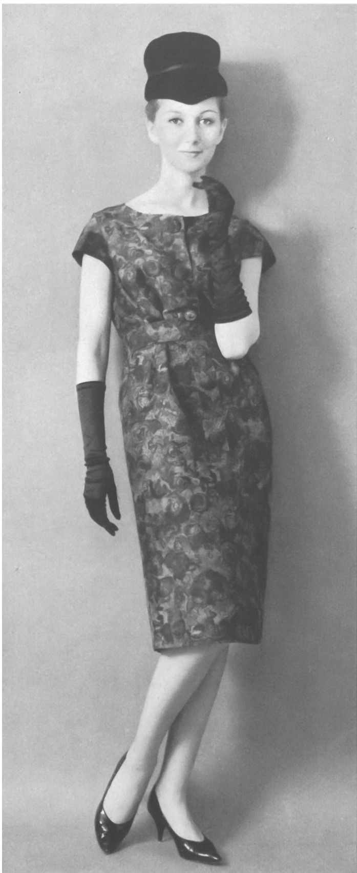
PIERRE CARDIN Soielaine « Miranda » de Reichenbach & Co., Saint-Gall Distribué par Montex, Paris