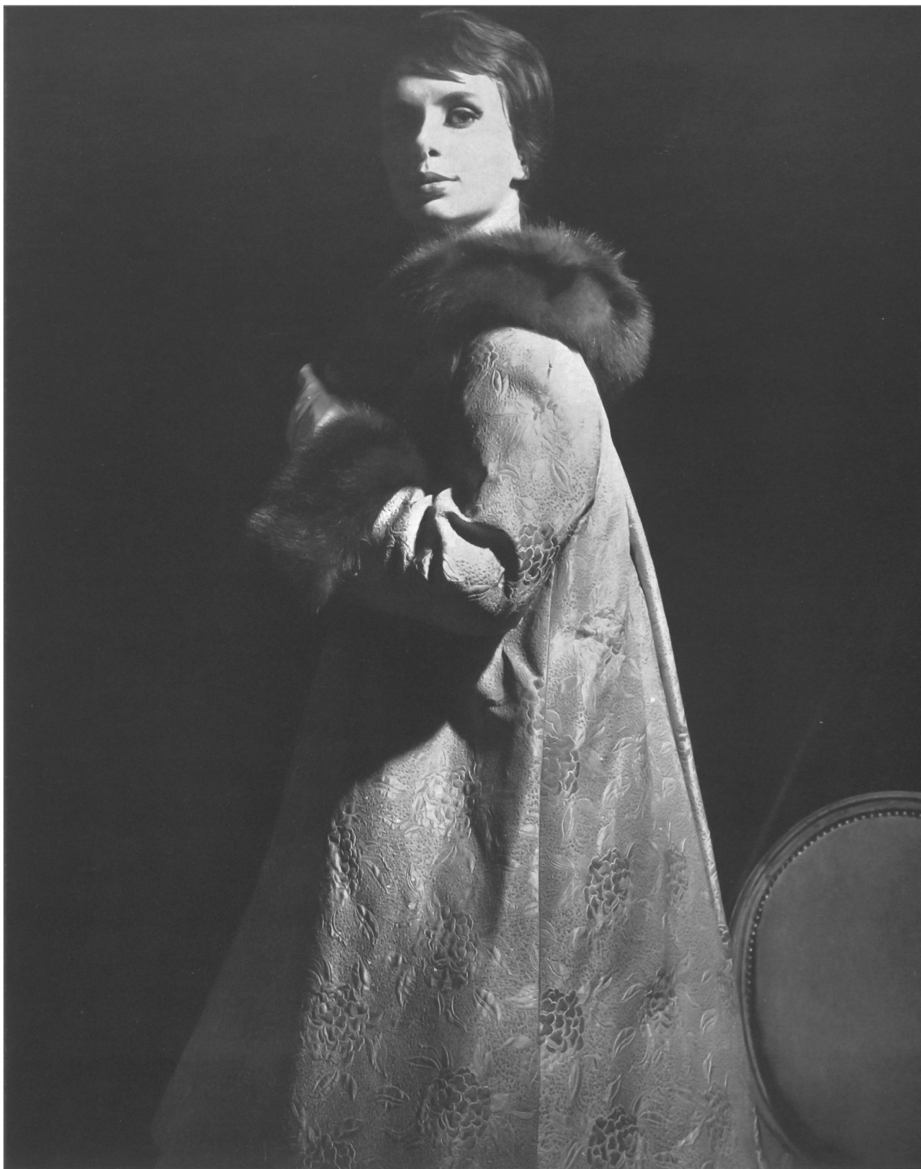
CARVEN Façonné tout soie des Soieries Stehli S. A., Zurich