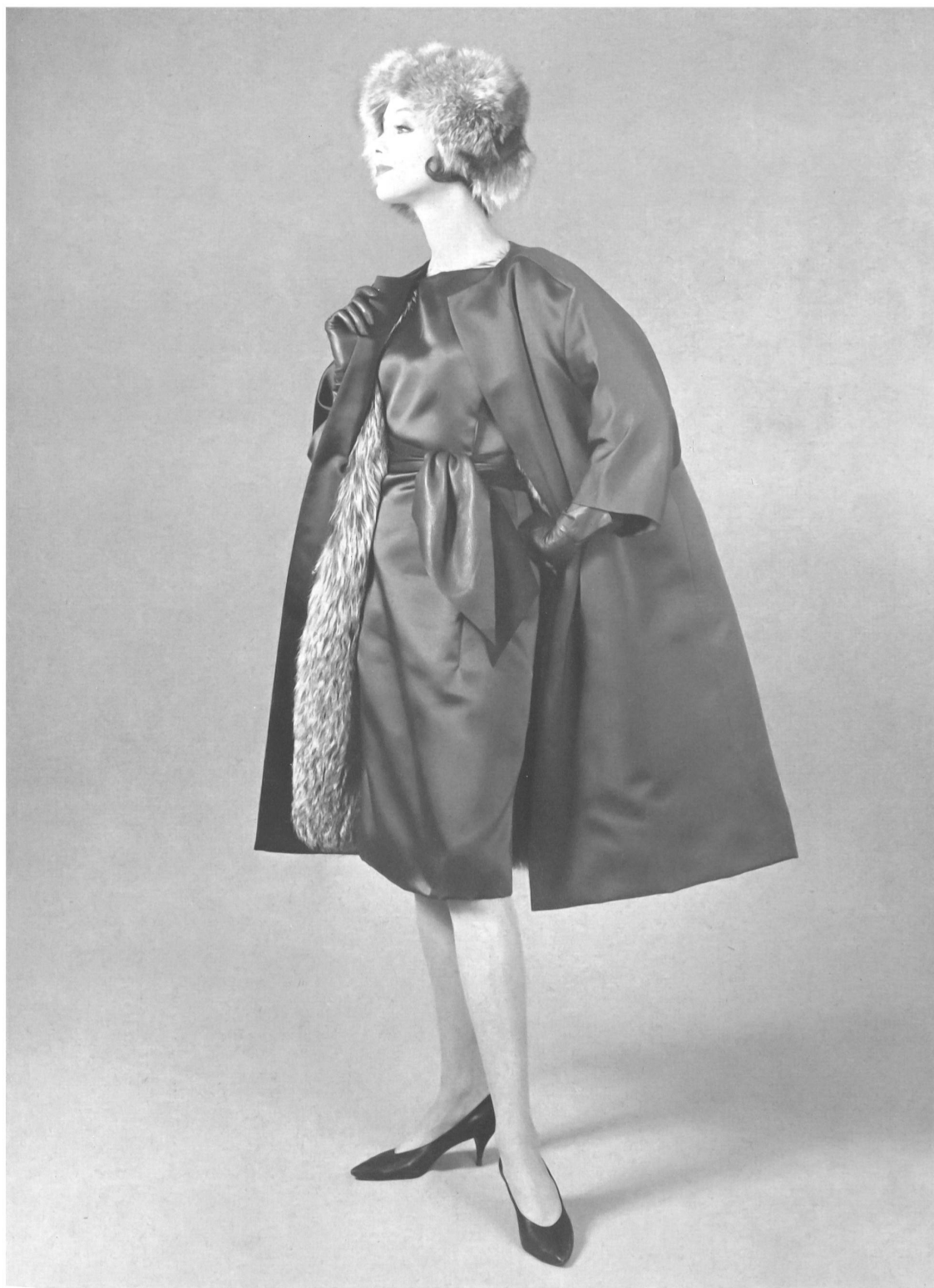
JACQUES HEIM Satin Duchesse de L. Abraham & Cie, Soieries S. A., Zurich