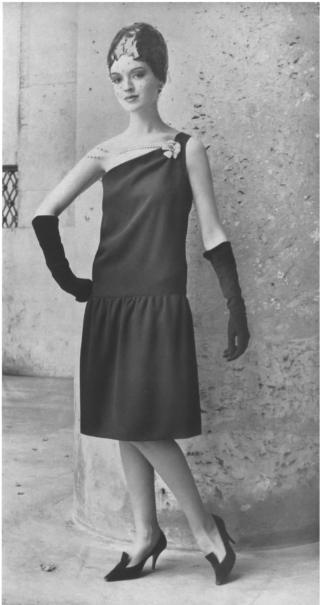
CHRISTIAN DIOR Crêpe noir de la S. A. Stünzi Fils, Horgen