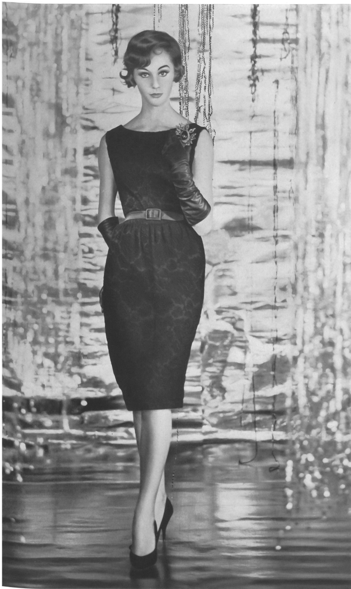
CHRISTIAN DIOR (Boutique) Organdi de soie brodé, genre Gobelin, de Forster Willi & Co., Saint-Gall