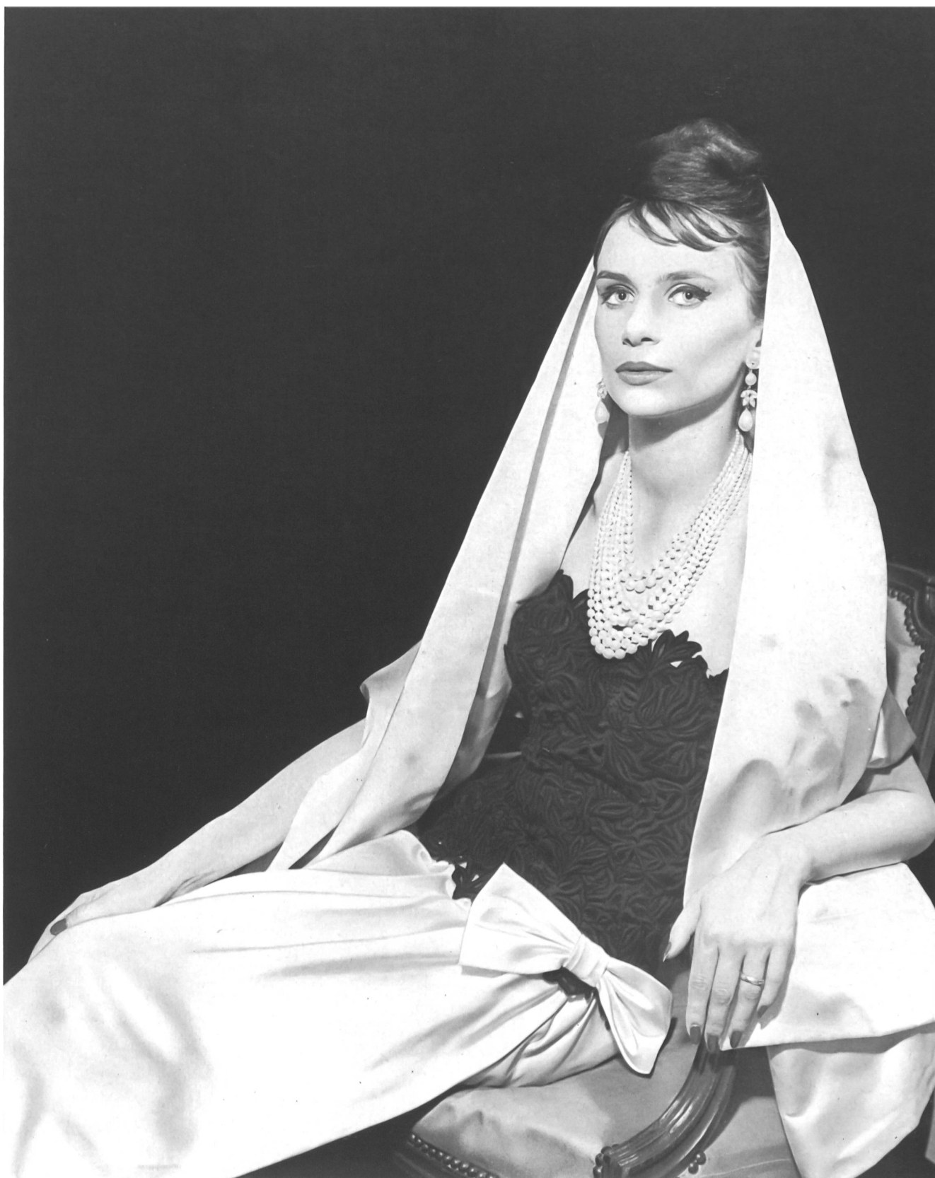
MAGGY ROUFF Broderie de laine sur organdi, genre guipure, de Forster Willi & Co., Saint-Gall Grossiste à Paris: Robert Burg & Cie