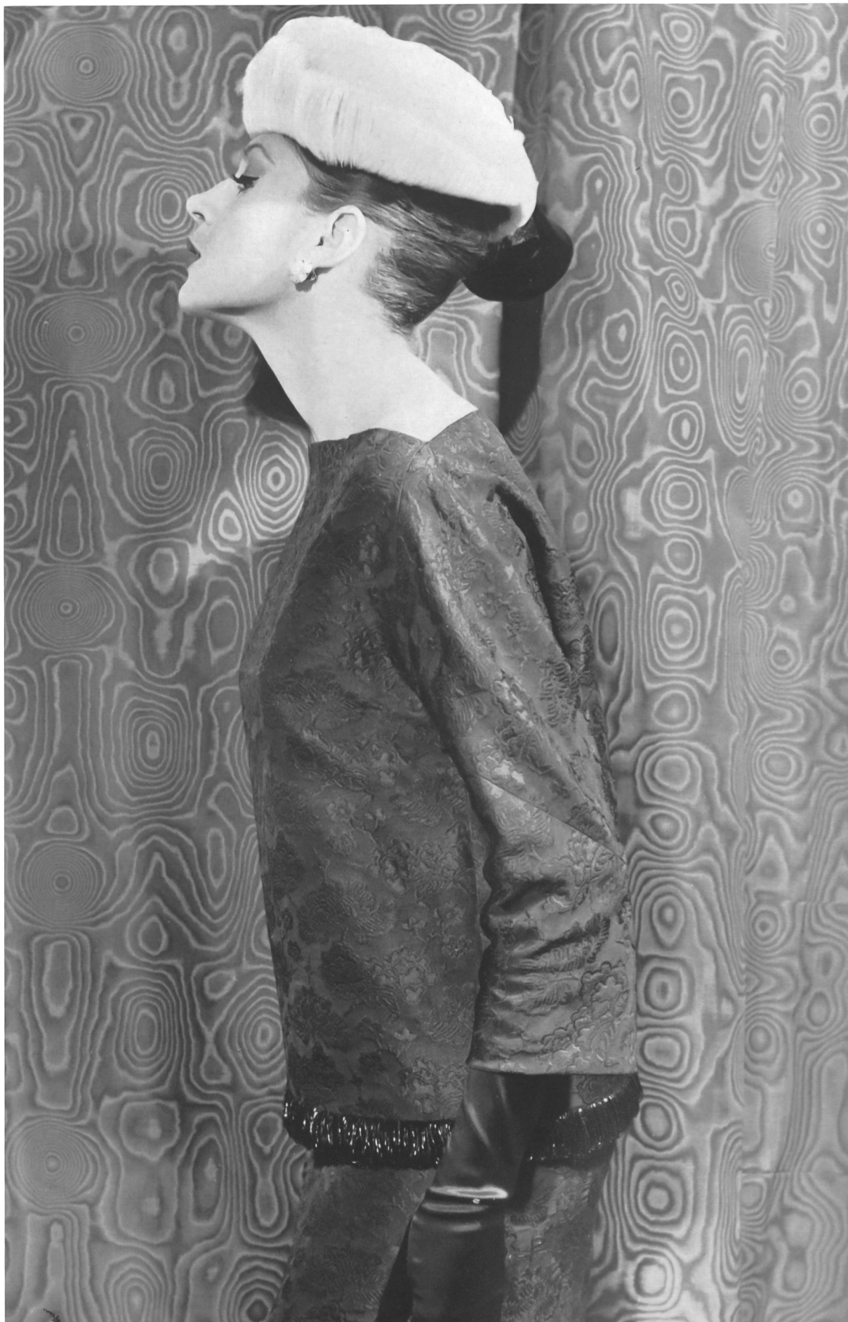
JACQUES GRIFFE Façonné tout soie des Soieries Stehli S. A., Zurich