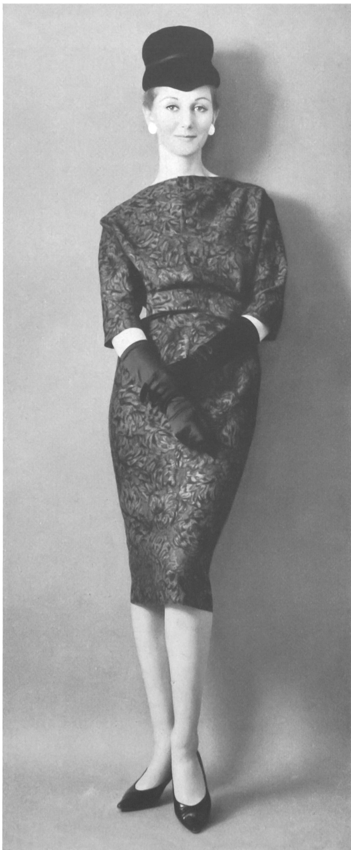
PIERRE CARDIN Tissu « Zingara » de Reichenbach & Co., Saint-Gall Distribué par Montex, Paris