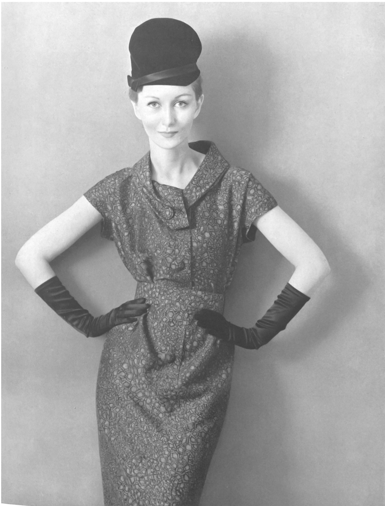
PIERRE CARDIN Soielaine « Miranda » de Reichenbach & Co., Saint-Gall Distribué par Montex, Paris