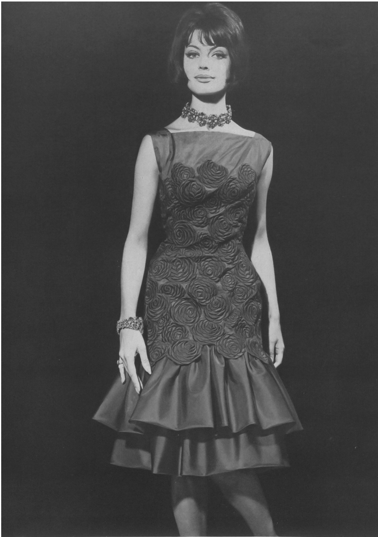
BERNARD SAGARDOY Broderie de coton sur organdi de pure soie de Jacob Rohner S.A., Rebstein