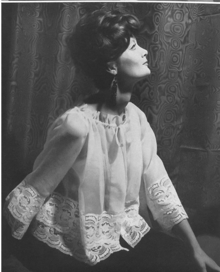
CHRISTIAN DIOR (Boutique) Fine dentelle brodée de Walter Stark, Saint-Gall