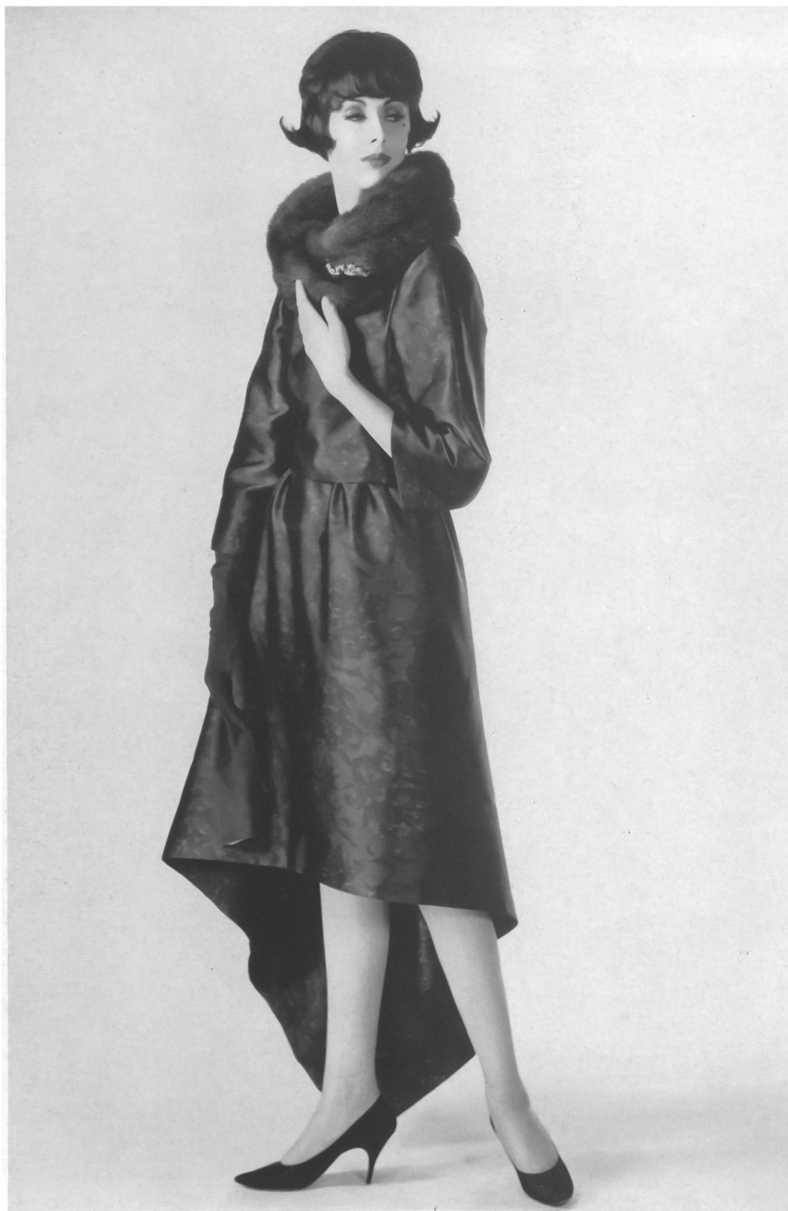
NINA RICCI Satin réversible imprimé sur chaîne de L. Abraham & Cie, Soieries S. A., Zurich