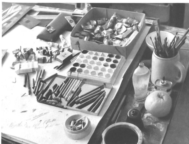
Las herramientas del artista.

Los creadores de los pañolitos Stoffels son sencillamente los que en la jerga de su oficio se llaman « dibujantes en textiles ». Reciben su formación en las escuelas profesionales textiles y de la moda y, a grandes rasgos, su programa semanal de estudios es el siguiente: