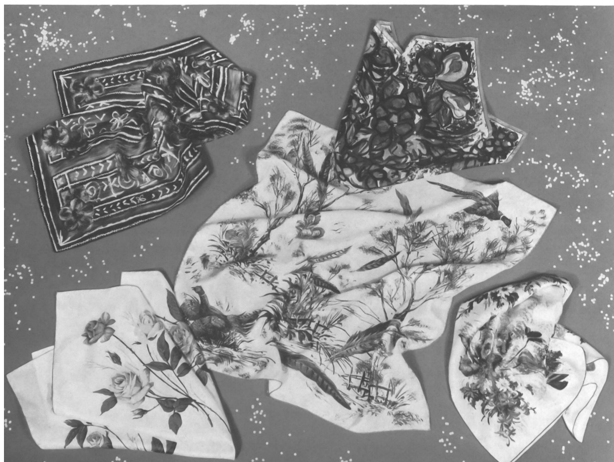
ARTHUR VETTER & CO., ZOLLIKON-ZURICH

Spezialist in reinseidenen, bedruckten und handgesäumten Echarpen und Vierecktüchern