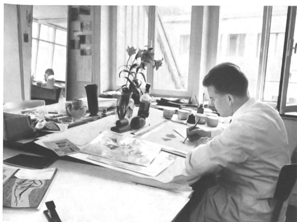
Dibujo del natural representando un delicado asunto floral para pañuelo.

¡ Cuán prosaico parece todo esto ! Sin embargo, estos creadores y estas creadoras de pañolitos Stoffels no son prosaicos ni mucho menos. Al penetrar en su taller, en el último piso del imponente edificio que ostenta el nombre de « Washington » en San Galo, nos acoge una música de buen gusto y los veremos sentados ante grandes mesas, vestidos de blusas blancas, rodeados de flores, de