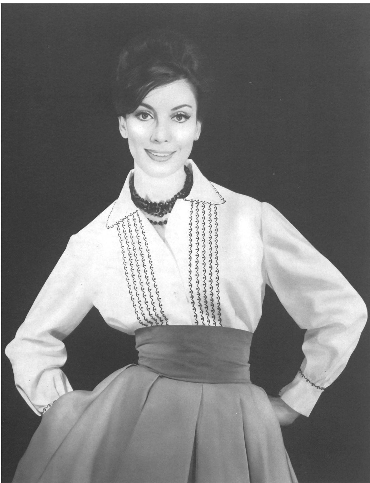
PIERRE BALMAIN (Boutique)

Blouse garnie de bandes brodées en noir de A. Naef & Cie S. A., Flawil Grossiste à Paris : Robert Burg & Cie