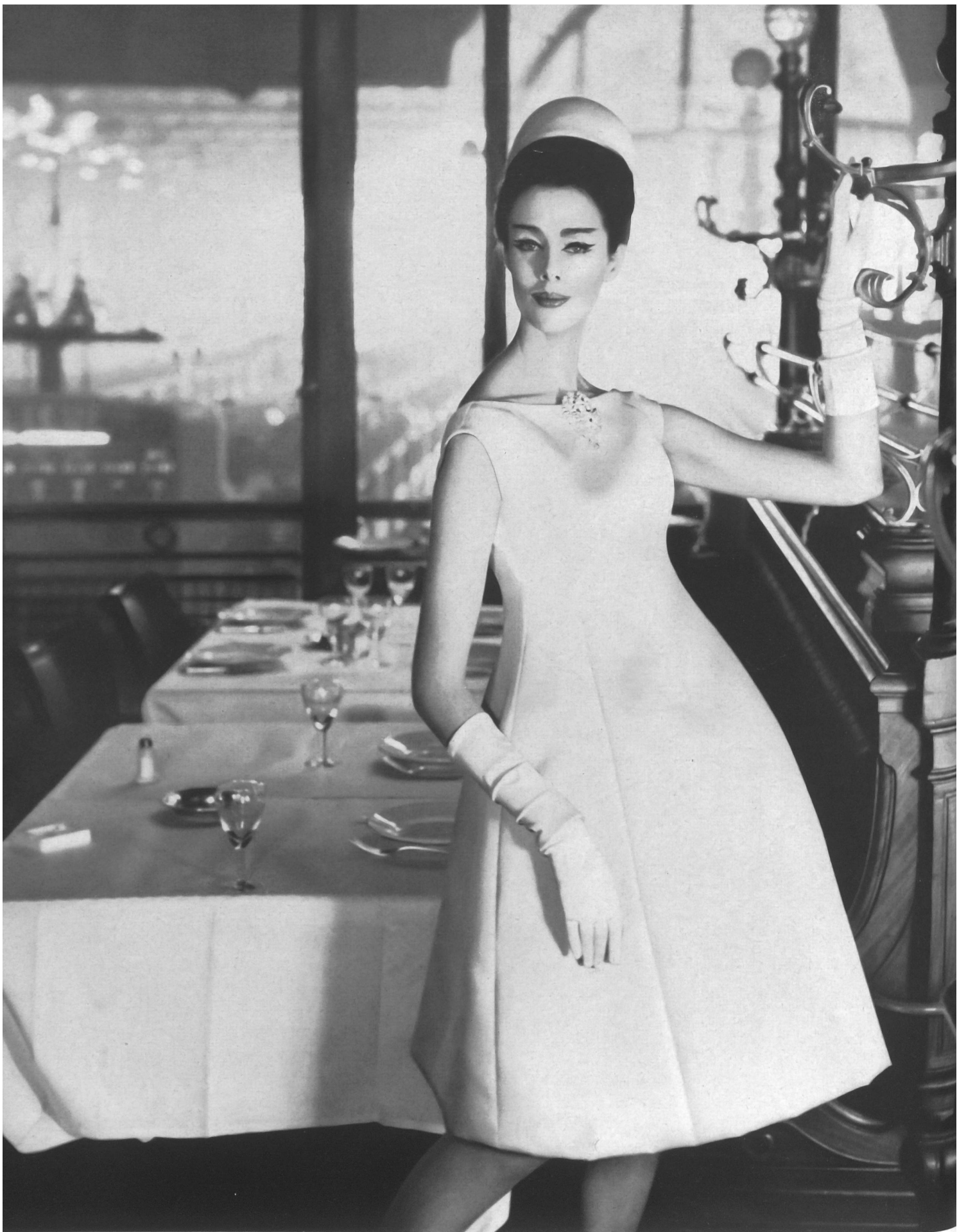
CHRISTIAN DIOR Gabardine de soie de L. Abraham & Cie, Soieries S. A., Zurich