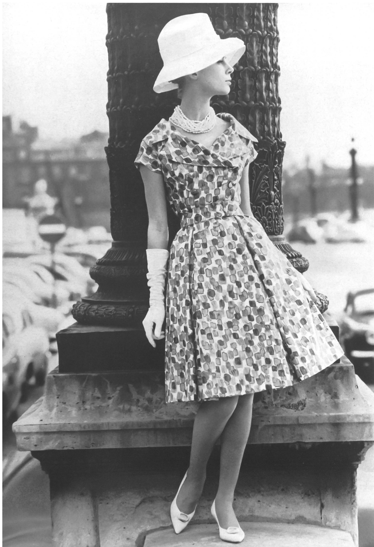
MAGGY ROUFF (Boutique) Madras imprimé de Naef Frères S. A., Zurich