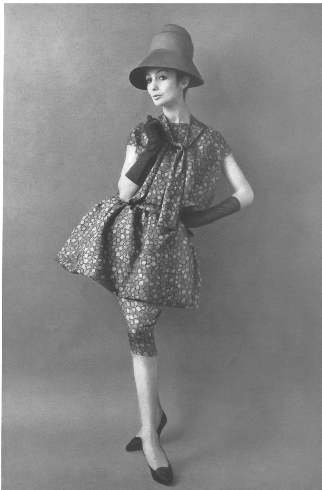
PIERRE CARDIN « Luanda » pure soie imprimé main de Rudolf Brauchbar & Cie S. A., Zurich Distribué par Montex, Paris