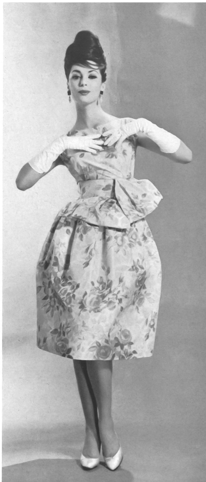
CHRISTIAN DIOR (Boutique) Taffetas chiné pure soie de Rudolf Brauchbar & Cie S. A., Zurich