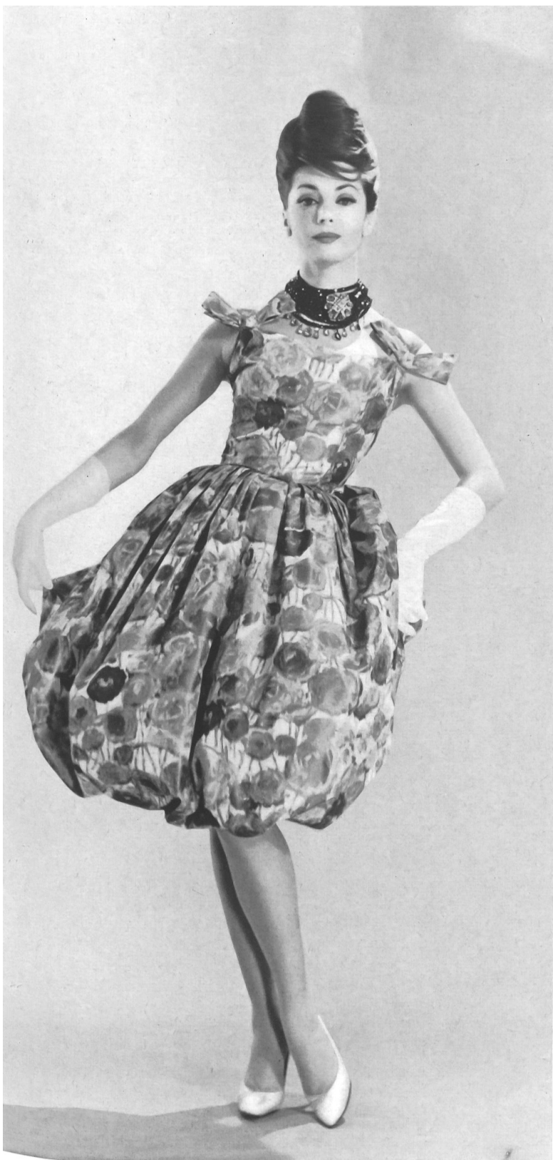
CHRISTIAN DIOR (Boutique) Taffetas chiné pure soie de Rudolf Brauchbar & Cie S. A., Zurich