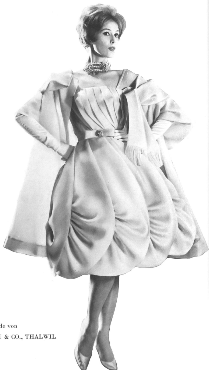
Modèle GACK, ZURICH

Satin organdi pure soie de Pure silk organdy satin by Raso organdi pura seda de Organdy Satin aus reiner Seide von