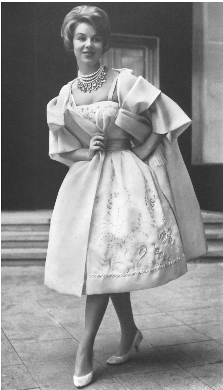
Modèle GACK, ZURICH

Satin organdi pure soie de Pure silk organdy satin by Raso organdi pura seda de Organdy Satin aus reiner Seide von