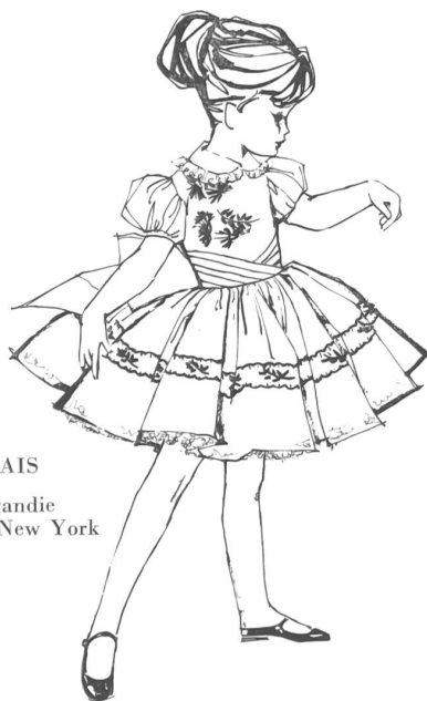
EISENHUT & CIE, GAIS Embroidered cotton organdie Model by Cair Classics, New York