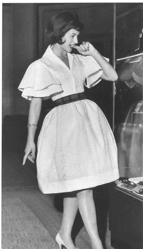
« RECO », REICHENBACH & CO., SAINT-GALL

Batiste brodée Minicare Minicare embroidered batist Modèle Marinelli, Nice