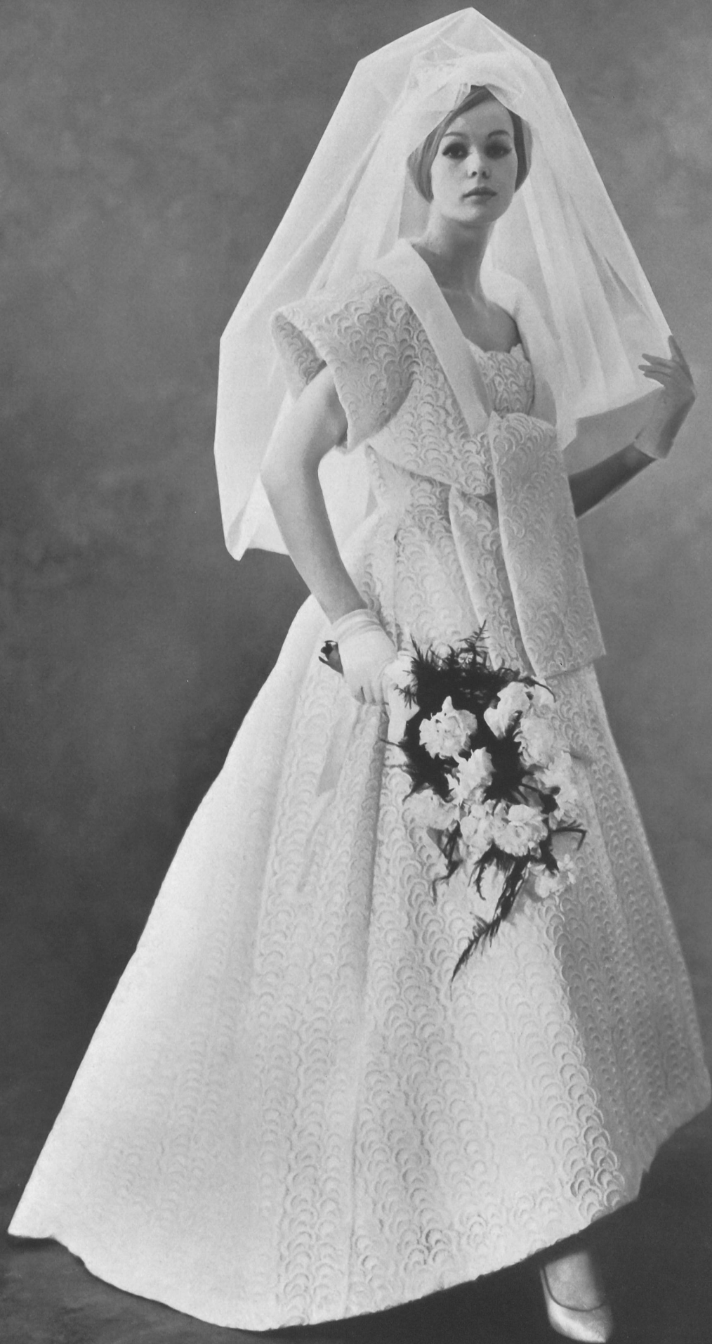
Modèle GACK, ZURICH Photo Rév

Guipure lourde de Heavy guipure by Encaje de guipur pesado de Schwere Guipure-Spitze von FORSTER WILLI & CO., SAINT-GALL