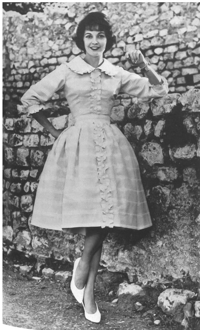
« RECO », REICHENBACH & CO., SAINT-GALL

« Recosablé » Minicare Modèle Brigitte, Cannes