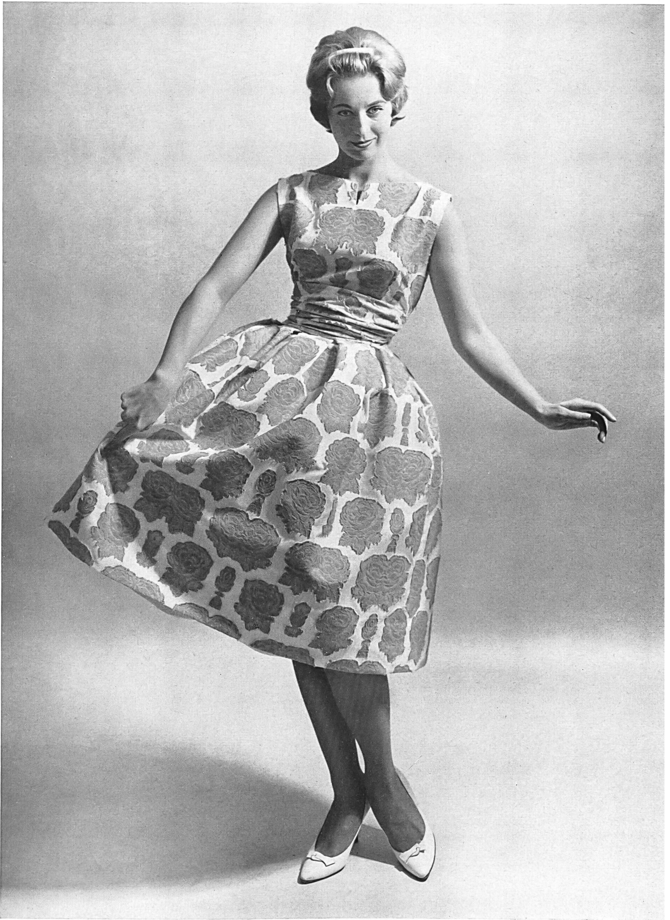
ROBT. SCHWARZENBACH & CO., THALWIL « Gavotte », tissu jacquard pur coton, infroissable Reinbaumwollenes Jacquard-Gewebe, knitterfrei Modèle A/B Lena-Modeller, Göteborg