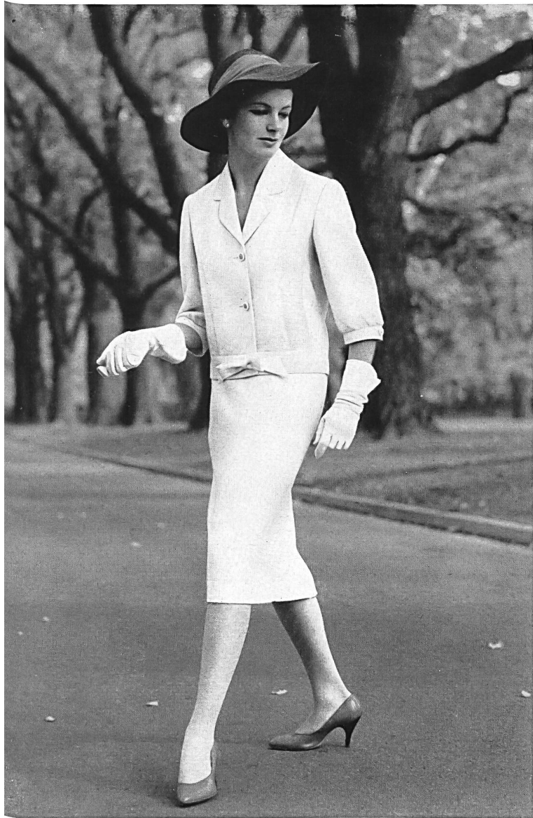
« ZURRER » WEISBROD-ZURRER SÖHNE, HAUSEN a.A. « Nanking » pure fibranne / pure spun rayon Modèle Raymon Manufacturing Co., Melbourne