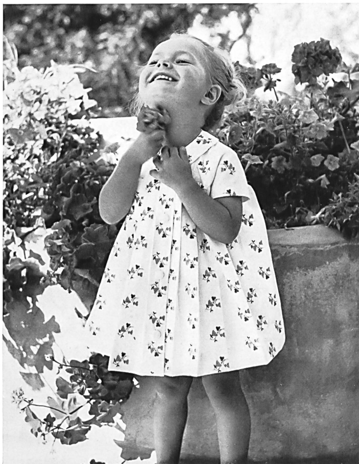
JACOB ROHNER S. A., REBSTEIN