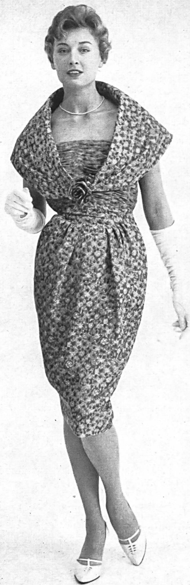
ROBT. SCHWARZENBACH & CO., THALWIL Imprimé pure soie / pure silk printed fabric Modèle Continental Modes, Sydney