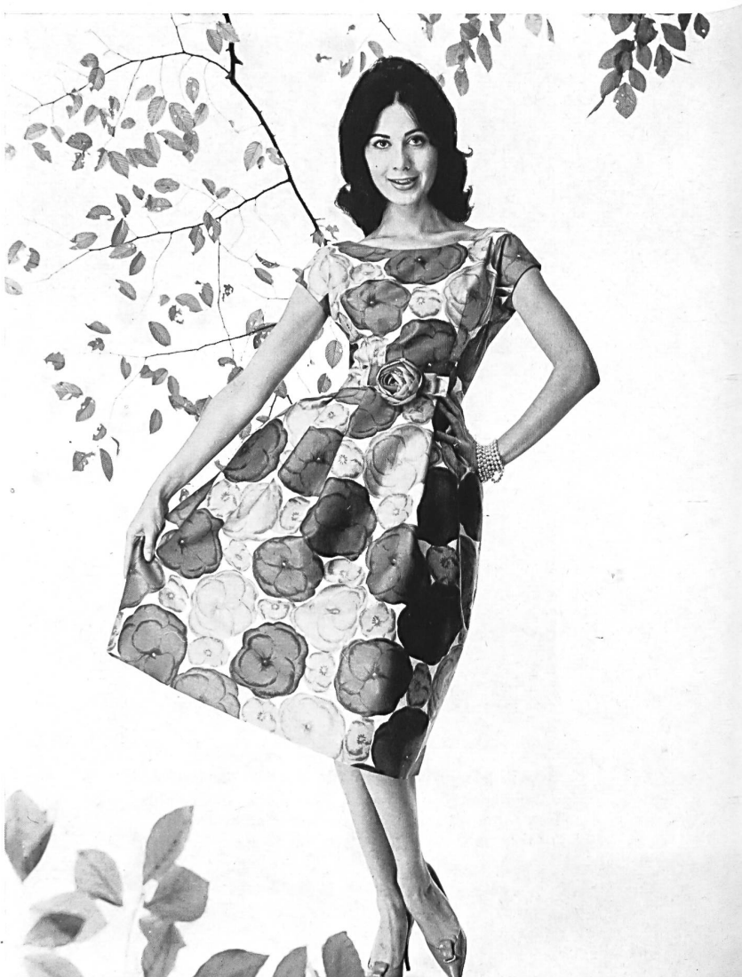
HEER & CIE S. A., THALWIL « Satin Sauvage », coton imprimé Grossiste à Paris: Robert Burg & Cie Modèle Géo Boutet, Paris