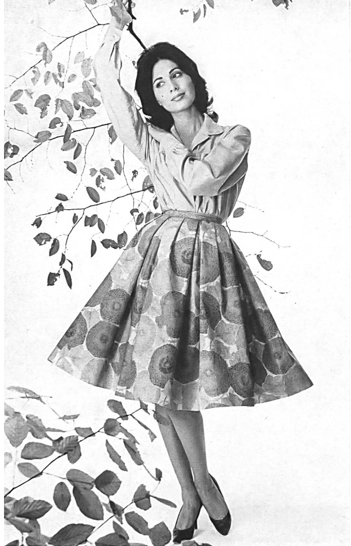
HEER & CIE S. A., THALWIL « Satin Flirt », coton imprimé Grossiste à Paris: Robert Burg & Cie Modèle Péroche, Paris