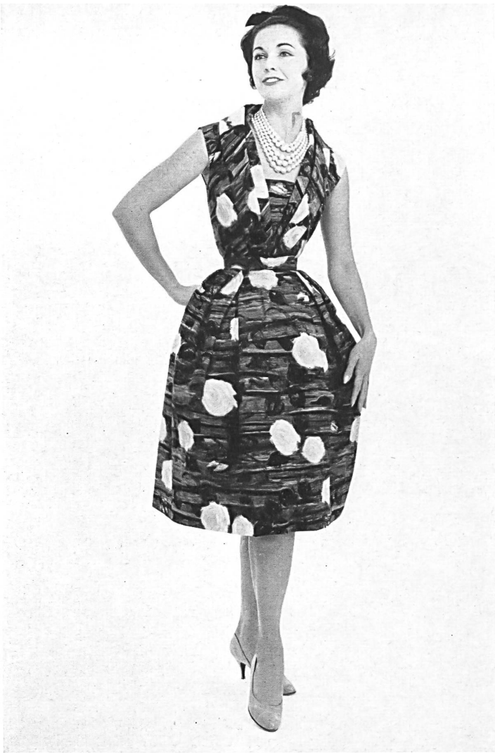
HEER & CIE S. A., THALWIL « Sarabande », coton imprimé Grossiste à Paris: Robert Burg & Cie Modèle Josette, Nice