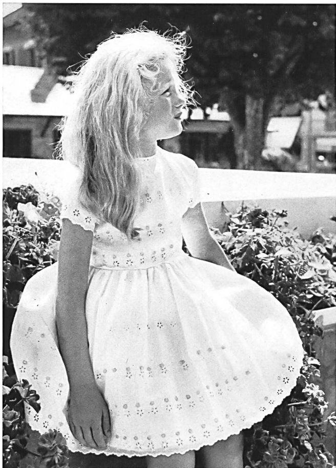
JACOB ROHNER S. A., REBSTEIN

Batiste Minicare blanche, brodée en blanc avec applications d'impression au pistolet. Modèle Michèle Roger