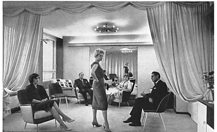
Presentación de modas en un salón particular