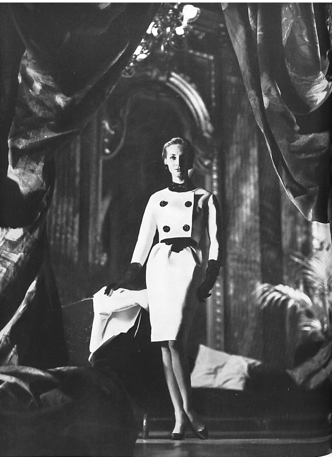
CHRISTIAN DIOR Ensemble et manteau en Satin double-face de L. Abraham & Cie, Soieries S. A., Zurich