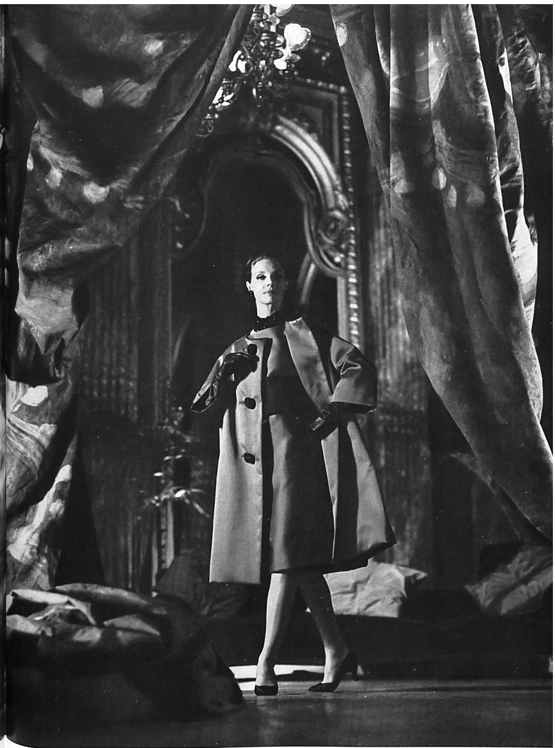
CHRISTIAN DIOR Robe et manteau en Satin double-face de L. Abraham & Cie, Soieries S. A., Zurich