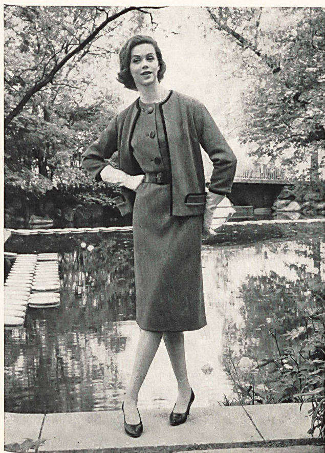
Conjunto de [dos piezas, con dibujo en espinape, de tela de malla hecha con «Helanca» y lana. MODELE VOLLMOELLER S. A., USTER