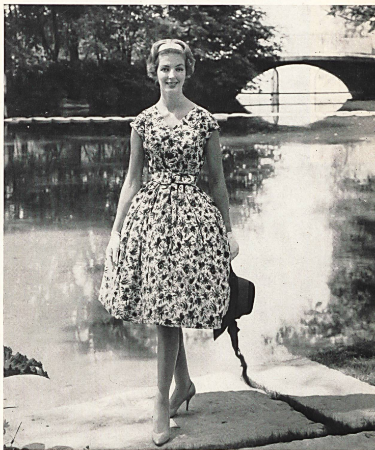
Vestido para verano, de malla estampada hecha de hilados «Helanca». MODELE «ISA», JOS. SALLMANN & CO., AMRISWILL