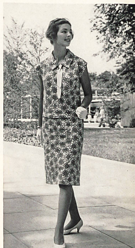
Conjunto de dos piezas en género de malla estampada hecha de hilado «Helanca». MODELE «DUO», ASPOR S. A., PORRENTROY