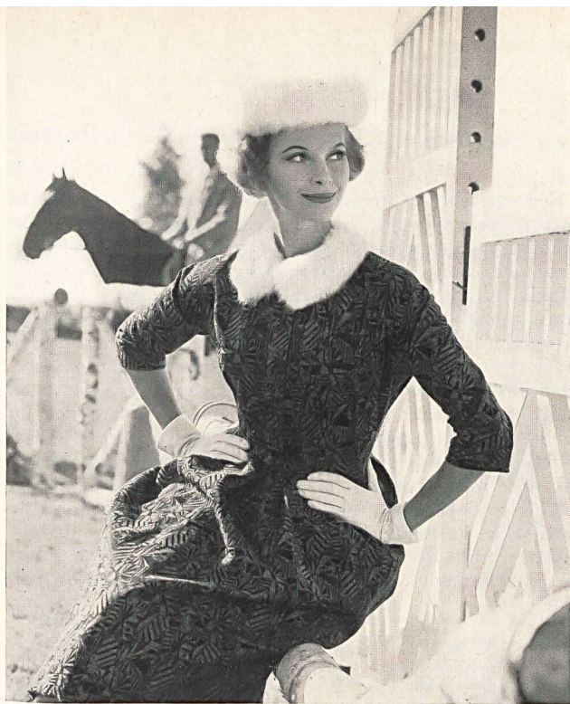
STOFFEL & CO., SAINT-GALL