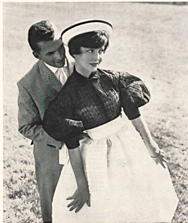
UNION S. A., SAINT-GALL

Porque San Galo combina siempre su gran acontecimiento deportivo con la presentación de las más bellas realizaciones de su industria. Así pues, como todos los años, tuvo lugar un desfile de maniqués en el hipódromo,