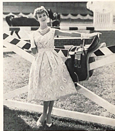
FORSTER WILLI & CO., SAINT-GALL

Bordado oruga sobre organdi Modèle Gack, Zurich