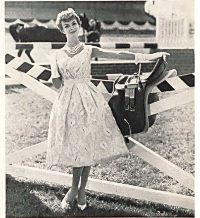
FORSTER WILLI & CO., SAINT-GALL

Bordado oruga sobre organdi Modèle Gack, Zurich