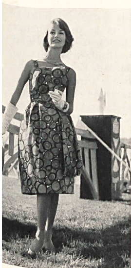
METTLER & CIE S. A., SAINT-GALL

Todos los años, a fines del verano, se reúne en San Galo la crema y nata del deporte ecuestre con motivo de sus « Jornadas Hípicas ». El caballo ha conservado un puesto de honor en la Suiza Oriental, región que, como no lo hemos de olvidar, era puramente agrícola y ha seguido siéndolo, antes de ser industrial. Por eso no tiene nada de extraño el que, en la lista de las personas premiadas en los concursos hípicos, figuren nombres conocidos en el mundo de los textiles.