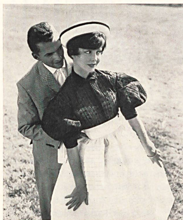
UNION S. A., SAINT-GALL

Porque San Galo combina siempre su gran acontecimiento deportivo con la presentación de las más bellas realizaciones de su industria. Así pues, como todos los años, tuvo lugar un desfile de maniqués en el hipódromo,