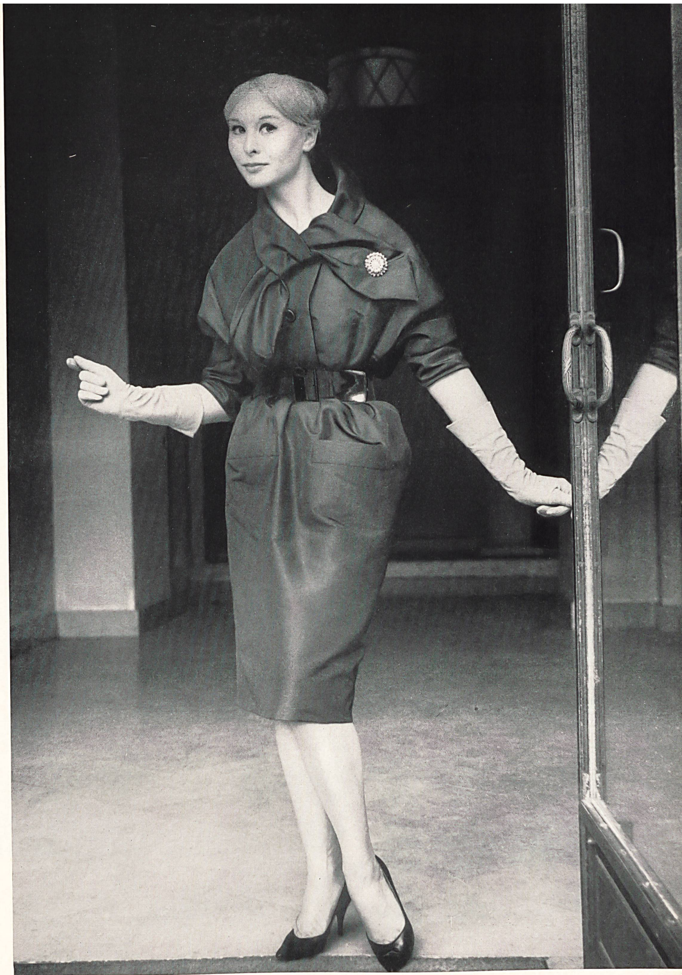
NINA RICCI Poult de soie de la S.A. Stünzi Fils, Horgen