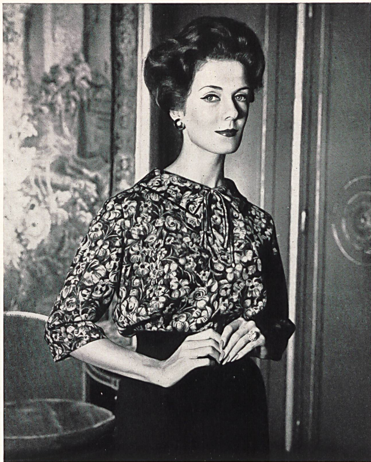
PIERRE CARDIN Laine imprimée « Crapella » de Rudolf Brauchbar & Cie S.A., Zurich Distribué par la Maison Montex, Paris