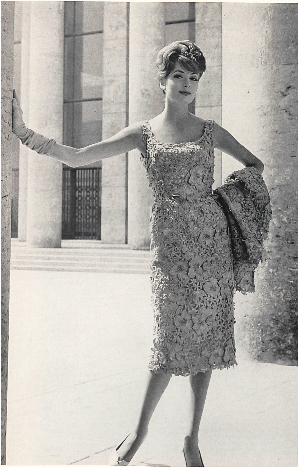
JEAN DESSES Broderie métal de A. Naef & Cie, Flawil Grossiste à Paris : Les Tisseurs B. de M.