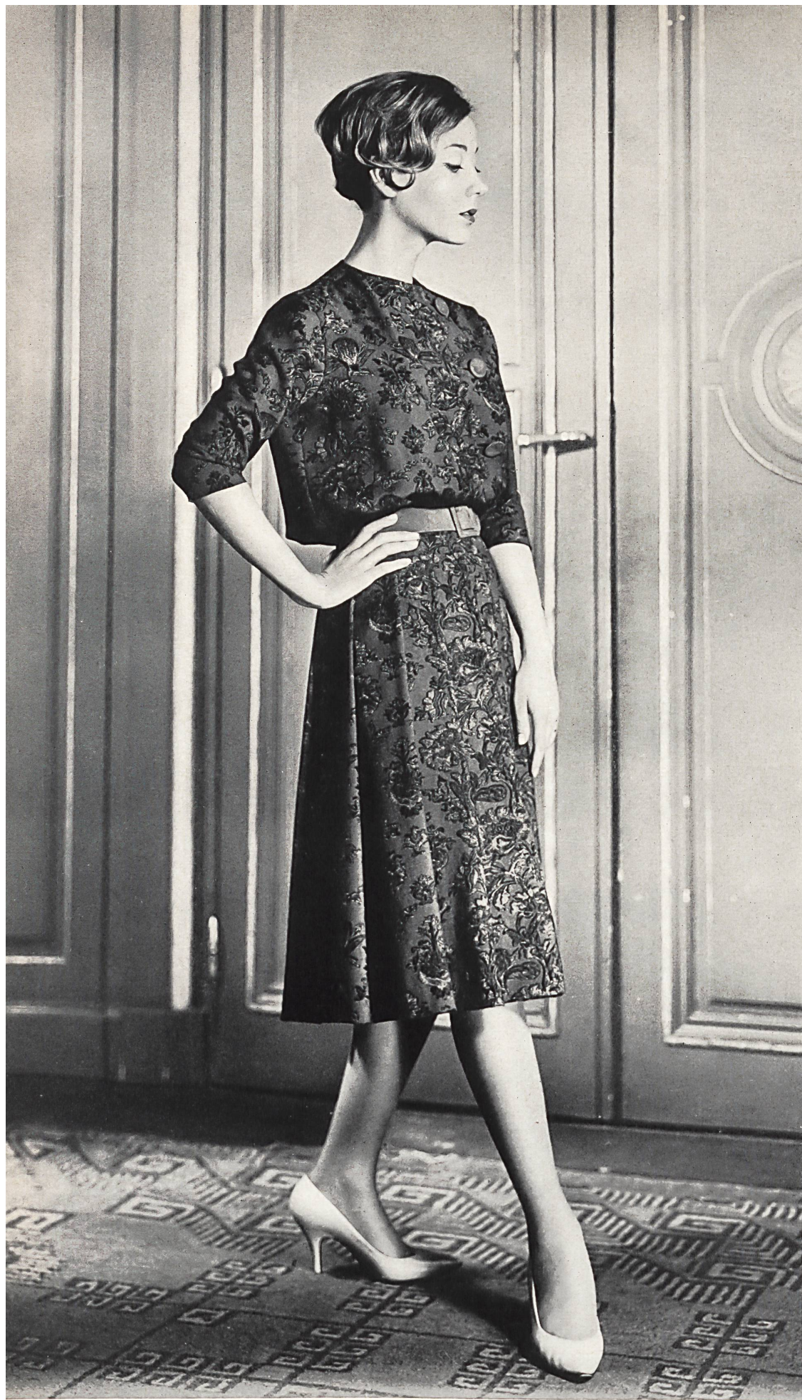
BERNARD SAGARDOY Laine imprimée « Crapella » de Rudolf Brauchbar & Cie S.A., Zurich Distribué par la Maison Montex, Paris