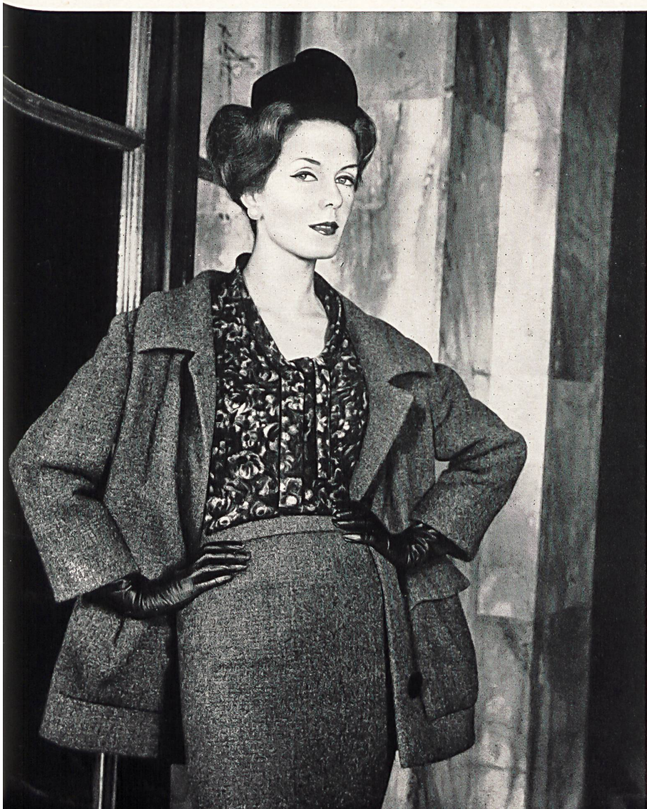
PIERRE CARDIN Laine imprimée « Crapella » de Rudolf Brauchbar & Cie S.A., Zurich Distribué par la Maison Montex, Paris