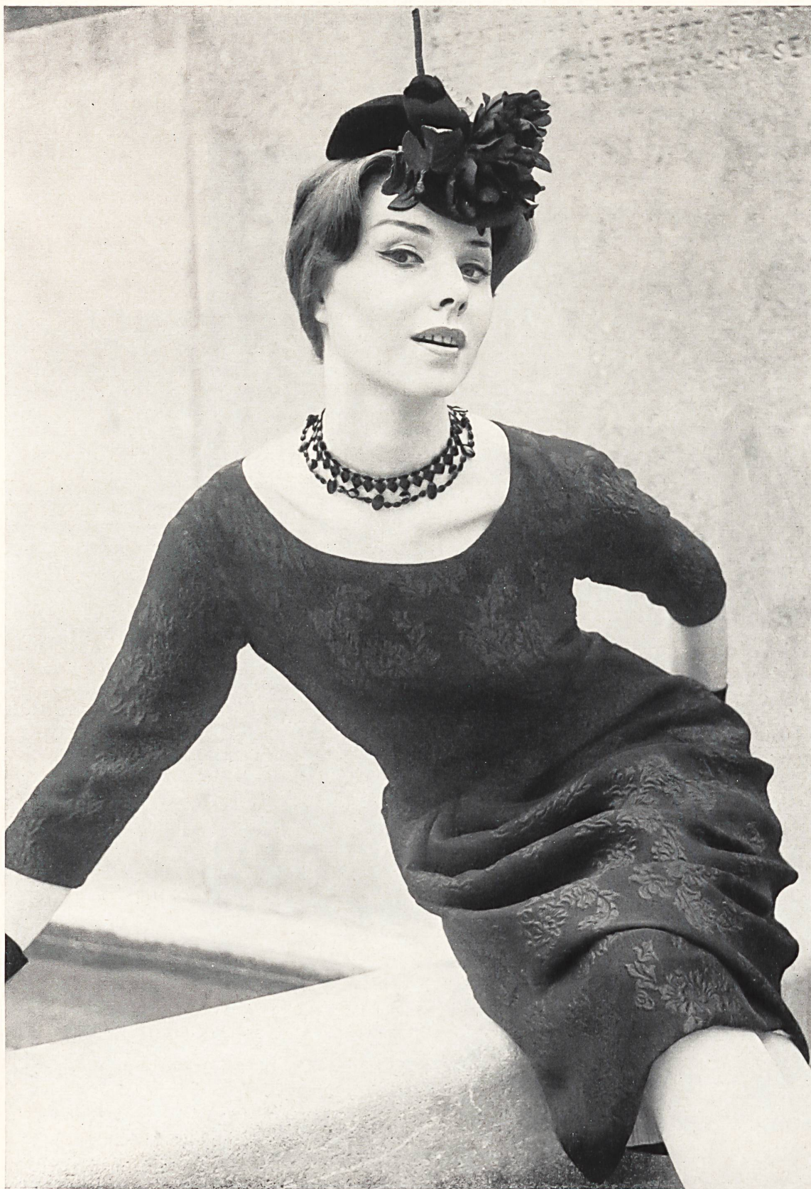
PIERRE CARDIN Crêpe façonné en relief, soie naturelle, de Soieries Stehli S. A., Zurich