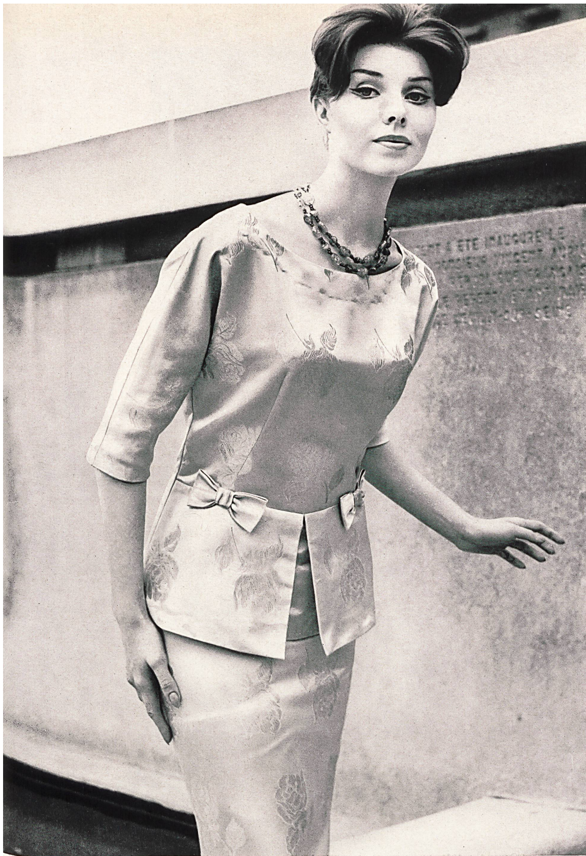
PIERRE CARDIN Duchesse façonné lamé, soie naturelle, de Soieries Stehli S.A., Zurich