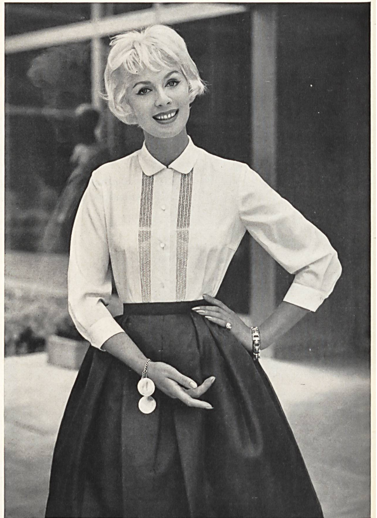
WILLY ZURCHER S. A., SAINT-GALL

Broderie en applications sur organdi de soie marine. Embroidery appliqué on navy blue silk organdie. Aplicaciones de bordado sobre organdi de seda azul marino. Stickerei, appliziert auf marineblauem Seidenorgandy