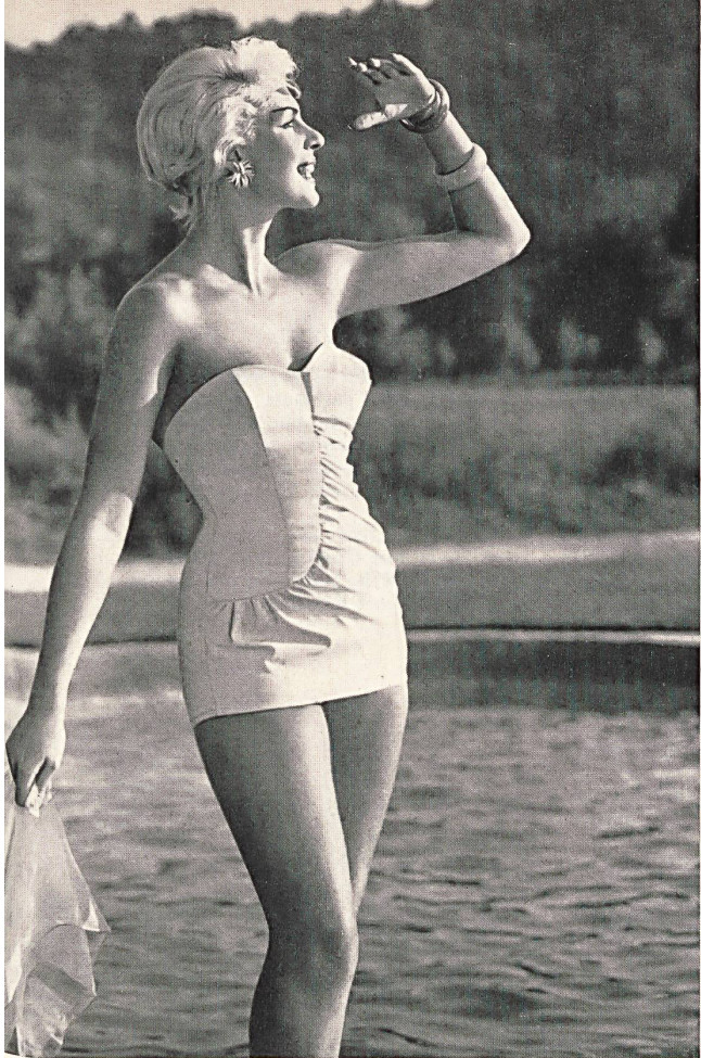
Maillot de bain en Lastex, dessin original. Lastex swimsuit, original design. Bañador de Lastex con dibujo original. Lastex Badeanzug mit originellem Dessin-Effekt.