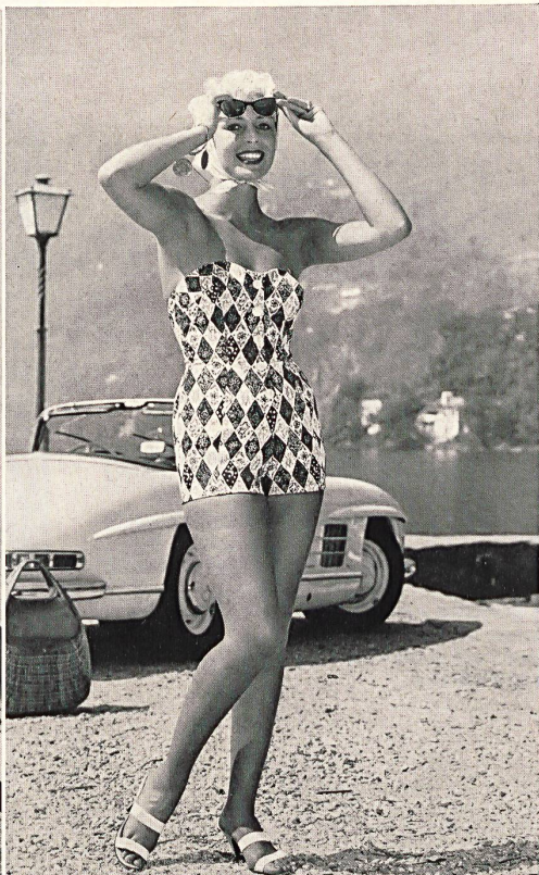
Maillot de bain en coton imprimé avec volant. Printed cotton swimsuit with flounce. Bañador de algodón estampado con volante. Elegantes Badekleid aus buntbedrucktem Baumwollstoff mit Volant.