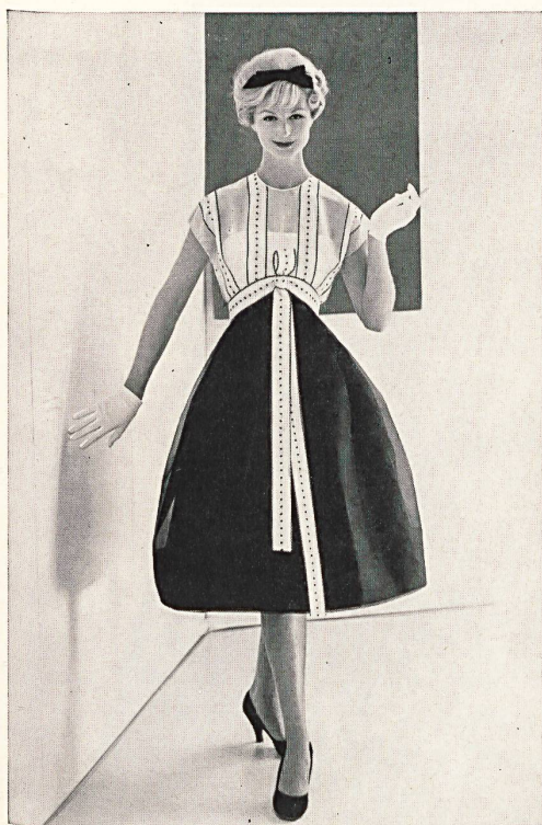
RUDOLF BRAUCHBAR & CIE LTD., ZURICH

Silk chiffon Chiffon de soie Modèle Werlé, Los Angeles