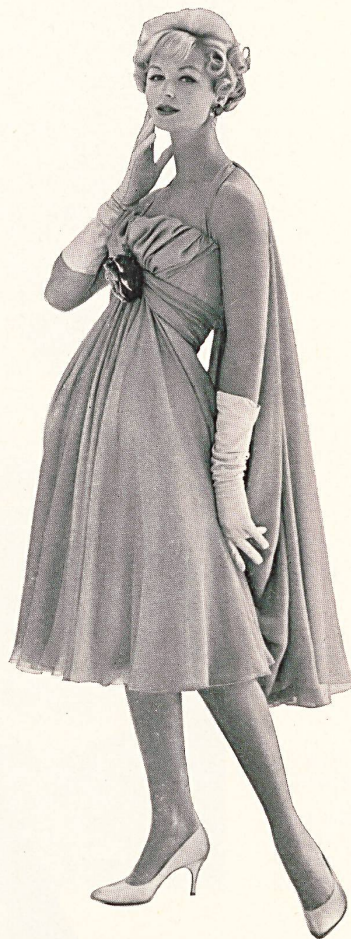
L. ABRAHAM & CO. SILKS LTD., ZURICH

Silk chiffon Chiffon de soie Modèle Werlé, Los Angeles