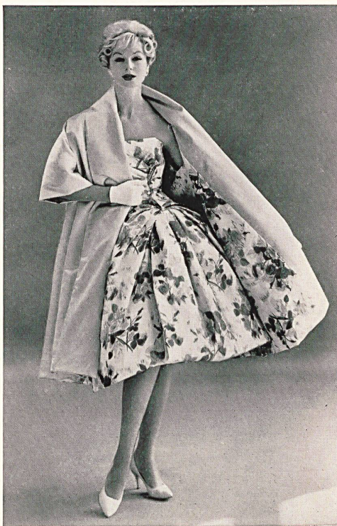
L. ABRAHAM & CO. SILKS LTD., ZURICH

Silk embroidered organdy (top), silk taffetas with silk organdy over the taffeta (skirt) Organdi de soie brodé (blouse), taffetas de soie recouvert d'organdi de soie (jupe) Modèle Werlé, Los Angeles