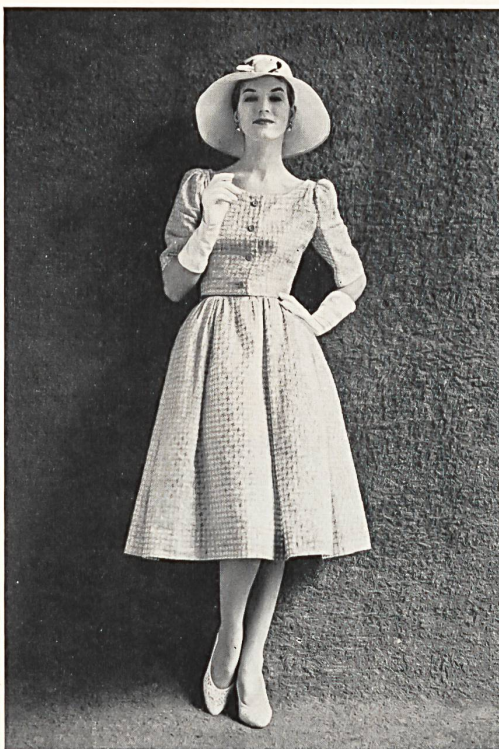
FORSTER WILLI & CO., SAINT-GALL

Multicolour embroidery on cotton organdie Organdi de coton brodé multicolore Modèle Victor Stiebel, London