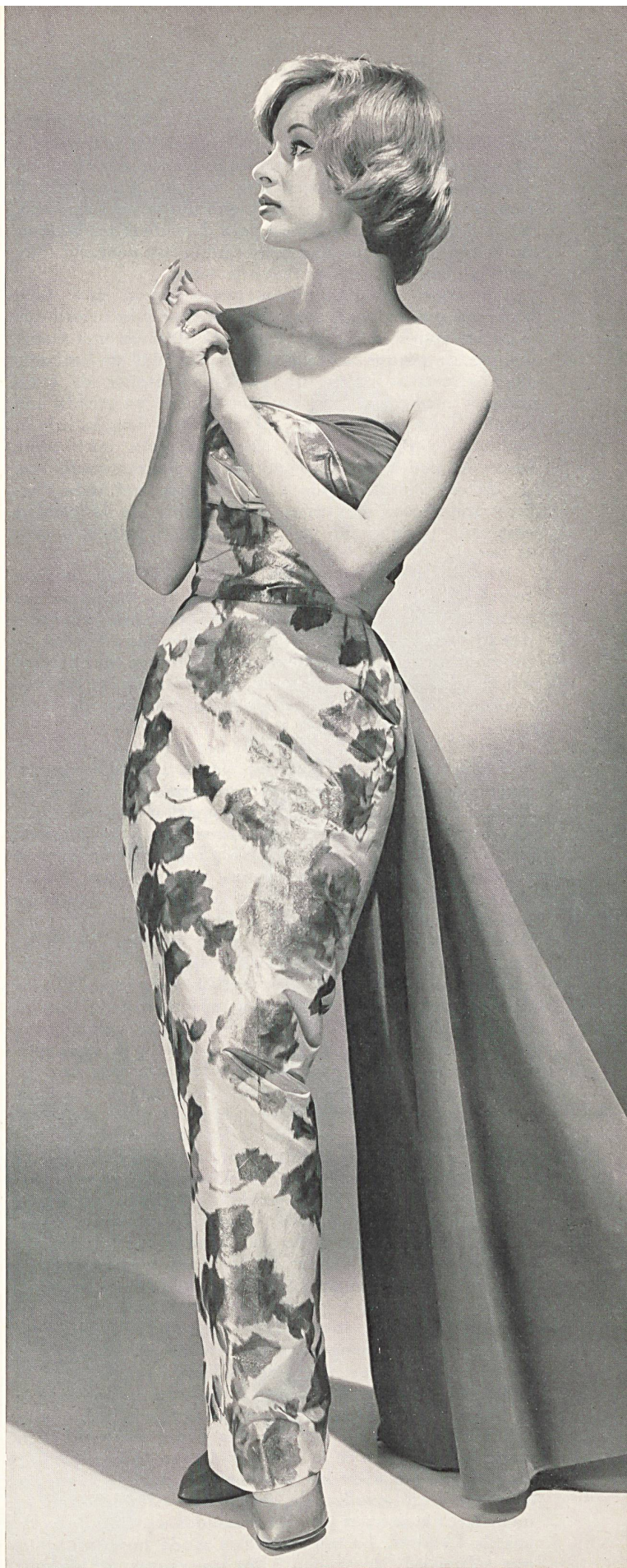
STEHLI SEIDEN A.G., ZURICH

Quizás sea mayor el optimismo que reina entre los fabricantes y compradores de vestidos de un precio medio; al cabo de tres años medianeos, parece haberse