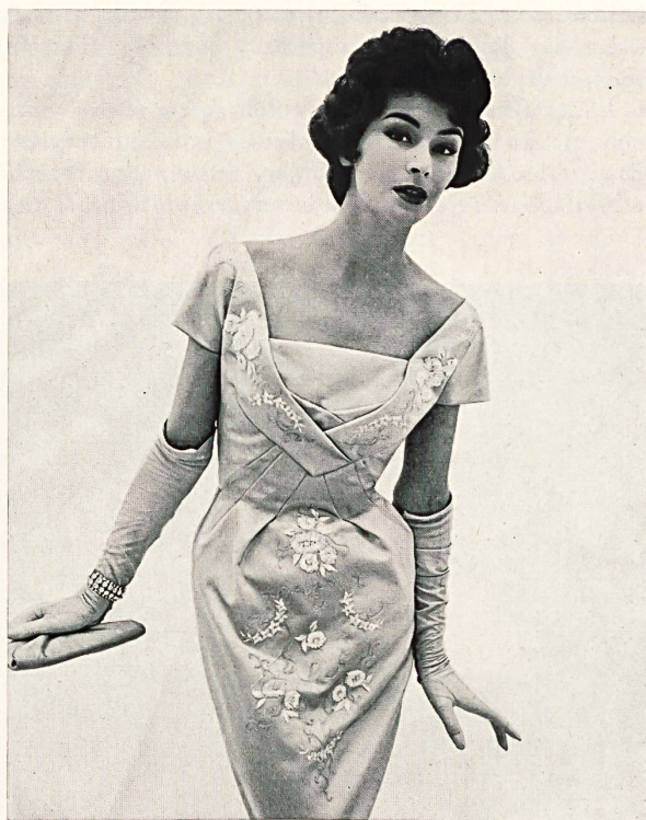
L. ABRAHAM & CO. SILKS LTD., ZURICH

Silver embroidered pure silk chiffon Chiffon pure soie brodé d'argent Modèle Roter Models Ltd., London