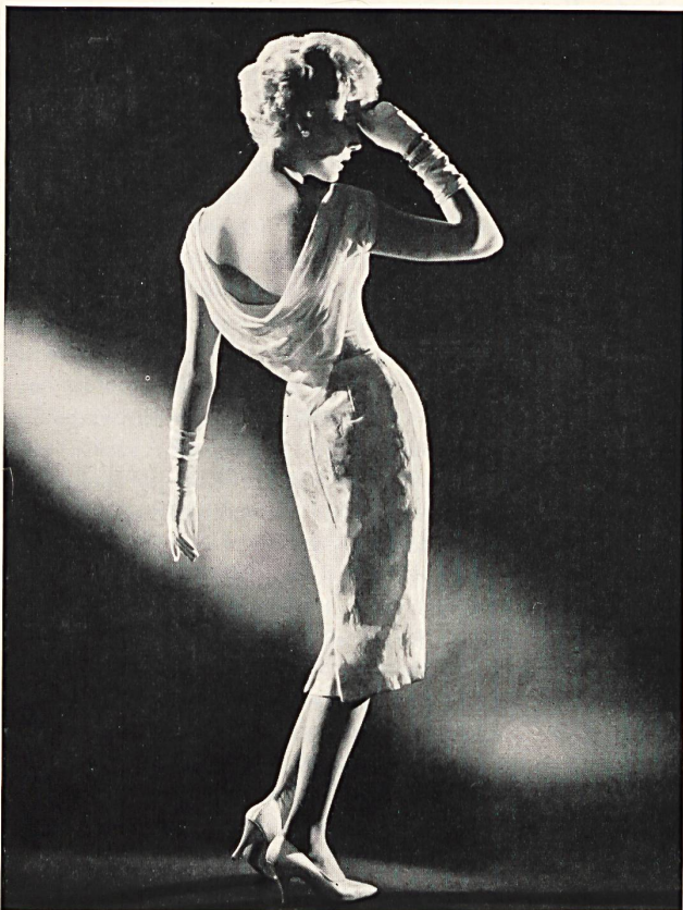
L. ABRAHAM & CO. SILKS LTD., ZURICH

Pure silk organdie Organdi pure soie Modèle Roter Models Ltd., London