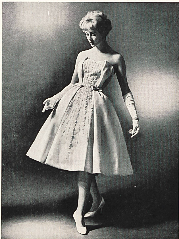
L. ABRAHAM & CO. SILKS LTD., ZURICH

Pure silk organdie Organdi pure soie Modèle Roter Models Ltd., London