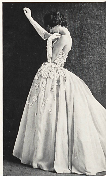
FORSTER WILLI & CO., SAINT-GALL

Embroidered cotton organdie allover Laize d'organdi de coton brodée Modèle John Cavanagh, London