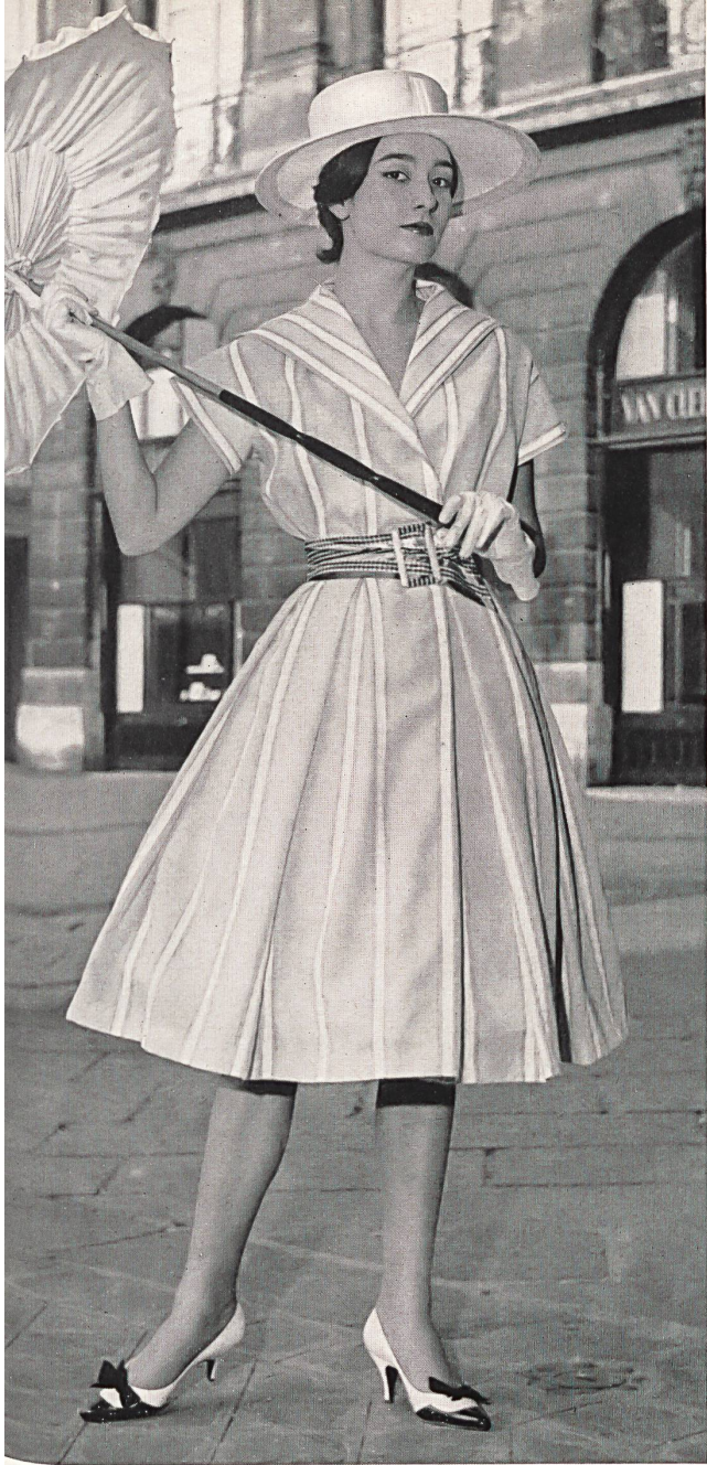
BRUYERE Recolinon fantaisie de Reichenbach & Co., Saint-Gall Distribué par la maison Montex, Paris