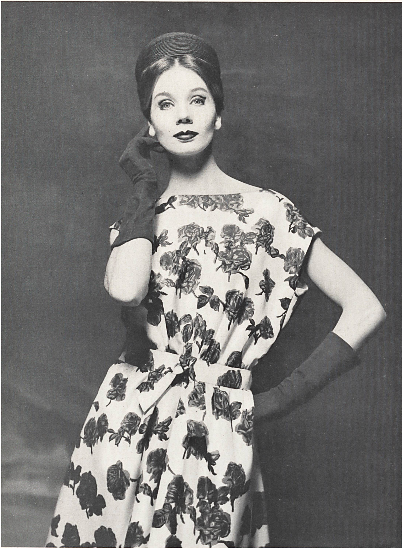
HUBERT DE GIVENCHY