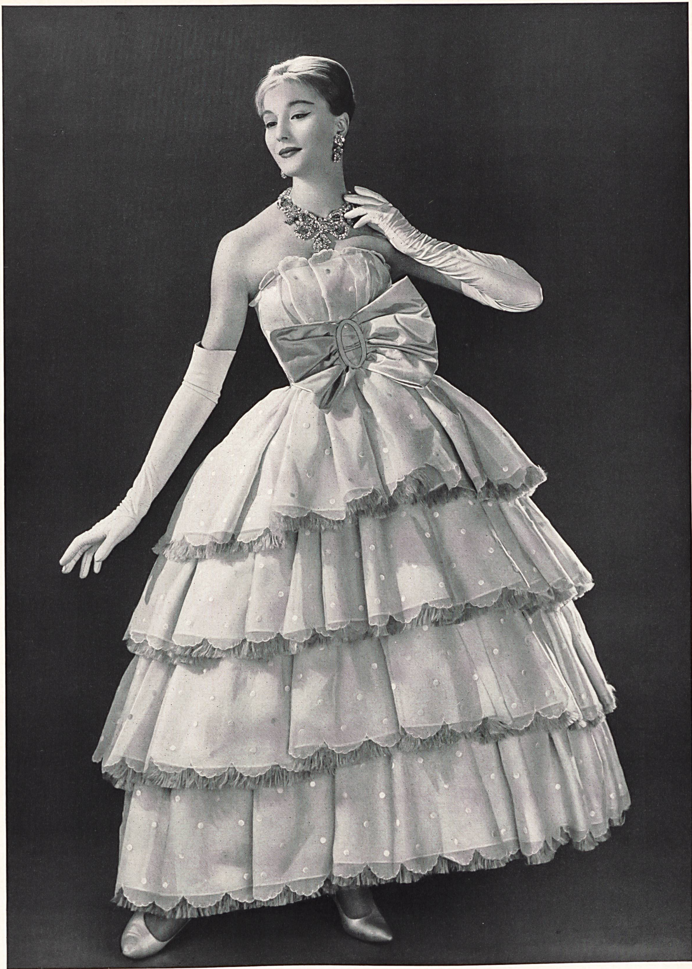
MAGGY ROUFF Volants d'organdi brodé blanc blanc de Union S. A., Saint-Gall

Modèles exclusifs - Reproduction interdite