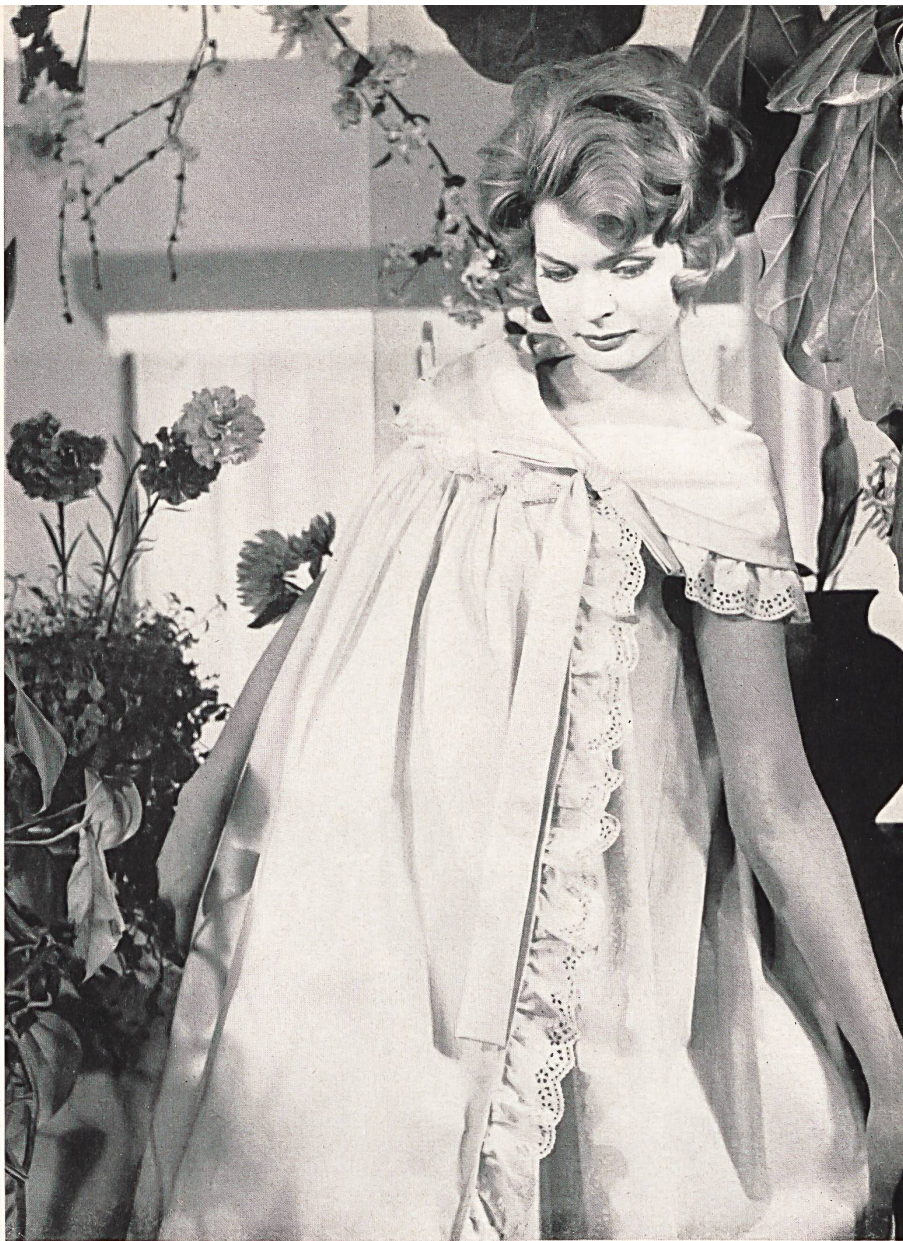
CHRISTIAN DIOR (Boutique) Volants de coton brodé de Forster Willi & Co., Saint-Gall