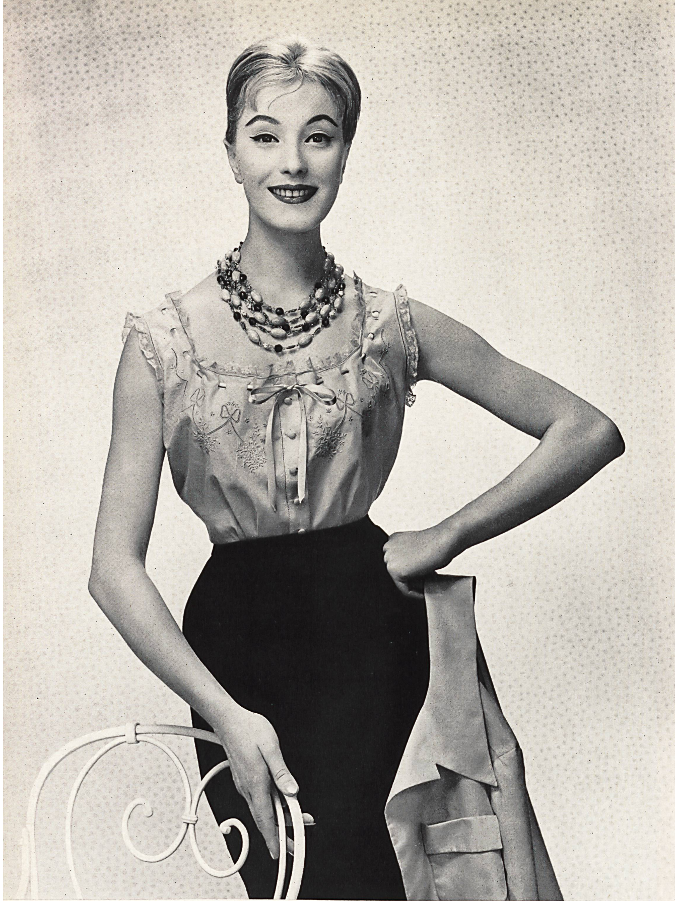
CHRISTIAN DIOR (Boutique) Nansook brodé ton sur ton de Union S. A., Saint-Gall