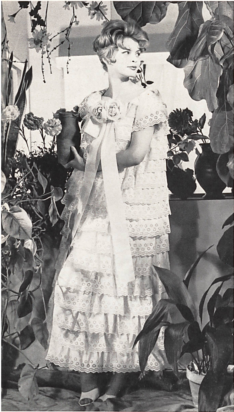
CHRISTIAN DIOR (Boutique) Volants de coton brodé de Forster Willi & Co., Saint-Gall