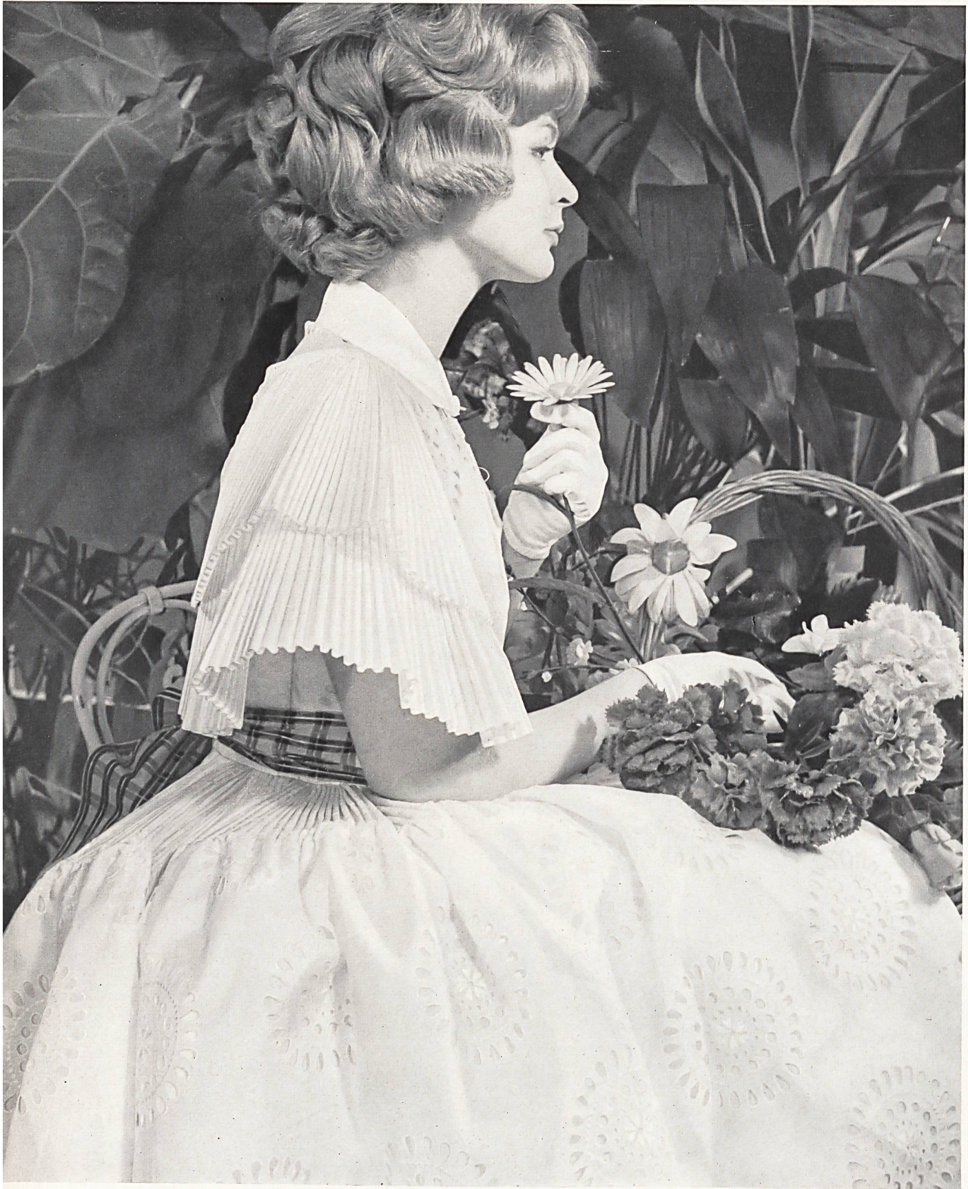
BRUYERE « Nelo », broderie Nelita, 100% coton de J.G. Nef & Co. S.A., Hérissau