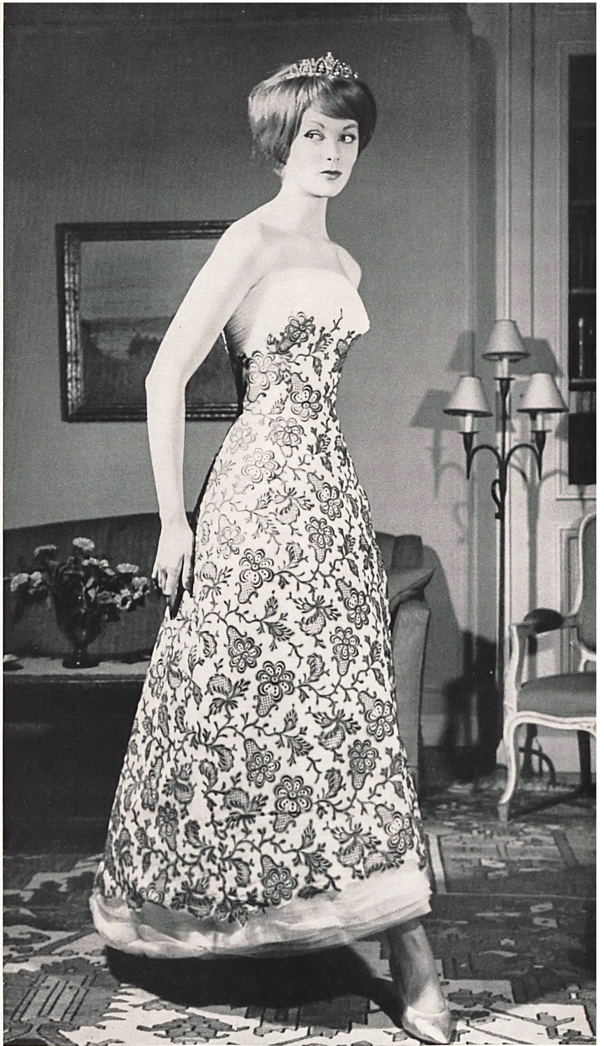
BERNARD SAGARDOY Tulle de coton brodé, fond blanc/broderie rouge, de Jacob Rohner S. A., Rebstein Agent à Paris: Lafferanderie