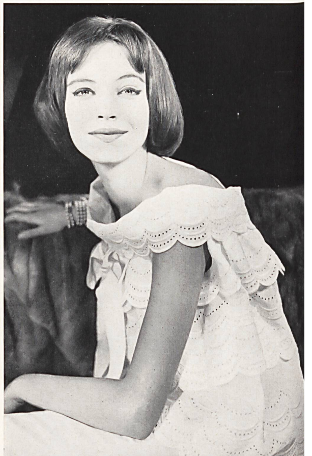
CHRISTIAN DIOR (Boutique) Broderie anglaise de Walter Schrank & Co., Saint-Gall