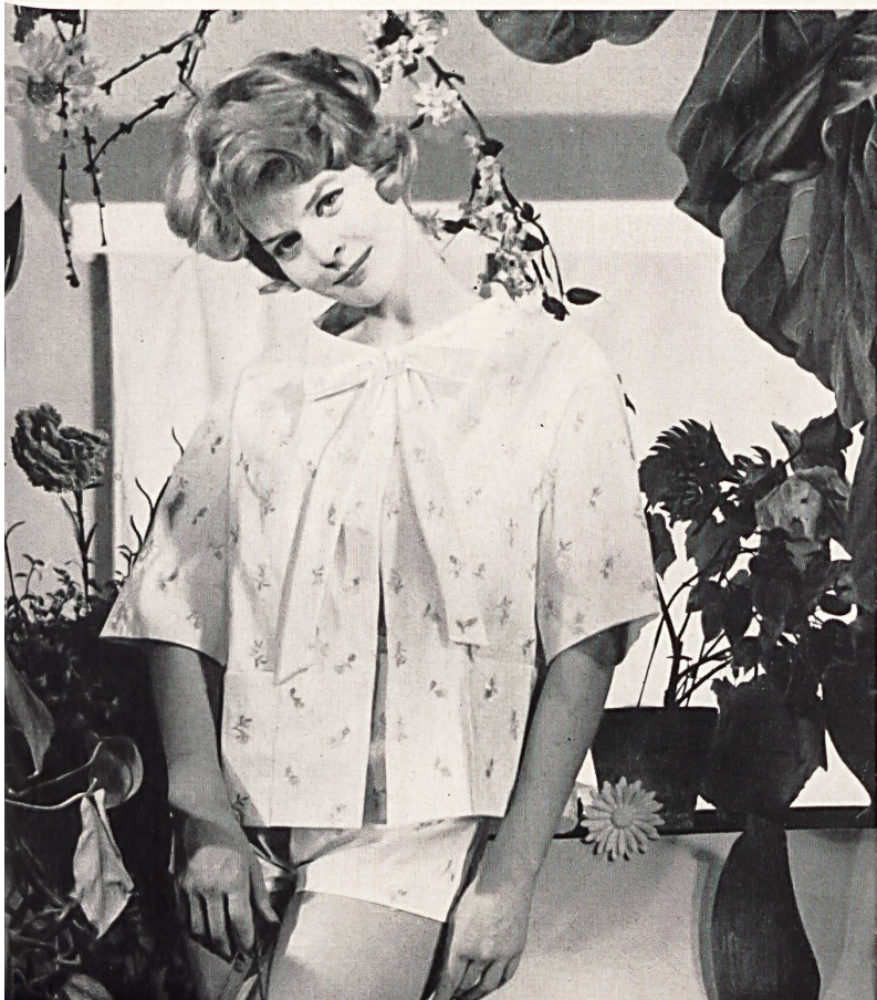
CHRISTIAN DIOR (Boutique) Plumetis brodé couleurs de Forster Willi & Co., Saint-Gall