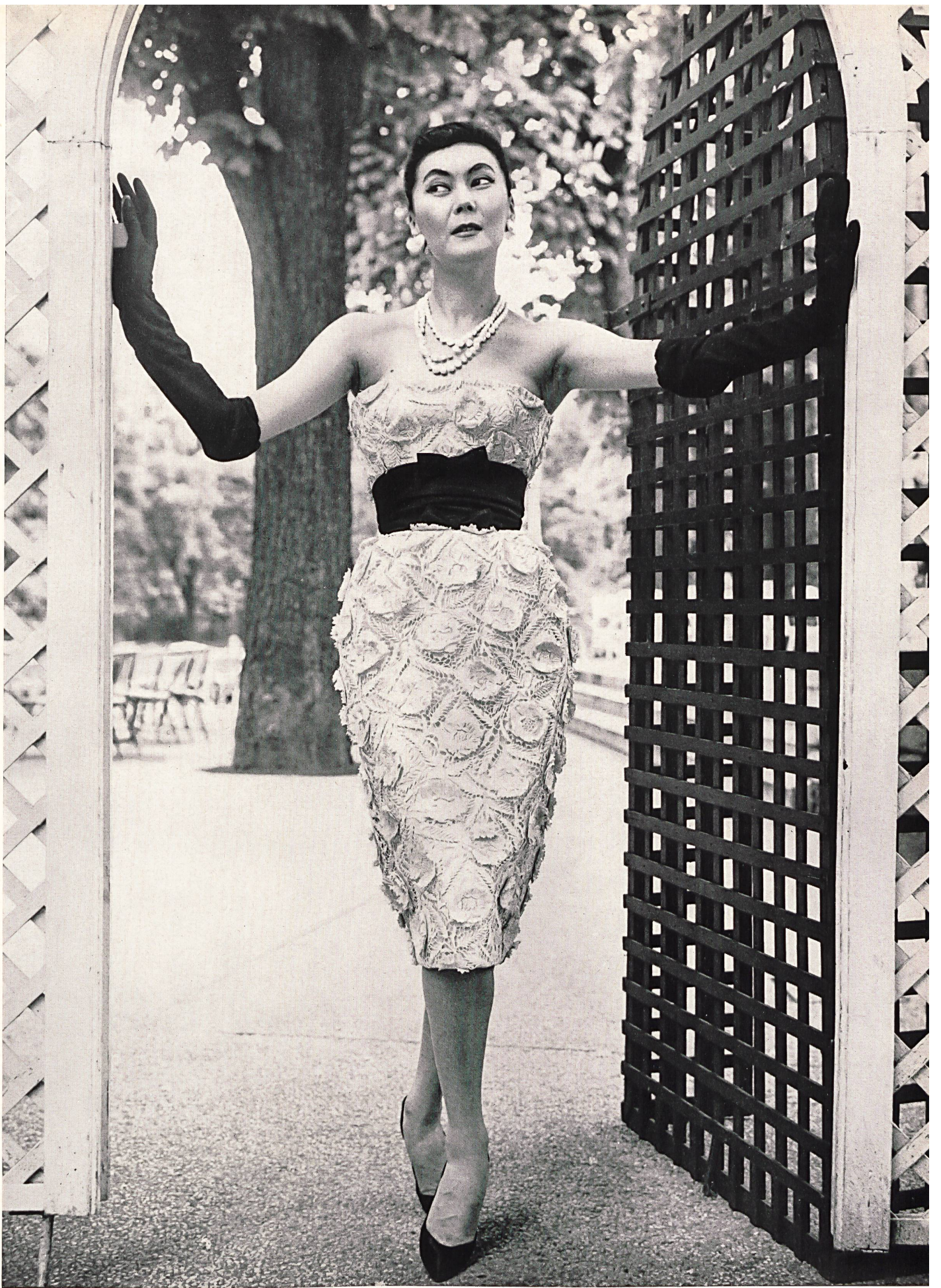
NINA RICCI Laize de guipure de Forster Willi & Co., Saint-Gall Grossiste à Paris : Les Tisseurs B. de M.