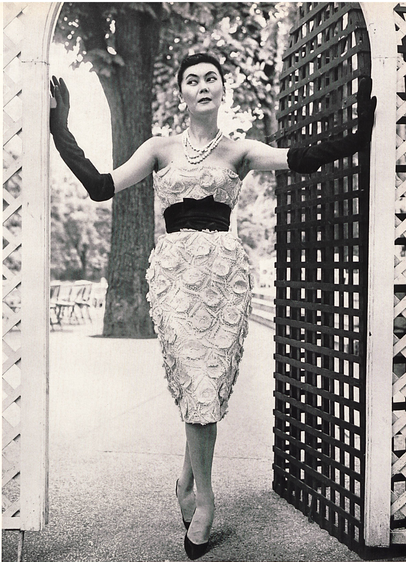
NINA RICCI Laize de guipure de Forster Willi & Co., Saint-Gall Grossiste à Paris : Les Tisseurs B. de M.