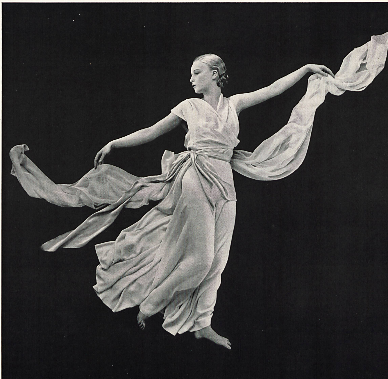
Drapeado de Madeleine Vionnet

Modebuch-Verlagsgesellschaft de Zurich y titulado « Die Mode in der menschlichen Gesellschaft » (La Moda en la Sociedad). Los directores de la publicación son, el señor Peter W. Schupisser, conocidísimo especialista zuriquense de la moda y de la costura, y el señor Renato König, profesor ordinario de la Universidad de Colonia. La obra en cuestión, con más de 500 páginas, tiene el tamaño de la presente Revista y está profusamente ilustrada. Contiene especialmente 22 planchas en colores y cerca de 200 ilustraciones en heliograbado intercaladas en el texto y a plena página. La lista de los distintos