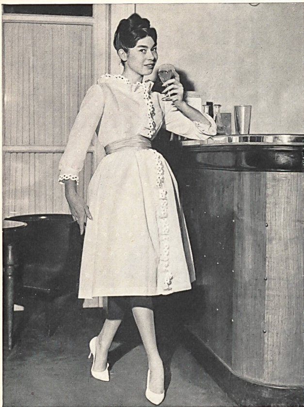
«RECO», REICHENBACH & CO., SAINT-GALL

Batiste brodée «Minicare» blanche. Embroidered white «Minicare» batiste. Modèle Bellerive, Nice.