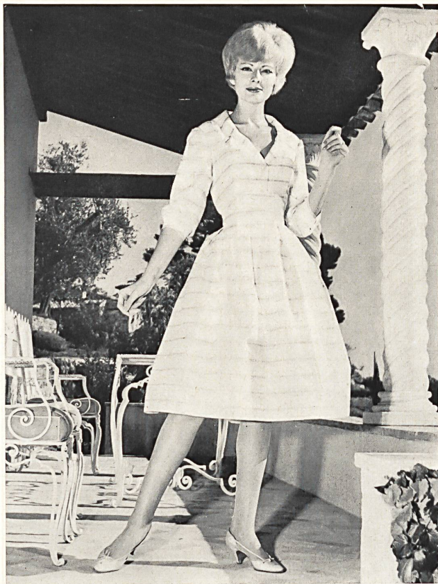
«RECO», REICHENBACH & CO., SAINT-GALL

Batiste brodée «Minicare» blanche. Embroidered white «Minicare» batiste. Modèle Bellerive, Nice.