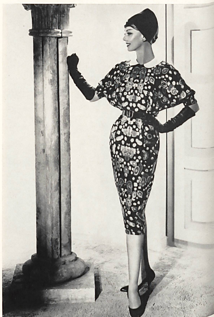
RUDOLF BRAUCHBAR & CIE, ZURICH

Pure silk beige plain fabric (coat) Tissu beige uni pure soie couleur ficelle (manteau) Model by Irene Cove, Inc., Culver City (Cal.)