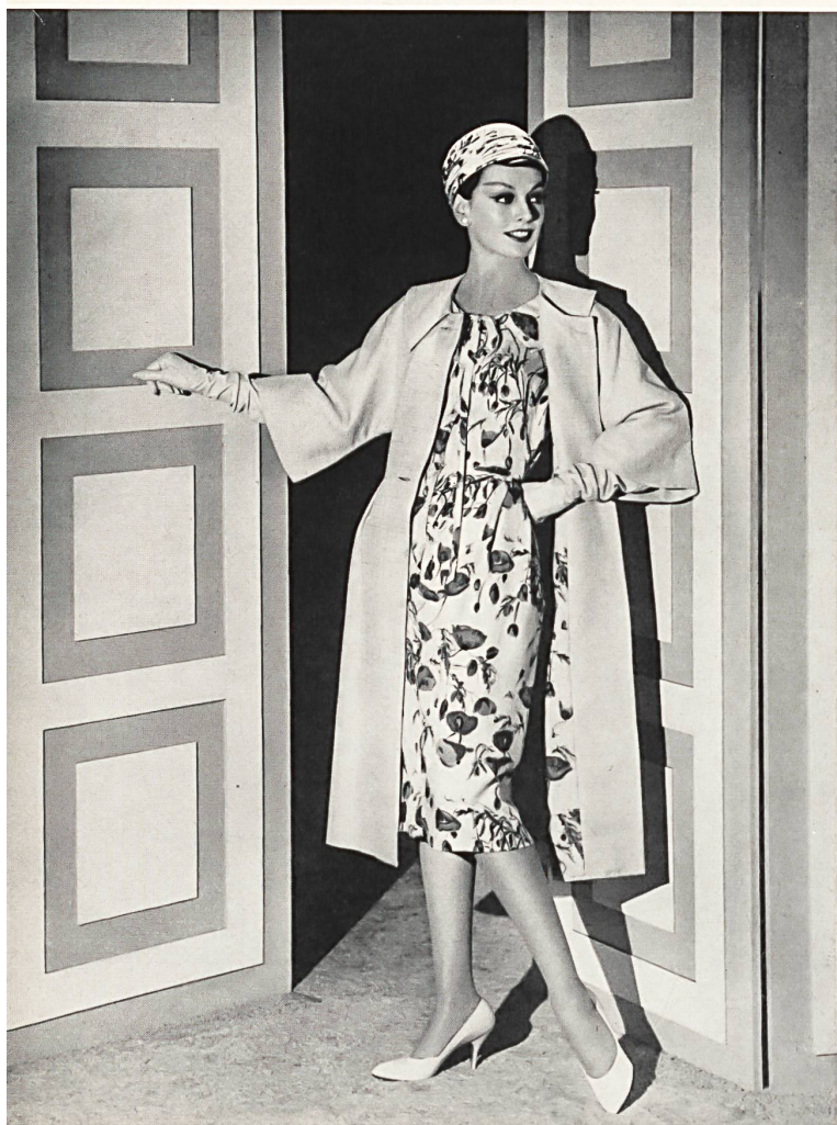
RUDOLF BRAUCHBAR & CIE, ZURICH

Pure silk beige plain fabric (coat) Tissu beige uni pure soie couleur ficelle (manteau) Model by Irene Cove, Inc., Culver City (Cal.)