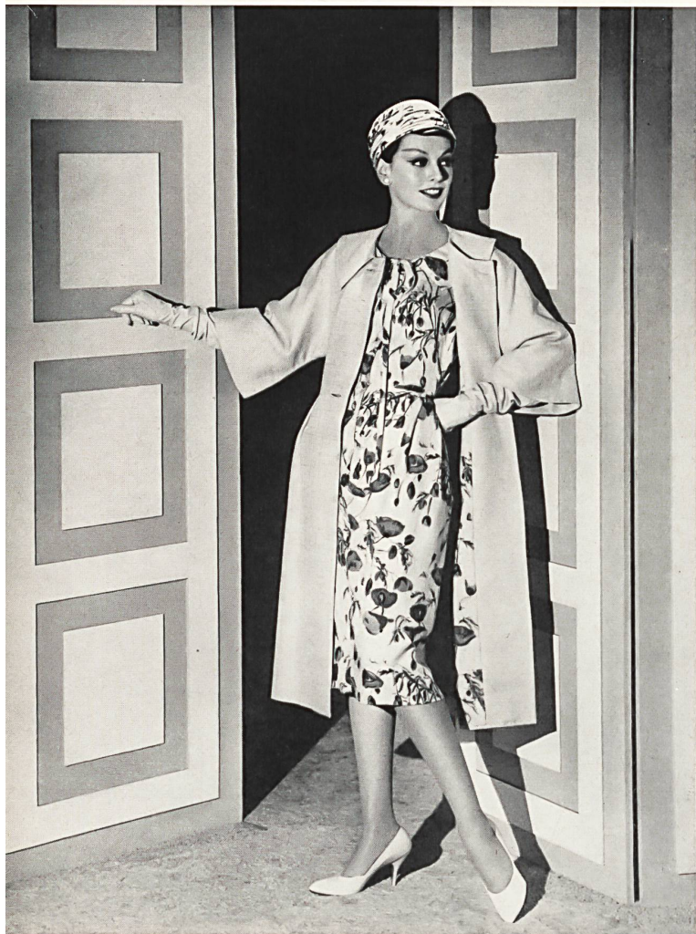
RUDOLF BRAUCHBAR & CIE, ZURICH

Pure silk beige plain fabric (coat) Tissu beige uni pure soie couleur ficelle (manteau) Model by Irene Cove, Inc., Culver City (Cal.)