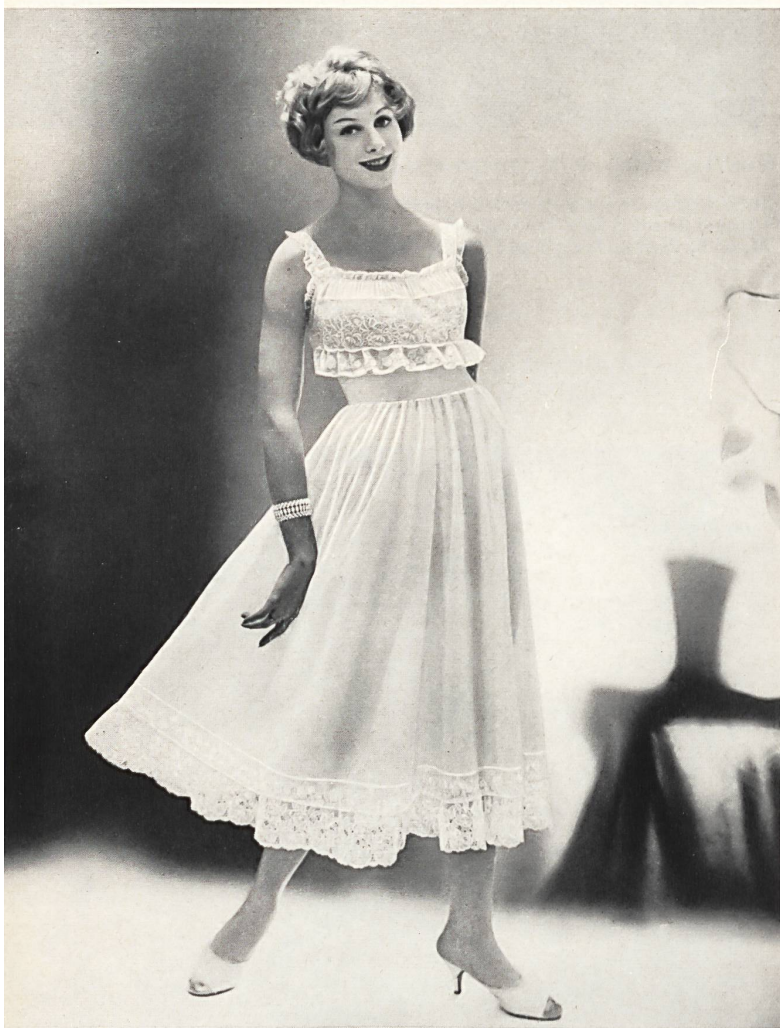
BISCHOFF TEXTILES LTD., SAINT GALL

Embroideries on nylon. Broderies sur nylon. Model by Kickernick, Inc., Minneapolis.