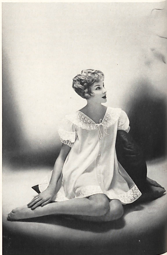
BISCHOFF TEXTILES LTD., SAINT-GALL

Embroideries on nylon. Broderies sur nylon. Model by Kickernick, Inc., Minneapolis.