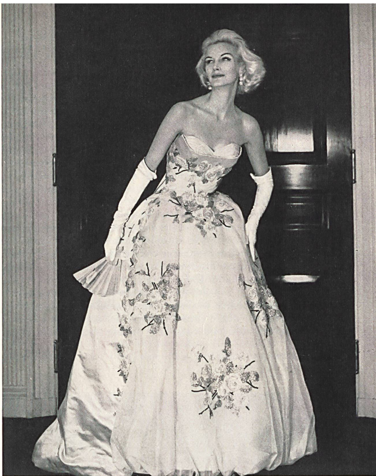
FOSTER WILLI & CO., SAINT-GALL

El que los tejidos finos de algodón, los bordados, las novedades de lana, los tejidos de mezcla, las mallas importadas de Suiza hayan adquirido una fama tan merecida en la confección americana, se lo deben en gran parte a los progresos incesantes de los procedimientos de acabado y de teñido. Wash-and-Wear, Drip-and-Dry, No-iron son las características muy modernas de los artículos suizos e inclusive de los delicados bordados y de los tejidos de